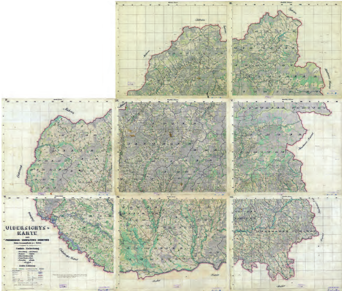
■ A pozsonyi adókerület térképe, 1858 (OSZK Térképtár TK 1 903.)