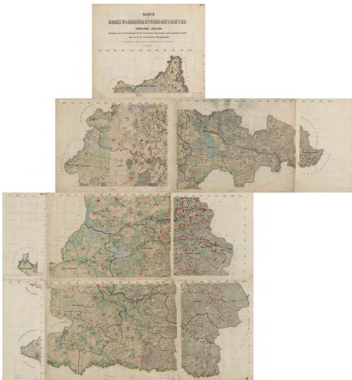
■ Johann Mischkowsky nagyváradai adókerületet ábrázoló térképe, 1855 (OSZK Térképtár TK 2 086.)