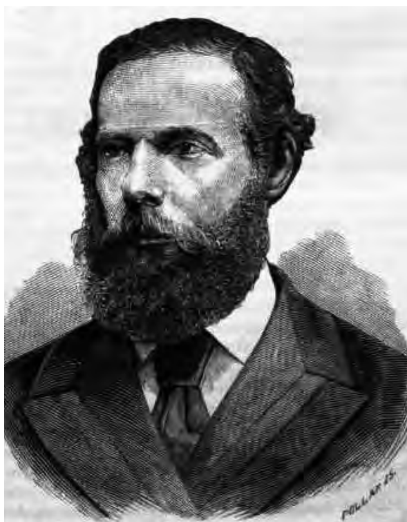
■ Zichy Nándor (1829–1911) gróf, országgyűlési képviselő