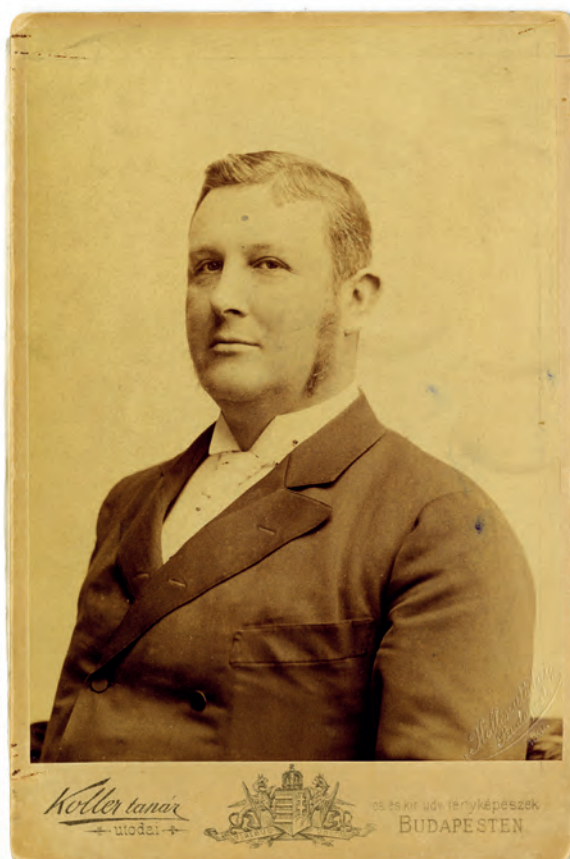
■ Wekerle Sándor (1848–1921) pénzügyminiszter (1889–1895), az állami tisztviselők fizetéséről szóló törvényjavaslat előterjesztője

Ez a rendszertelenség az állások közötti hierarchiában és adminisztratív szempontból hátrányt jelentett, de társadalmi hatása nem volt jelentős. A nagy probléma, az akkor már tartahatatlanság állapot az idők folyamán abból adódott, hogy egyrészt a kulturális élet új igényeket termelt, másrészt a gazdasági élet fejlődésével a megélhetés alapfeltételeinek megszerzése nehezebbé vált, a pénz vásárlóereje csökkent, a termények és lakások megdrágultak.