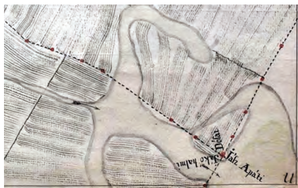
■ 1. Jászdózsa–Jászapáti–Jászkóhalma sarokpont Bedekovich Lőrinc térképén. XII. szelvény, részlet (MNL HML, Térképtár Heves T 120.)

A Jászdózsáról 1852-ben, mindössze három évvel a szabadságharc leverését követően 1:7200-as méretarányal készített ideiglenes felmérés térkép-vázlatán 140 határdomb látható. 8 Az egyébként viszonylag kevés adatot tartalmazó, a belterületet üresen hagyó térkép különös alapossággal ábrázolja a határvonalat és a határjeleket (3. kép). A határdombokat λ jellel tünteti fel. A sarokhatárokon is csak egy-egy dombot jelöl – a dózsait – a nyilvánvalóan akkor is ott lévő háromból. A határdombok közötti távolság általában a 30 bécsi öl többszöröse (2x, 3x, 4x, 5x 30 öl stb.) – a leghosszabb a 13 x 30, azaz 390 öl (740 méter) távolság. A térkép a határon – a felmérési utasításban előírt jelkulcsnak megfelelően végig folytono-