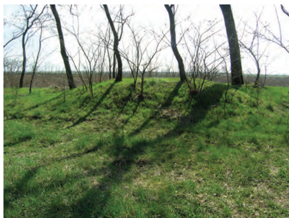
■ 9. A birtokvázlaton 3-as számmal jelölt határdomb Jászdózsa–Jászapáti határon (Jászdózsa birtokvázlata, 1884)

A 32 km hosszúságú jászdózsai határvonalon jelenleg 34 határdomb lelhető fel. A fél mé-