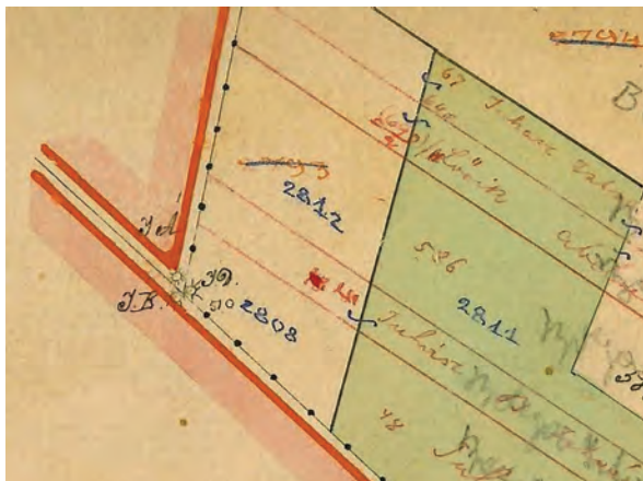
■ 17. Három határdombos sarokhatár ábrázolása Jászdózsa birtokvázlatán