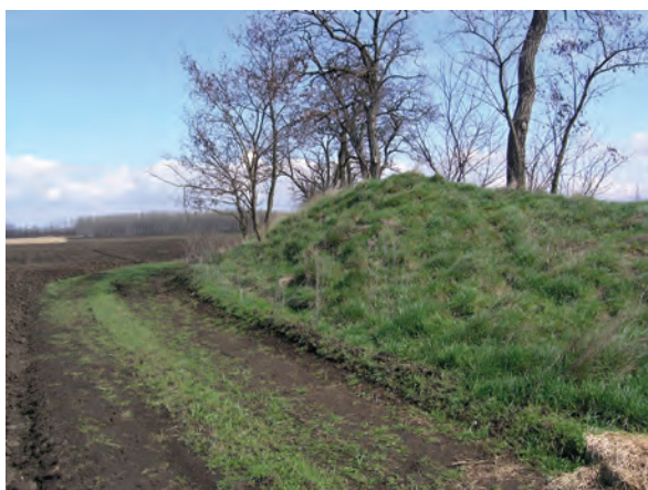
■ 8. A birtokvázlaton 8-as számmal jelölt határdomb a Jászdózsa–Jászapáti határon

A kataszteri felmérések térképei azt mutatják, hogy a határdombokat elsősorban a határvonal töréspontjain, az állandó vagy időszakos vízfolyások, illetve a holtágak egyik vagy mindkét partján, valamint a településközi utaknak és a helyi dűlőutaknak a határhoz érkezési pontjainál készítették. Mivel a vízjárta területen természetes magaslathalmok, kisebb-nagyobb halmok is voltak, amelyek szerepet kaphattak a két település közötti határ kijelölésekor, feltételezhető, hogy azok magasztásával is készítették határdombokat. A 19. században a határvonal nagy részén – lehetséges, hogy teljes hosszában – szekérral járható dűlőút vezetett. A nyugati határt részben a Berény–Árokszállás közötti, Jászberényt Gyöngyössel összekötő országút jelentette, amely