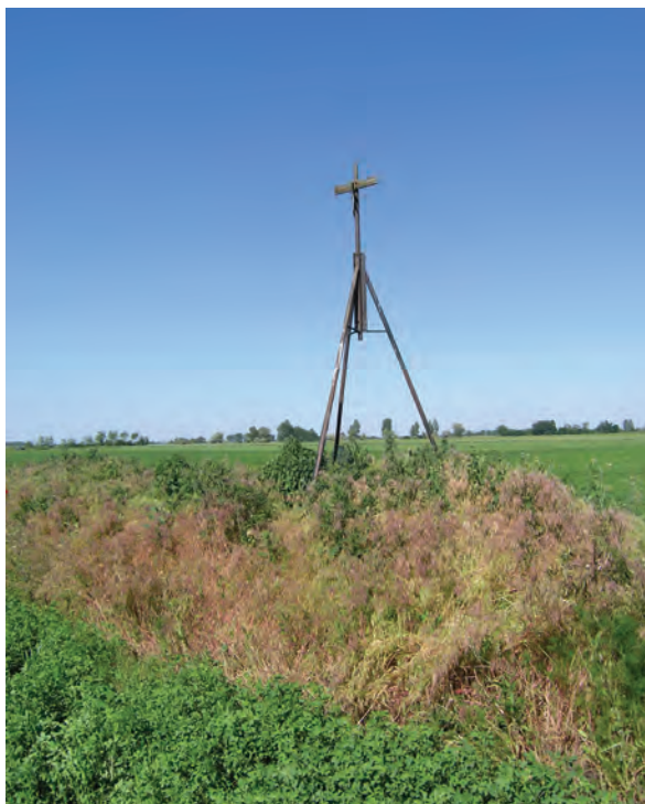
■ 13. Gúla (tripód) határdombon a Jászdózsa–Jászapáti határon

A vasútvonalhoz legközelebb meglévő határdomb (10. kép) tetején szabályos hasáb alakú, terméskőből faragott földmérési jel van, „KF” bevéséssel. Eredete nem ismert, hasonló tudomásom szerint eddig nem írtak le az országban. Az 1884. évi kataszteri térkép háromszögelési pontot jelöl ezen a helyen, a 16-os számú határdomb jelét négyszöggel keretezve