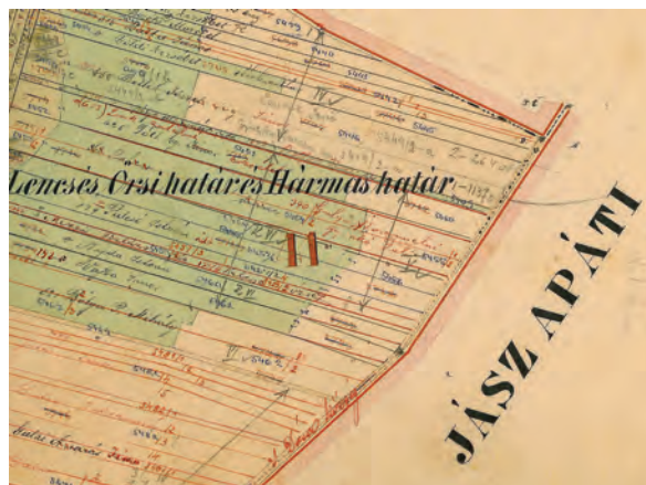
■ 6. Javításként beírt „J Dózsa község” felirat a „Hármáshatár” felé vezető határvonalon (Jászdózsa birtokvázlata, 1884)

kat. Ekkor kerültek viszont a határon menő dűlőutakra a „J Dózsa község”, illetve „Jászdózsa község” feliratok, ami valószínűleg azért volt fontos, mert a határdombokat előzőleg több szakaszon pont az útra rajzolták (6. kép). A mai helyzet alapján az feltételezhető, hogy ezek a határdombok valóban a dűlőút vonalában álltak, amely azonban a falu felőli oldalról kikerülte a dombokat.