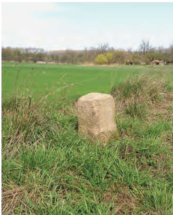
■ 12. „KF” betűkkel jelölt oszló a 16. sz. határdombon

ter magas, kör alaprajzú, valójában csak egydombos „Hármashatár” a Jászdózsa–Tarnaörs közötti határ keleti sarokpontja és egyben a Jászdózsa–Jászapáti határ északi sarokpontja. A „Hármashatár” a dózsai lakosok által ma is ismert és használt helynév. A megnevezés az öt sarokhatár közül egyedül a Jászdózsa–Tarnaörs–Jászapáti sarokra vonatkozik. A Hármashatáron kívül öt határdomb található északon Tarnaörs felé. Keleten, a Jászdózsa–Jászapáti határon, annak két végpontját lezáró két „hármashatáron” kívül hat további határ-