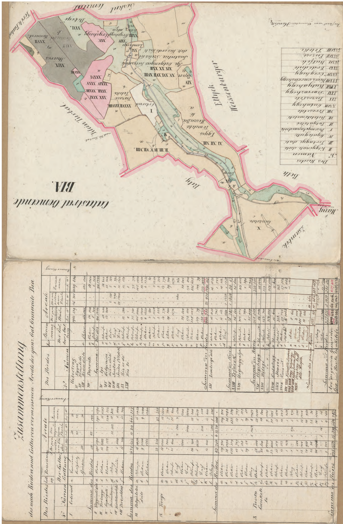
Anton Hončík: Bia katasteri térképvázlata területi kimutatással, 1858 (OSZK, Térképtár Bv 1 906/2-3.)