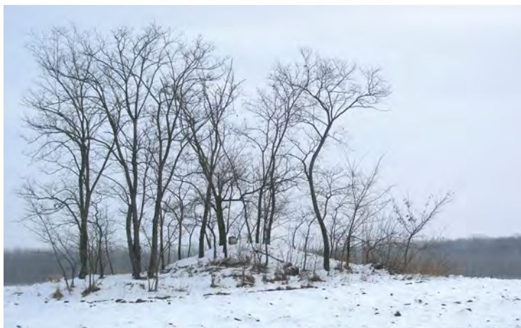
■ Köves határdomb jelkövel Pusztamonostor és Jászfényszaru határvonalán