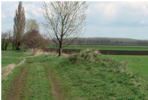
■ Jelköves határdomb a jászdózsa-i határon vezető dűlőútról nézve, déli irányból (A helyszíni felvételeket a szerző készítette)