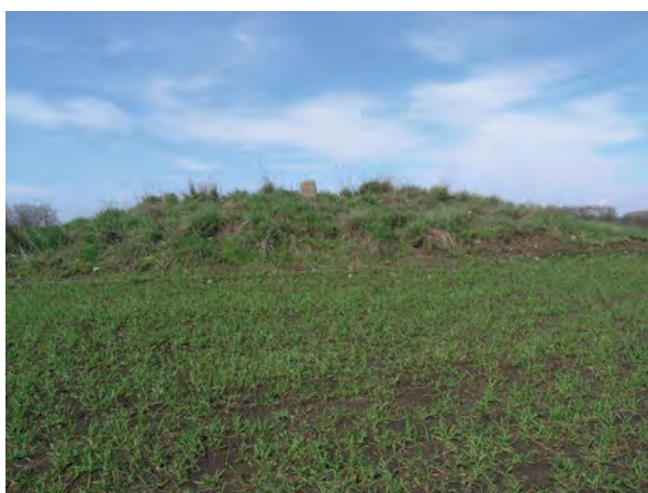
■ A határdomb a jelkövel Jászapáti felől, keleti irányból nézve

a múlt század hatvanas éveiben, a nagyüzemi szántóföldi táblák kialakításakor.