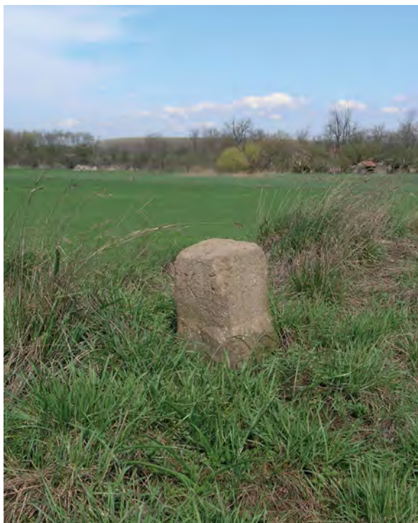
■ Jászdózsza-Jászapáti határdombon lévő jelkő