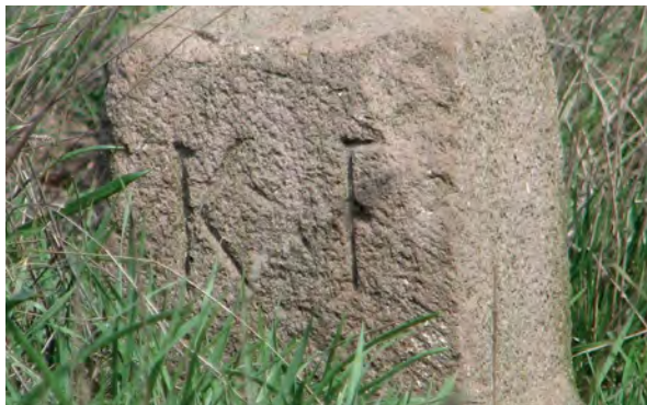
■ A határdomb a jelkövel Jászapáti felől, keleti irányból nézve