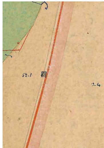
■ 16. számú határdomb jelkövel, Jászdózsa 1884. évi birtokvázlatán

Jászdózsaé 1884-ben történt, így a jelkő állítására ebben az időben kerülhetett sor. 5