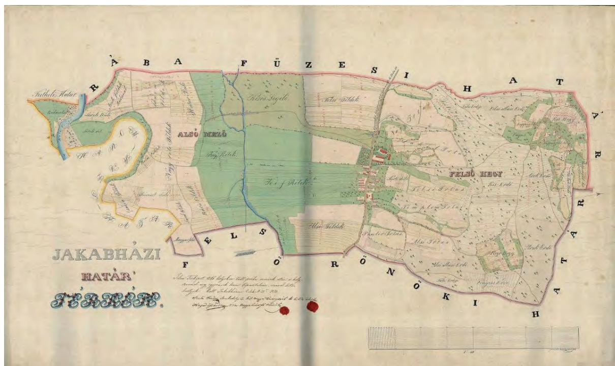
■ Jakabháza határtérképe, 1850 (MNL VaML, U 260.)

és Benda Jakab mérnök urak folyamodására a városi Catastrális földkönyv és mérnöki hitelesített telekkönyvek eredetbeni kiadása iránt a becslő bizottmány véleménye bevértatik. 28