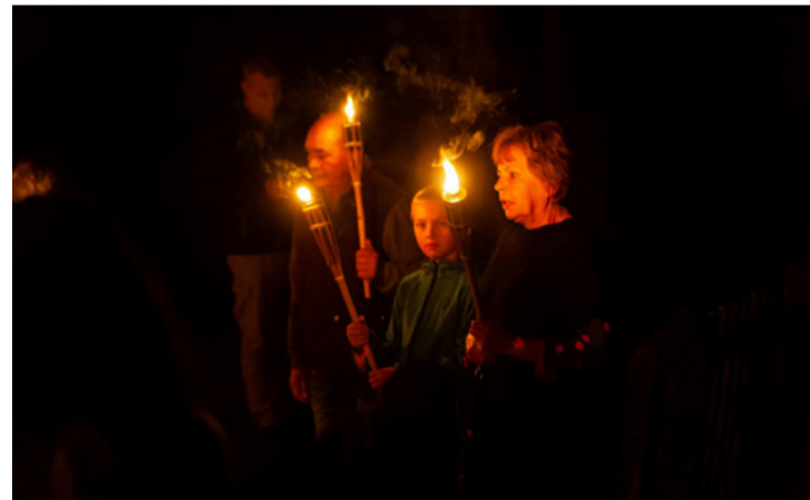
Ezúttal sem maradhatott el a fátylós felvonulás Csingervölgyben