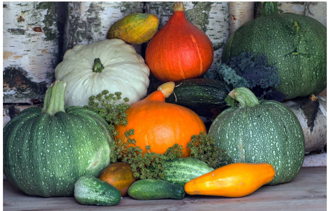
Tökkavalkád – sült főve...

Sokan ismerik, szeretik és fogyasztják ezt a növényt ami eredetileg Amerikából származik, és a spanyolok hozták be Európába a 16. században. Régebben a szegény emberek kedvelt eledel volt. A gazdák takarmányozás céljából termesztették, ma azonban, mondhatni, reneszánszát éli ez a növény. Népszerű alapanyagának számít mind a házi, mind a mesterkonyhákban. Rengeteg fajtája van. Hazánkban a legismertebb és legközkedveltebb tökfélék a patisszon, a cukkini, a spárgatök, a sonkatök és a csillagtök. Édesen, sósan, sütvé, főzve, töltve a tök elkészítési módjainak csak a képzeletünk szab határt. A legkisebbek számára pürésíthetjük, de elkészíthetjük hagyományos főzelékként, fogyasztjuk fűszeresen, pirítóssal, de süthetünk belőle süteményt vagy tortát is. Ha lisztmentesen