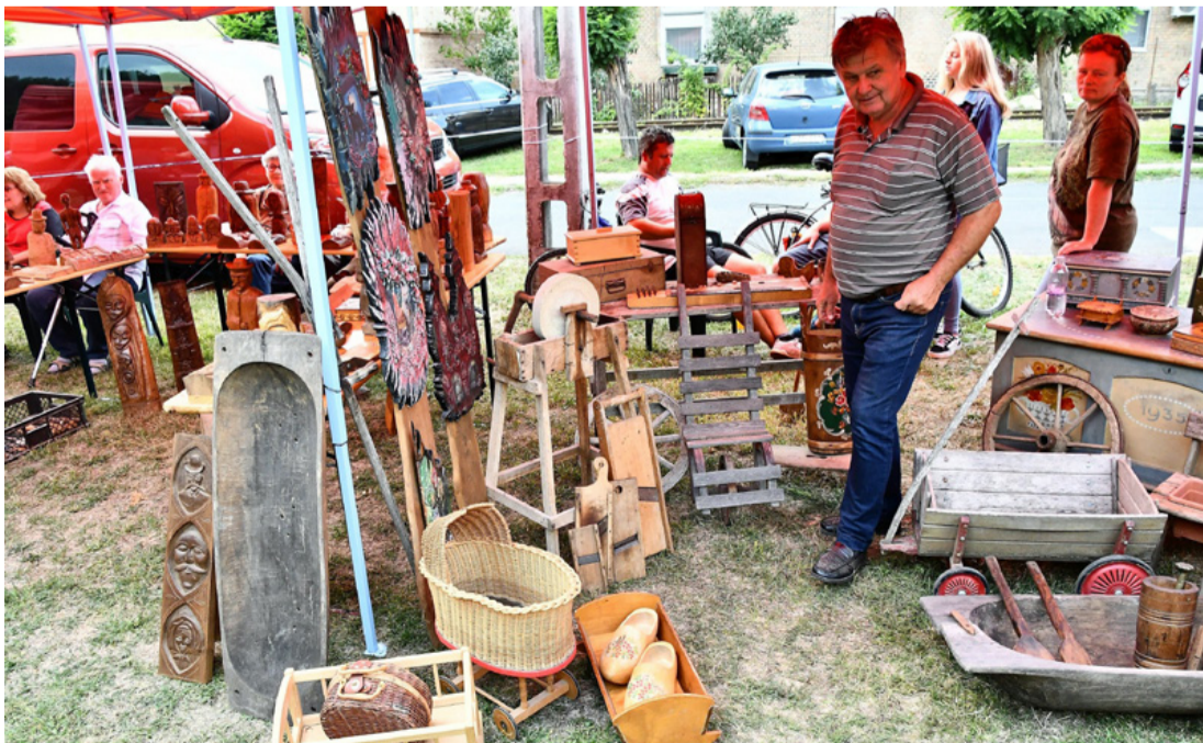
Itt minden a fáról szólt