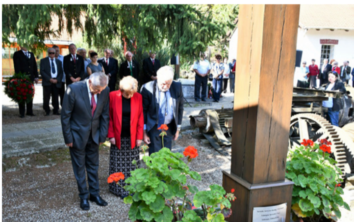
Főhajítás a kopjafánál

*1951-től szeptember első vasárnapján országosan egységesen tartják a bányásznapot, az 1919 szeptember 6-án eldőlt tatabányai csendőrsortűz áldozatainak emlékére. A tatabányai bányászati nagyon mostoha körülményei, az 1950-es nagy bányászserencsétlenség és az ezek miatti elégedetlenséget akarták csillapítani az ország vezetői a bányásznapi törvénybe iktatásával.