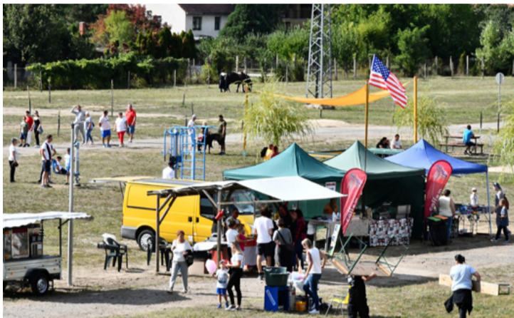
Élettel telt meg az újonnan felavatott bányakert az ünnepnapon

■ Hamar megkedvelte a padragkúti lakosság a Bányakertet, mi sem bizonyítja jobban, mint az, hogy a falunapon, szeptember 4-én a 10 órára meghirdetett kezdéskor már sokan voltak. Egyre érkeztek a kellemes nyárutói napon kikapcsolódni, sportolni, szórakozni vágyó kisgyermekes családok, baráti társaságok, fiatalok, nyugdíjasok.