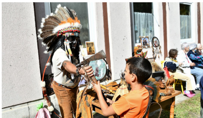
Mindenkit magával ragadhatott a képzelete