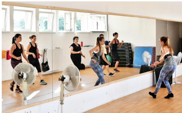
Tükörrel jobban megy a hölgyeknek