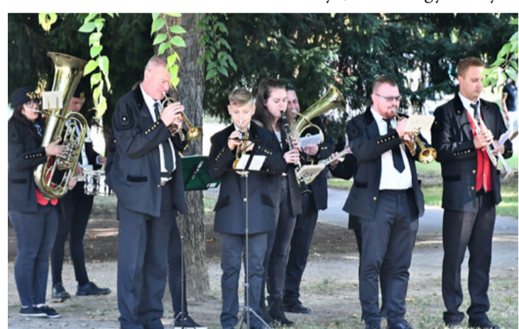
Zenéjével őrzi a hagyományokat a bányász zenekar

már elkezdődtek a munkálatok, számíthatnak arra a padragkútiak, hogy a közeljövőben megvalósul a Szivárvány, a Veres Péter, a Bólyai János utca vízelvezetése. Lesz egy meglepetés is, a 13. felújítás, de az majd akkor derül ki, ha elkezdődnek a munkák.