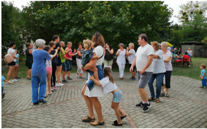
Az egyesület a településrészt életének egyik mozgatórugója

A Civil Fórum Padragkútért Egyesület az elmúlt nyári hónapok során több sikeres rendezvényt is szervezett az egyesületi tagok és a településrészt lakosai számára. A rendezvények apropóját az egyesület megalakulásának 20 éves jubileuma, illetve Csékút és Padrag községek egybeolvadásának 60. évfordulója adta.