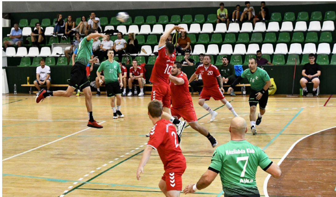
Igazi kézilabda fieszta volt a Sportcentrumban