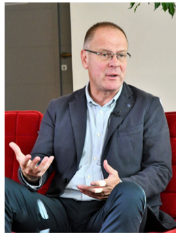
Dr. Navracsics Tibor

Az interjúban szó esett még a tervezett ajkai fejlesztések-