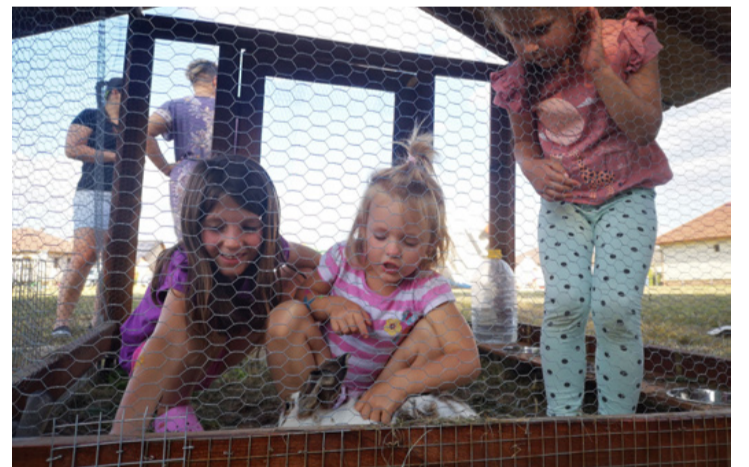
Népszerű volt az állatsímozgató ketrec is