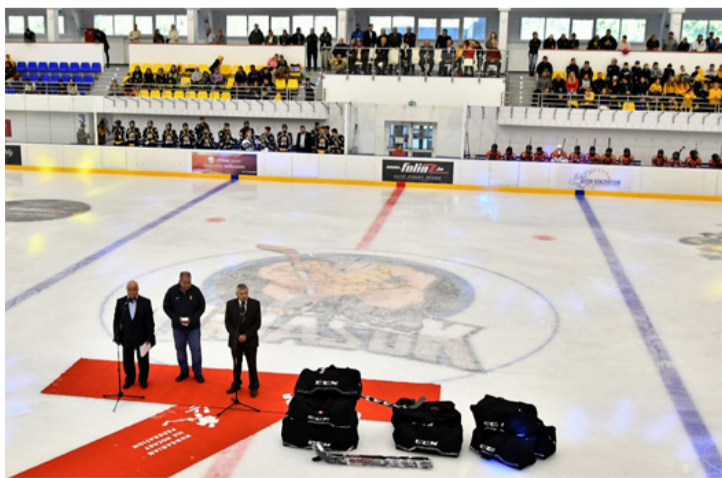
A polgármester az ünnepségen köszönetet mondott a beruházást TAO felajánlással támogató Bourns Kft., a Poppe és Potthoff Hungária Kft., a Le Belier Magyarország Formaöntöde Zrt., a Veolia Zrt., valamint a Raiffeisen Bank képviselőinek