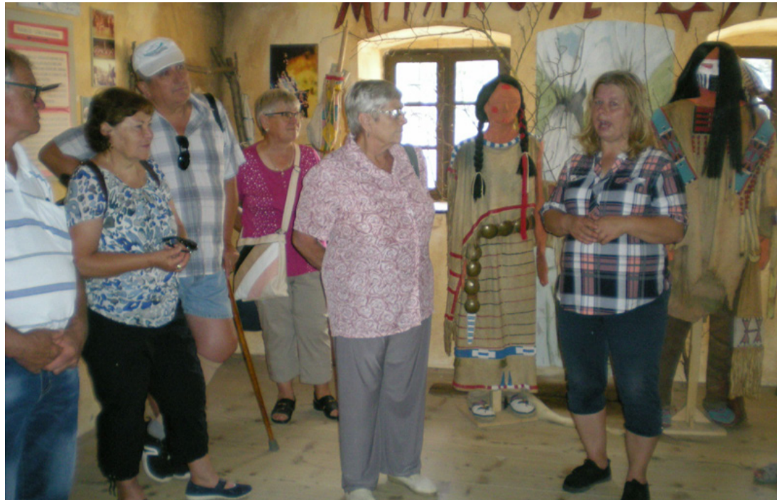
Az Aknamélyítő Kör tagjai a bakonyi indiánok történetével ismerkednek