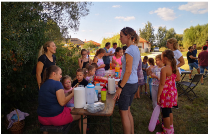
Közreműködő felnőttek az arcfestésre, csillámtetkőre váró gyerek körében