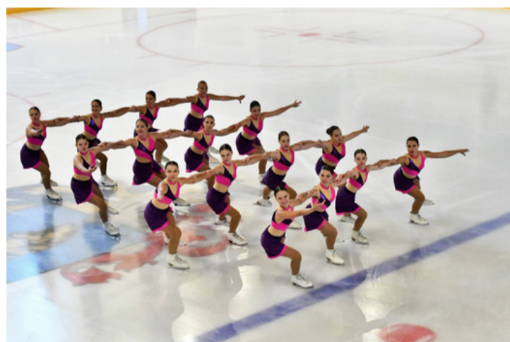
Jégtáncos hölgyek emelték a hangulatot

A mostani az első szezon, amikor a jégcsarnokban kezdhették meg a nyári felkészülést, a jeges edzéseket a sportolók. Korábban a