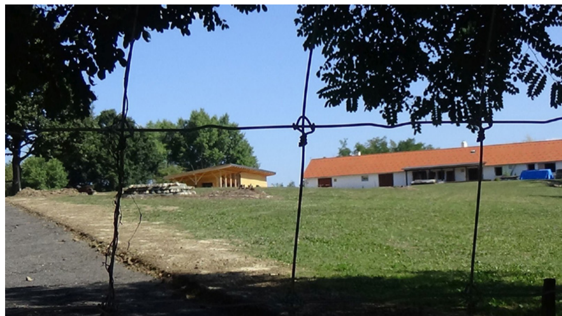
Még nem látogatható, de már javában épül

még néhány hektár területet, hogy többet tudjon megmutatni mindabból a természeti