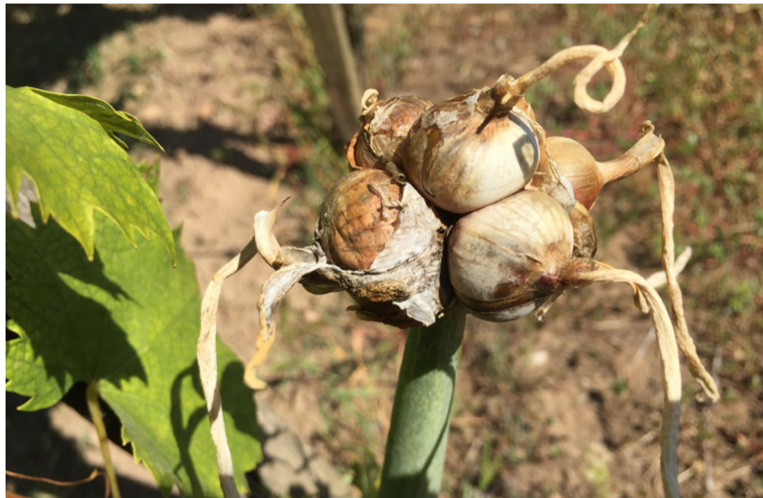
Ez már nem is „Jancsi”, hanem János...