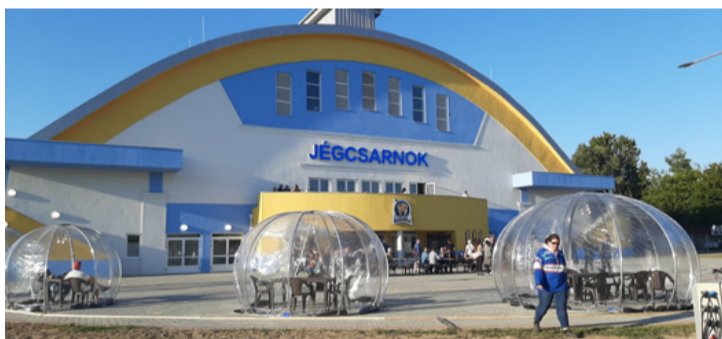
A bejáratnál kellemes beszélgető „igluk” várták a vendégeket a melengető ősz eleji napsütésben

■ Az Ajkához hasonló nagyságú városok közül csak nekünk van jégcsarnokunk. A létesítmény 1,9 milliárd forintból készült el, amelyből 1 milliárd 197 millió forint a vállalatok által felajánlott TAO támogatás volt, a többit önerőből tette hozzá a város. Az alapkőletétel 2017-ben volt, a próbaüzem tavaly november végén kezdődött, szeptember 10-én pedig ünnepélyesen megnyitotta kapuit az érdeklődők előtt is az intézmény, amelyet addig csak a 2015-ben alakult Óriások Jégkorong SE csapatai használhattak. A jég közepén az Óriások logója, valamint Ajka város címere látható. A csarnok befogadó képessége 1200 fő, az öltözők száma 9.