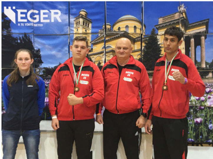
Ajkai pofonosztók az Egri bazilika posztere előtt