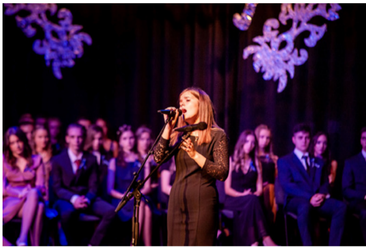
Eljött ez a pillanat is