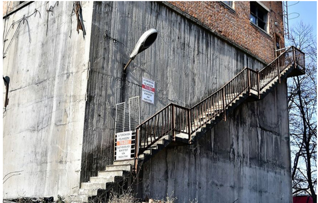
A ma már balesetveszélyes egykori szénosztályozó Ármin bányán