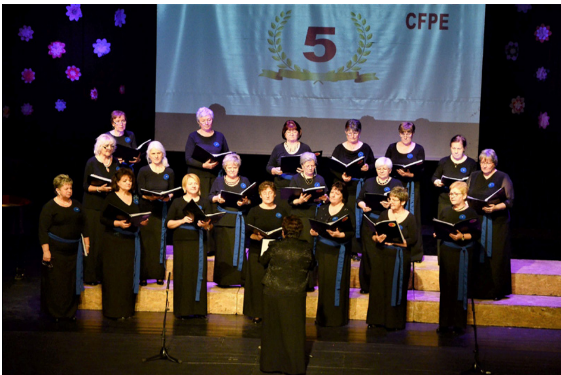
A Jubilate Női Kar a színpadon