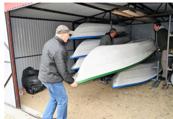
Csónakokat is beszereztek a támogatásból