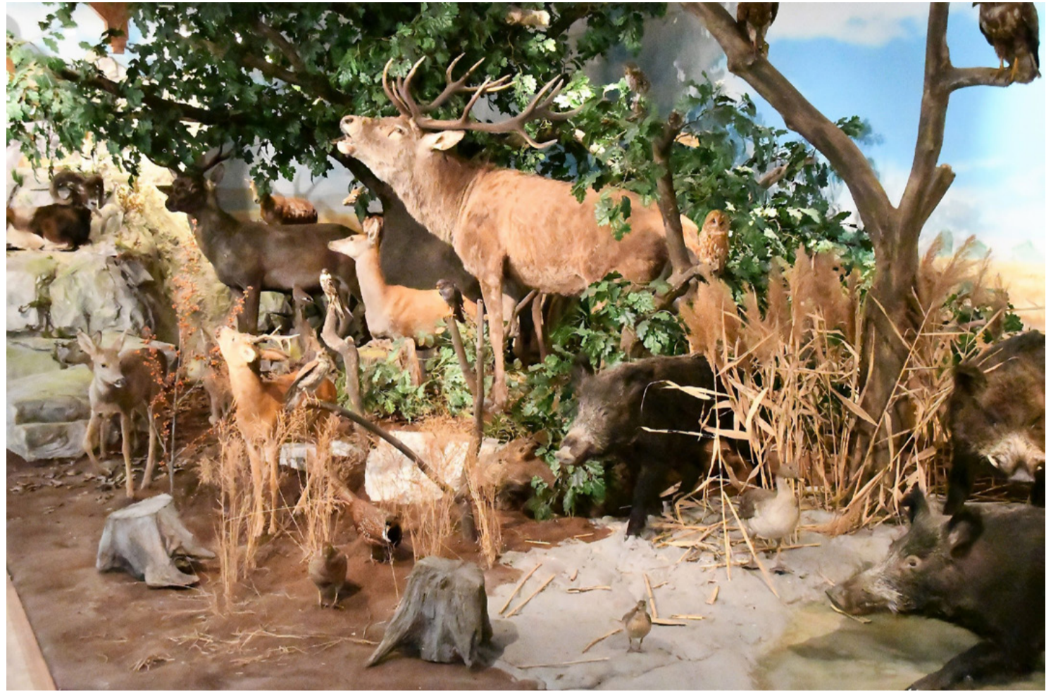
A legjobb családi belépőt nyerhetnek a lenyűgöző dioráma megtekintésére