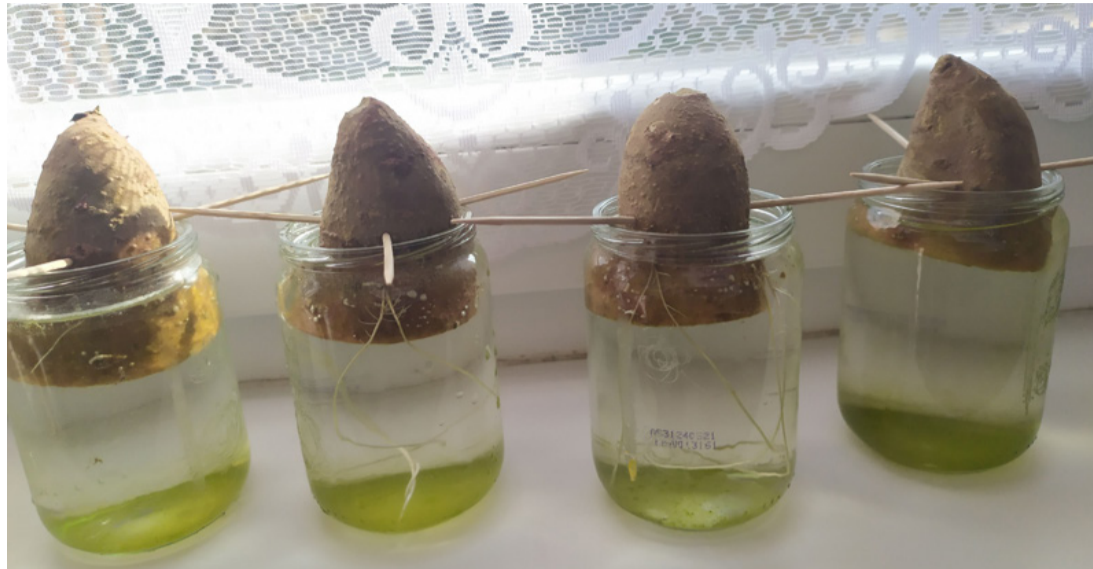
Meleg helyen tartsuk őket. Meghálálják