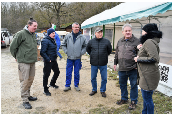
Az egyesület „kemény magja.” Jobbra szerző

■ Sikerrel pályázott a Településfejlesztési Operatív Programban kiírt projekte család- és turistabarátrá programjával a Széki-tavi Horgász Egyesület. A tavasszal befejeződő kivitelezés számos olyan elemet tartalmaz, mely fellendítheti az amúgy is jelentős horgászturizmust és kiváló célpontja lehet a családi kirándulásoknak.