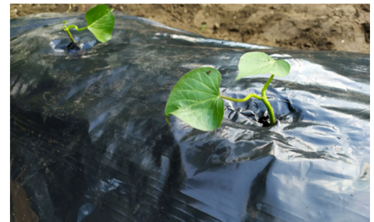
Édeskrumpli palánta. Övjük a fagytól