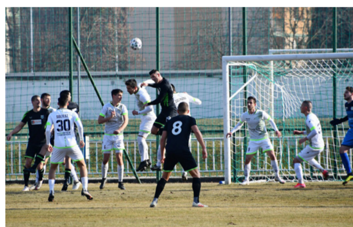
Az Ajka minden támadást visszavert