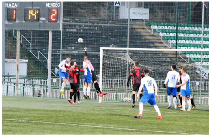
Itt még a vendégek vezettek, de már nem sokáig