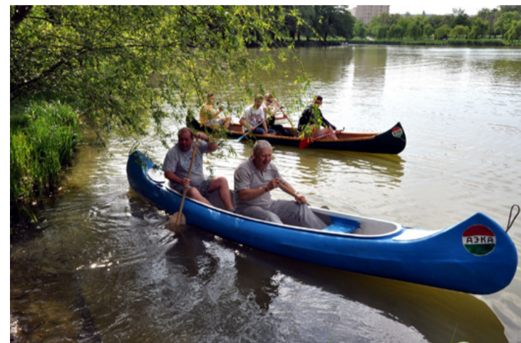
A Városligeti tó sok izgalmas verseny helyszínül szolgál