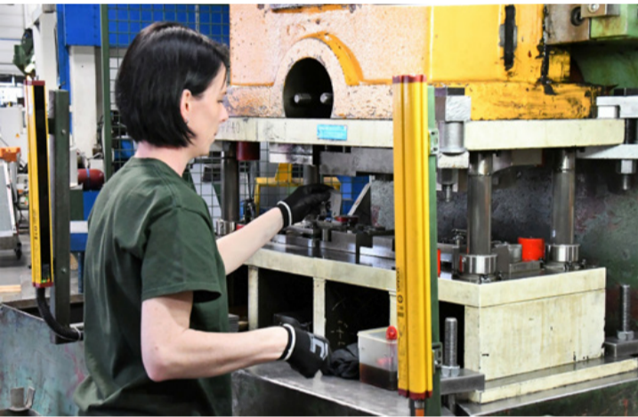
Elsősorban fémalkatrészek sajtolásával és összeszerelésével foglalkoznak