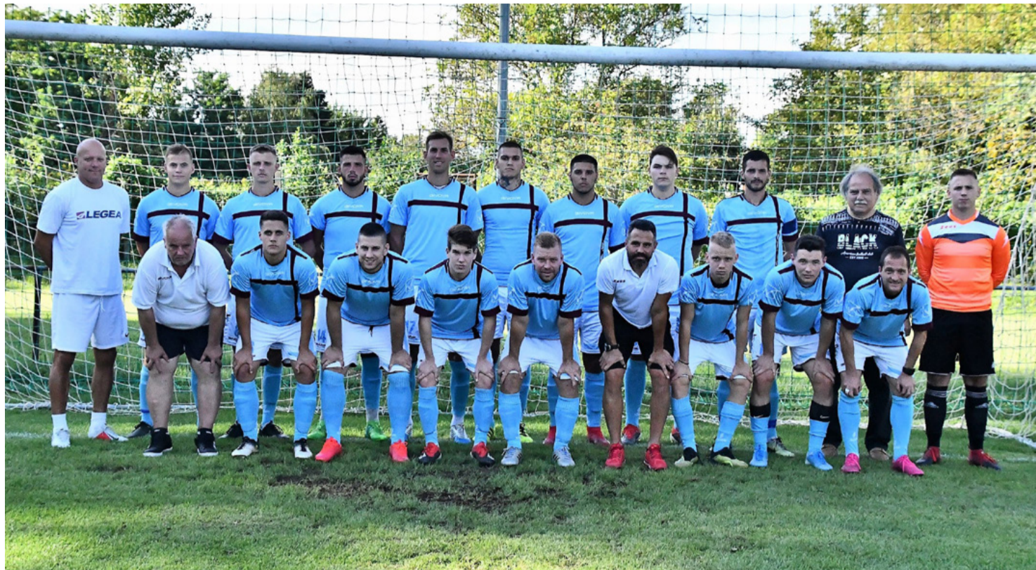
Cs.B.É. ■ A tósokberendi „Aranycsapat”

Ezzel a jól sikerült vendégszerepléssel 15 mérkőzésből 12 győzelemmel 37 pontot gyűjtve továbbra is a Kristály áll a tabella élén. A következő fordulóban március 6-án 15 órakor az ötödik helyen álló Balatonalmádi SE csapatát fogadják az ajkaiak, ha nem romlik a gyep állapota, akkor már a tósokberendi pályán.