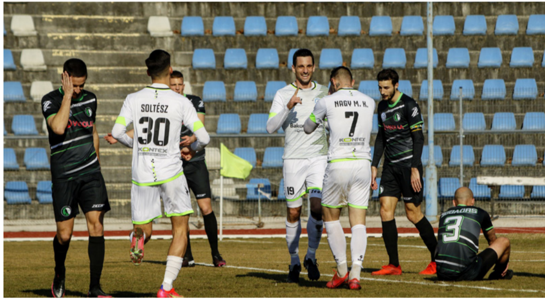
Az arcok sok mindent elárulnak