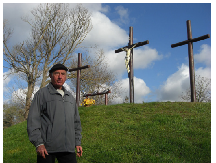
Az egyesület tagjai azt tervezik, hogy a keresztút mögötti területen pihenő parkot alakítsanak ki. A tereprendezés mellett ültetnek majd díszfákat is