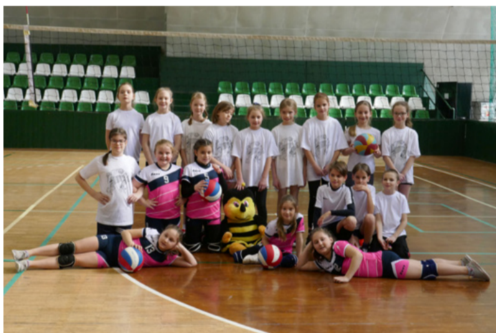
Az ajkai szupermini játékosok