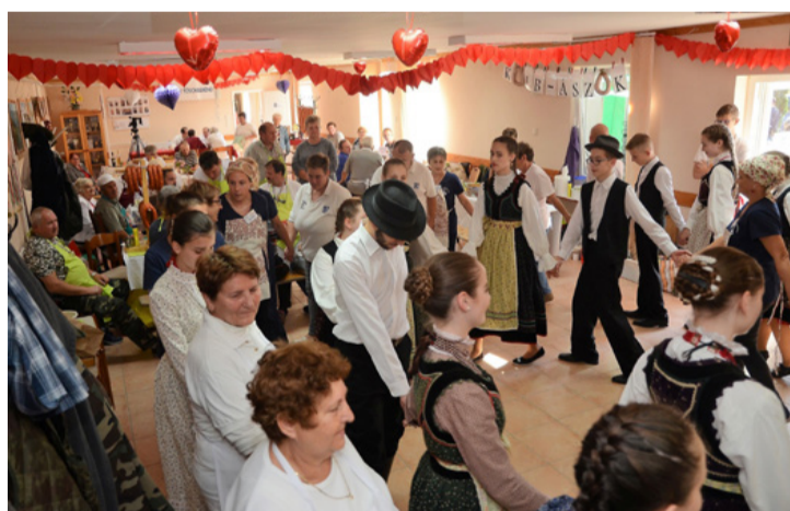
Két éve nagy sikere volt a táncbáznak