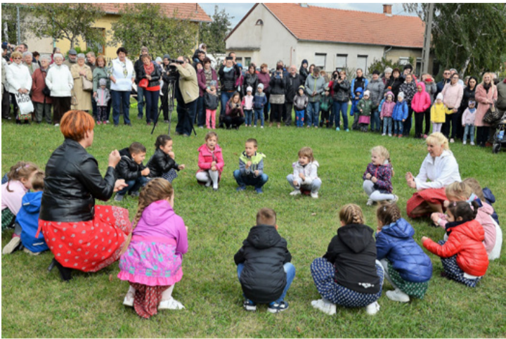
Zöldikék – amikor még ünnepelhettük a diót

A dióünnepen és a bányásztelepi karácsonyi programon is bemutatkoznak a Zöldikék óvodások. A gyermekek más városi programokon is részt vesznek. Fontosnak tartják a generációk közötti kapcsolat-