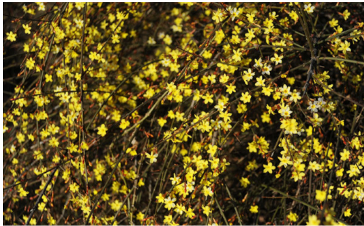
Téli jászmin zuhatag