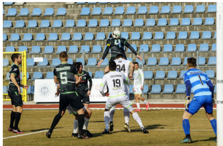
Izgalmas helyzet a Budaörs kapuja előtt