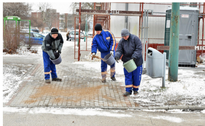
Az idej 200 tonna síkosságmentesítőt szórtak szét

Az idej télen több, mint 200 tonna, fűrészpórral összekevert sót juttattak ki a síkosságmentesítésre. Ez a mennyiség meghaladta a tavalyit,