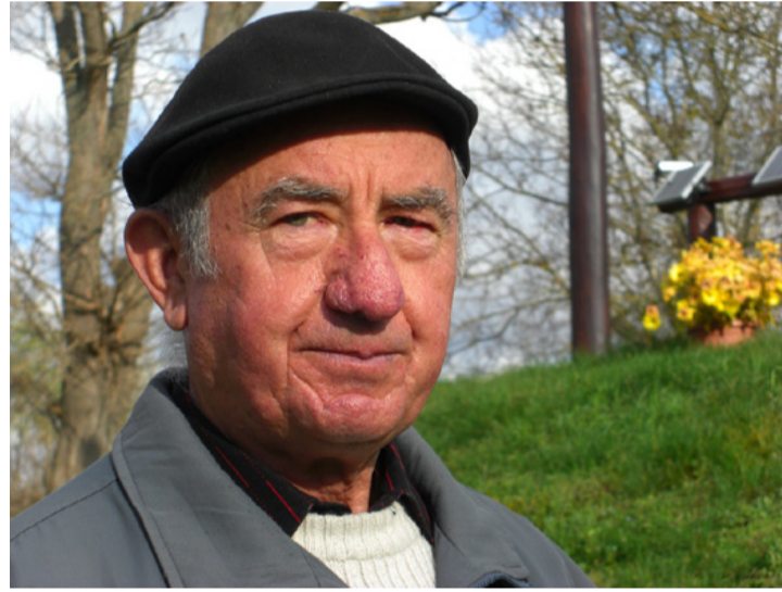
A többkötetes szerzőből nyugdíjba vonulása után lett irodalmár

A művelődési ház egyik kis termében ülünk le beszélgetni, ahol felesége süteményével és kávéval kínál. A vendégszerető házigazda a Veszprémi Vegyipari Egyetem elvégzése után (1972) az Ajkai Timföldgyár és Alumíniumkohóban helyezkedett el, ahol vegyészmérnökként különböző beosztásokban több területen megfordult. A 2005-ös nyugdíjba vonulását követően két év múlva benevezett egy honismereti pályázatra: a falu második világháborús eseményét írta meg, majd későbbi könyvében a két világháborúban résztvevő katonáknak állított emléket.