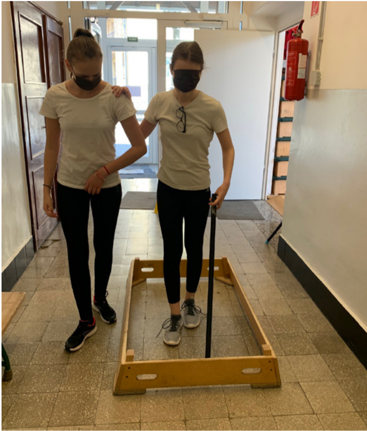
A látássérültek mindennapjait is megtapasztalhatták a foglalkozásokon