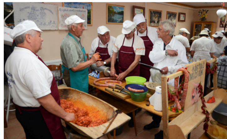
Az idősebb korosztály minden évben részt vesz a kolbásztöltésen