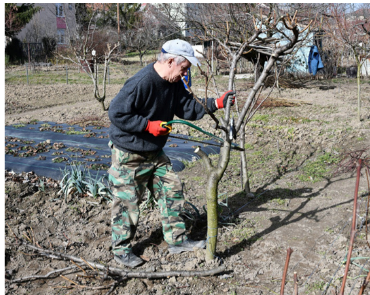
Február végén a jó időben már kezdődhetnek a munkák a kertben

■ Januárban tájékoztattuk olvasóinkat, hogy Tóskoberénd határában a szürke iszap rekultivációs munkáit végző Biomass Kft. munkatársai ellenszolgáltatás nélkül átveszik a kertekben keletkezett zöld hulladékokat. Utána jártunk az azóta szerzett tapasztalatainknak.