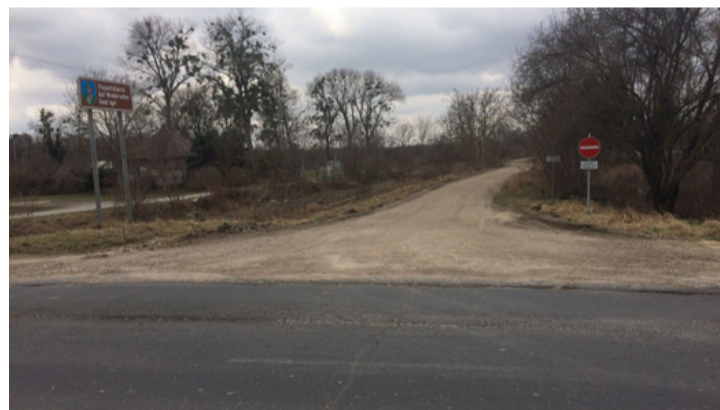
A behajtani tilos táblánál kell behajtani a Biomass felé