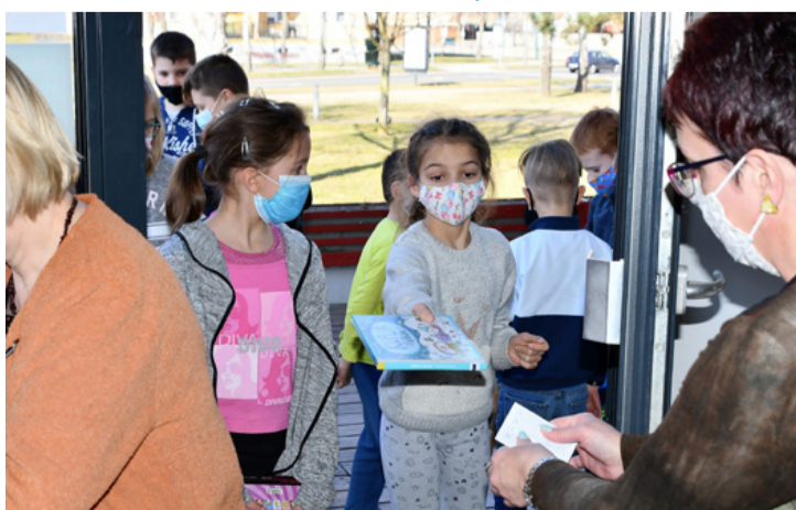
Érkeznek vissza a kiolvasott könyvek