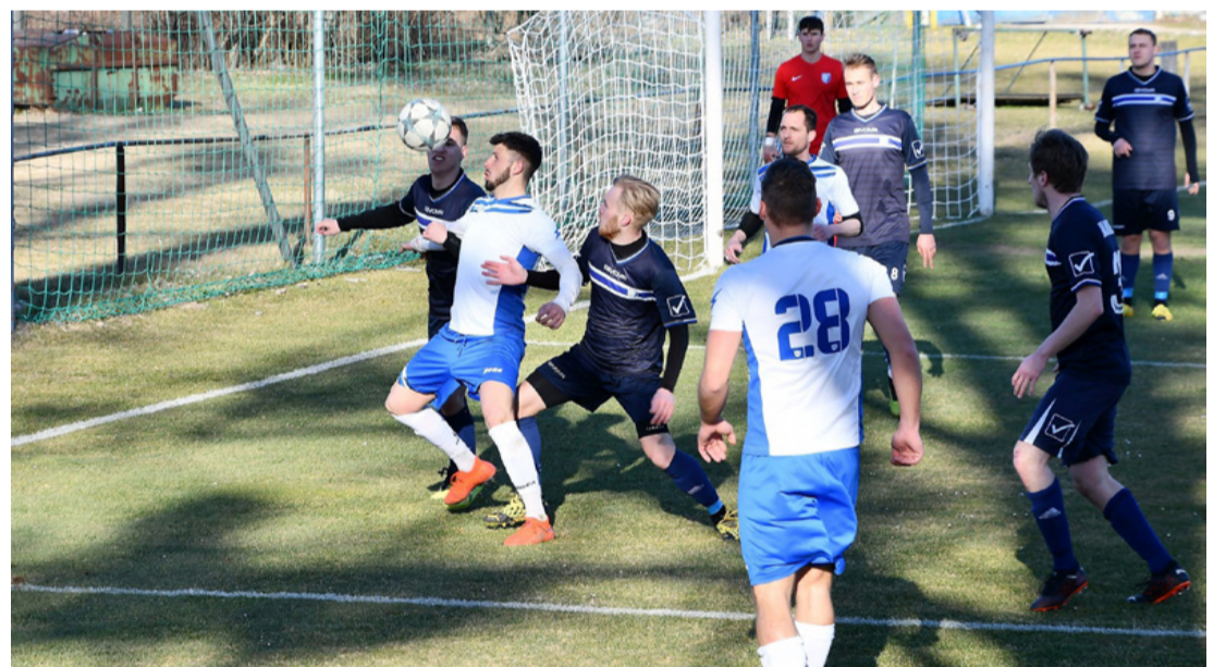
Nehéz volt utat találni a Balaton-partiak között