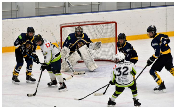
Egy izgalmas jelenet a Szeged csapata elleni mérkőzésen

Országosan is jegyzett versenyzőket nevelt már alakulása óta az Ajkai Óriások jégkorong egyesület. A jelenlegi legidősebb korosztály, az U16 versenyzői, akikkel 2015-ben megalakult a klub. Közülük 6-7 hokis azóta is az Óriásoknál edzenek. A csapat jelenleg 16 fős, mindannyian fiúk. Az alapító ajkaiak mellé néhány éve Veszprémből igazoltak játékosokat, illetve Érdről van két kölcsönjátékos, akik a városukban edzenek és csak a mérkőzésekre kapcsolódnak be az ajkaiakhoz.