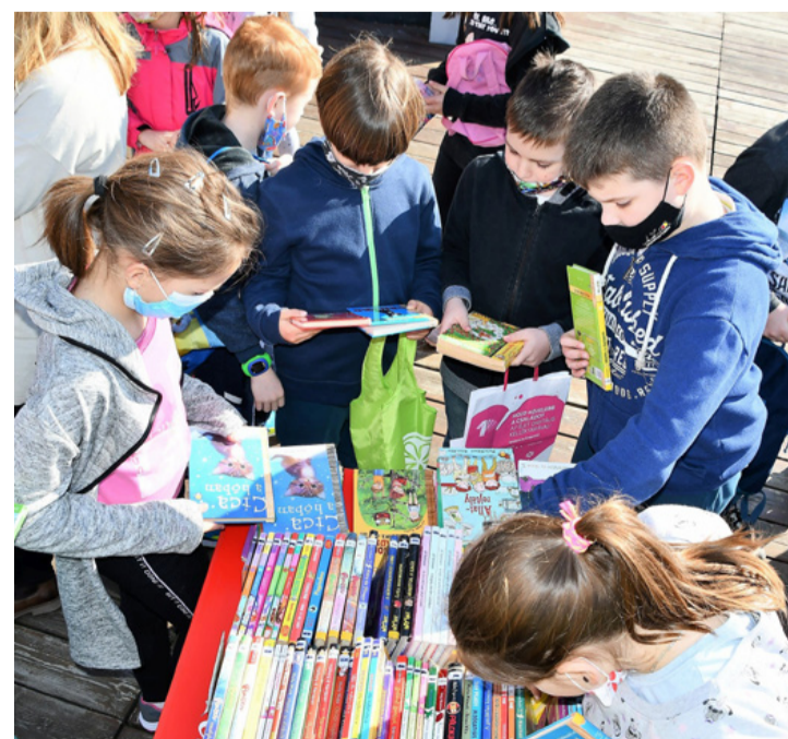
A válogatás önfelelt percei