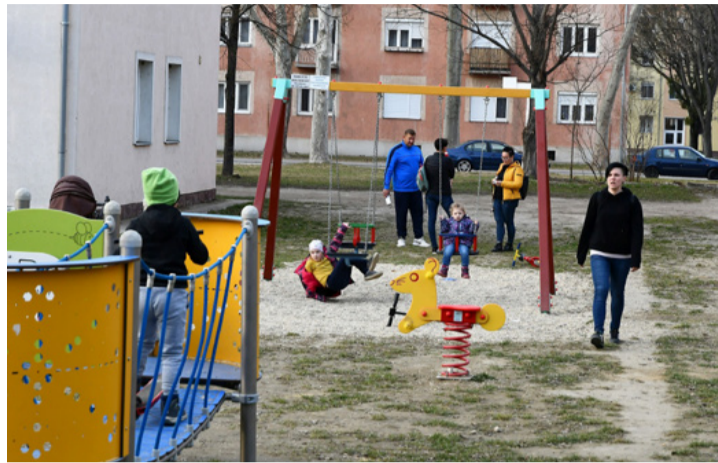
Délutánonként nehéz gazdátlan játékszer találni

■ A tavaszi időjárás beköszöntö öta délutánonként és hétvégén gyermekzsivajtól hangos az óvárosi Móricz Zsigmond közösségi tér. Mindenki várta már, hogy ki lehessen ülni a park padjaira, sportolni a fitness eszközökön vagy beültetni a gyereket a hintába. A bátrabbak nem is vártak tavaszig, már a tél enyhébb napjain kimentek hintázni, csúszdázni vagy a KRESZ-pályán rollerezni, görkorcsolyázni, kerékpározni.