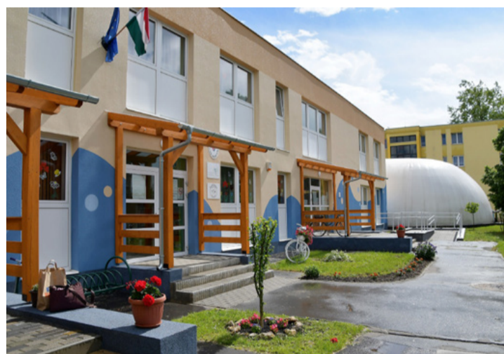
A Vízikék óvoda felújított épülete

A Vízikék Óvoda azon kevesek közé tartozik az országban, amelyiknek saját uszodája van. Az intézmény 1975 óta működik, a város északi részén, lakótelepi környezetben.