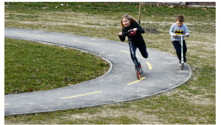
Nagy sikere van a KRESZ-pályának

A gyermekek a hintát és a csúszdát használják leggyakrabban. A parkban további fejlesztés várható, füvesítés, napellenzők, kamera felszerelése, újabb hinta felállítása még hátra van. (ta) ■