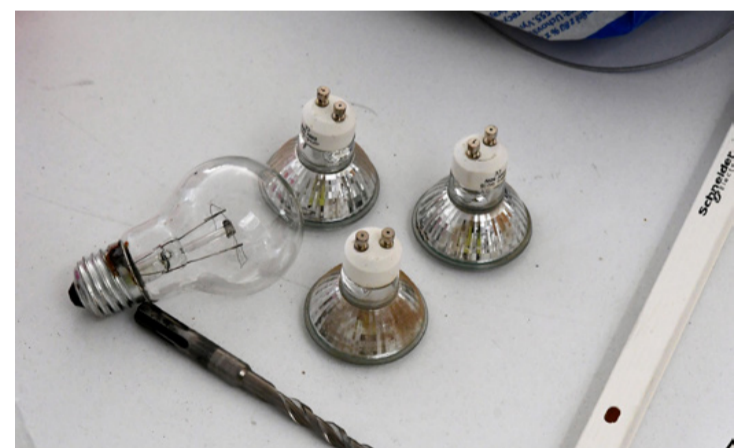
A hagyományos Wolfram-szálas izzó és a halogén már múlté