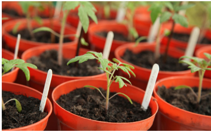
Paradicsom palánták kiültetésre várva