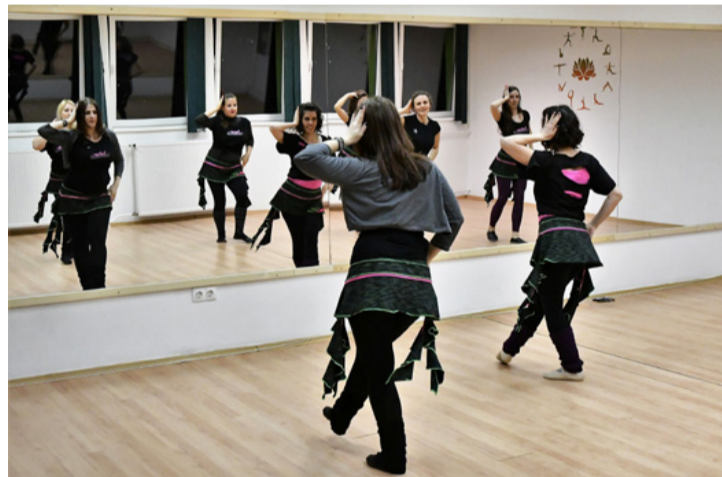
A lányok a beledi táncot gyakorolják

A 2008-ban öt fővel alakult táncsoportnak ma már ötvennél is több tagja van. A kicsi gyerekektől kezdve a versenytáncosokig mindenféle korosztály képviselteti magát, és tanulja ezt az igen összetett és nehéz mozgásformát. A hastánc vagy más néven orientális tánc a keleti eredetű táncok összefoglaló elnevezése. Céljai szerte ágazók lehetnek. Egyesek bemutatáson, előadásokon búvik el vele a közönséget, mások csak maguknak táncolnak,