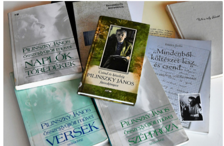
A városi könyvtárnak egész gyűjteménye van Pilinszkyból