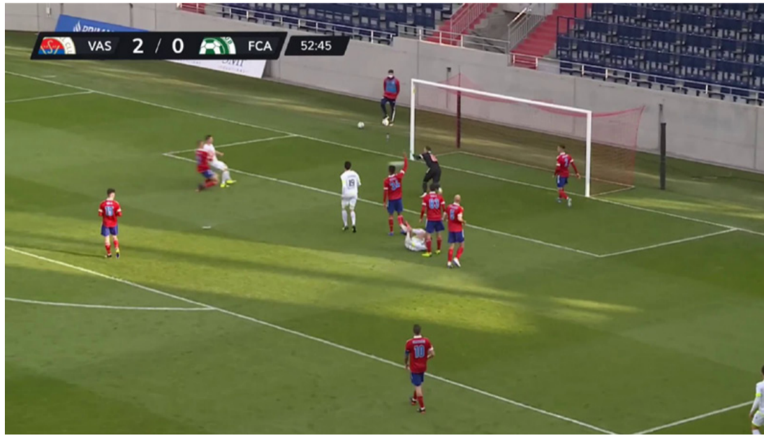
A TV közvetítés egy kockája: Rétyi gólja