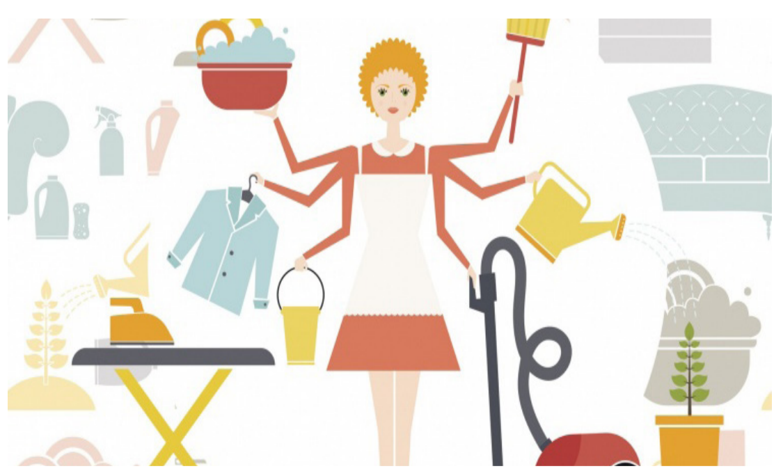
Pszichológusok állítják, hogy a házi munka 3 évvel is meghosszabbíthatja az életet

Megkérdeztünk különböző élethelyzetben lévő családokat. Az egyedül élő hetvenes években. Sokáig nem is gondolt arra senki, hogy beárassa az otthon végzett munkákat. Természetes volt, hogy mindezt el kell végezni. Néhány éve aztán világnapot kapott a tevékenység, így született meg a Láthatatlan munka világnapja április első keddjén. Már por-