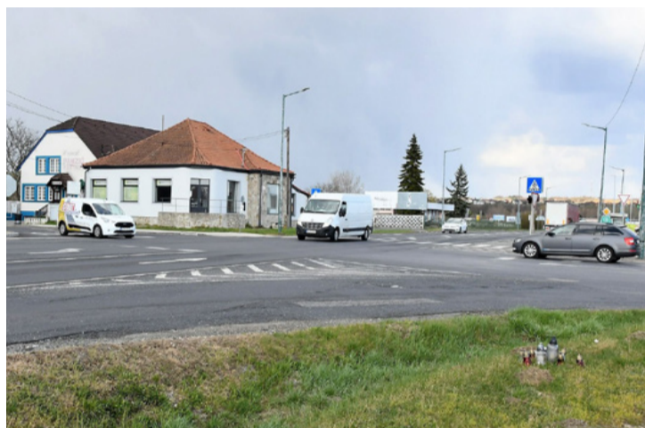
Júniusban kezdődik a csomópont átalakítása