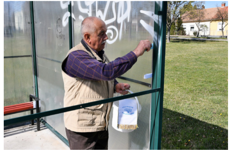
A buszra is kellemesebb volt várni, ha rábukkantunk egy versre