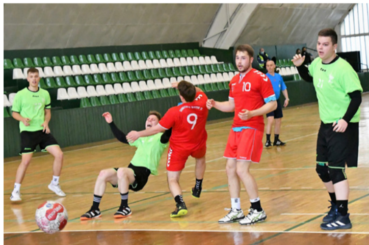
A kézilabda játékosok egyben gladiátorok is (KK Ajka-Pécsi VSE)