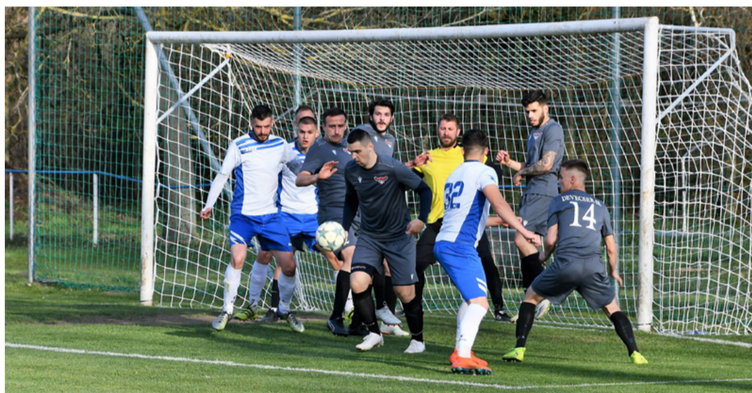
Kapu előtti tömörülés