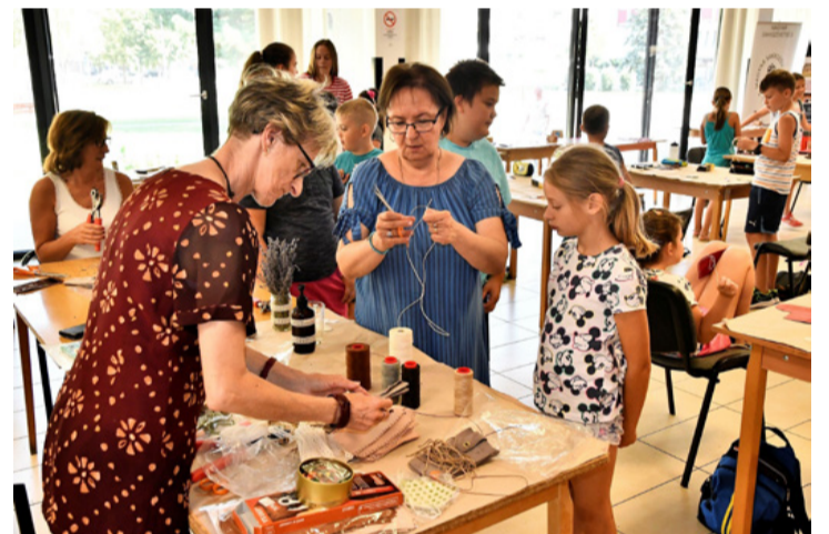
Tavaly is nagy sikere volt a „bőrös tábornak”