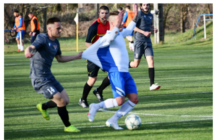
Az ajkaiakat erőszakkal sem lehet visszatartani