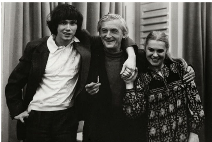
Azon kevés képek egyike, amin Pilinszky mosolyog. Mellette Kocsis Zoltán és Csengery Adrienne

■ A szeszélyes április kiszámíthatatlan és ingadozó, nehezen követhető a változások, ezzel elsősorban a fellázadt és tomboló természetre utalok. A hangulatunkra és a körülményeinkre nem kevésbé igazak ugyanezek a jelzők, ezért különösen fontos, hogy ki-ki megtalálja a saját kapaszkodóját. A szellemi értékekhez való hozzájutás már egy éve korlátozott, de attól még nem felejtettük el, hogy az emberiség tudását és bölcsességét a könyvek őrzik. Az irodalom és a költészet abban is segít, hogy megtaláljuk lelki és érzelmi egyensúlyunkat. A magyar költészet napját minden évben, április 11-én ünnepeljük.