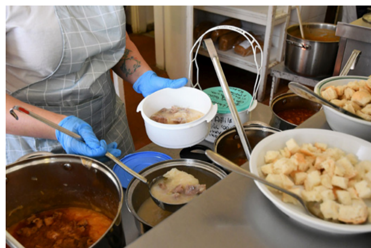
Ételosztás a Bakonygaszt konyháján (Krisztus állítólag „szorozni” is tudott

A régi rendnek megfelelően, a normál- és a diétás-igények kielégítése sem jelent gondot a konyhán szorgoskodóknak. Az óvodásoknak a megszokotthoz képest mindössze 10 százaléka kéri