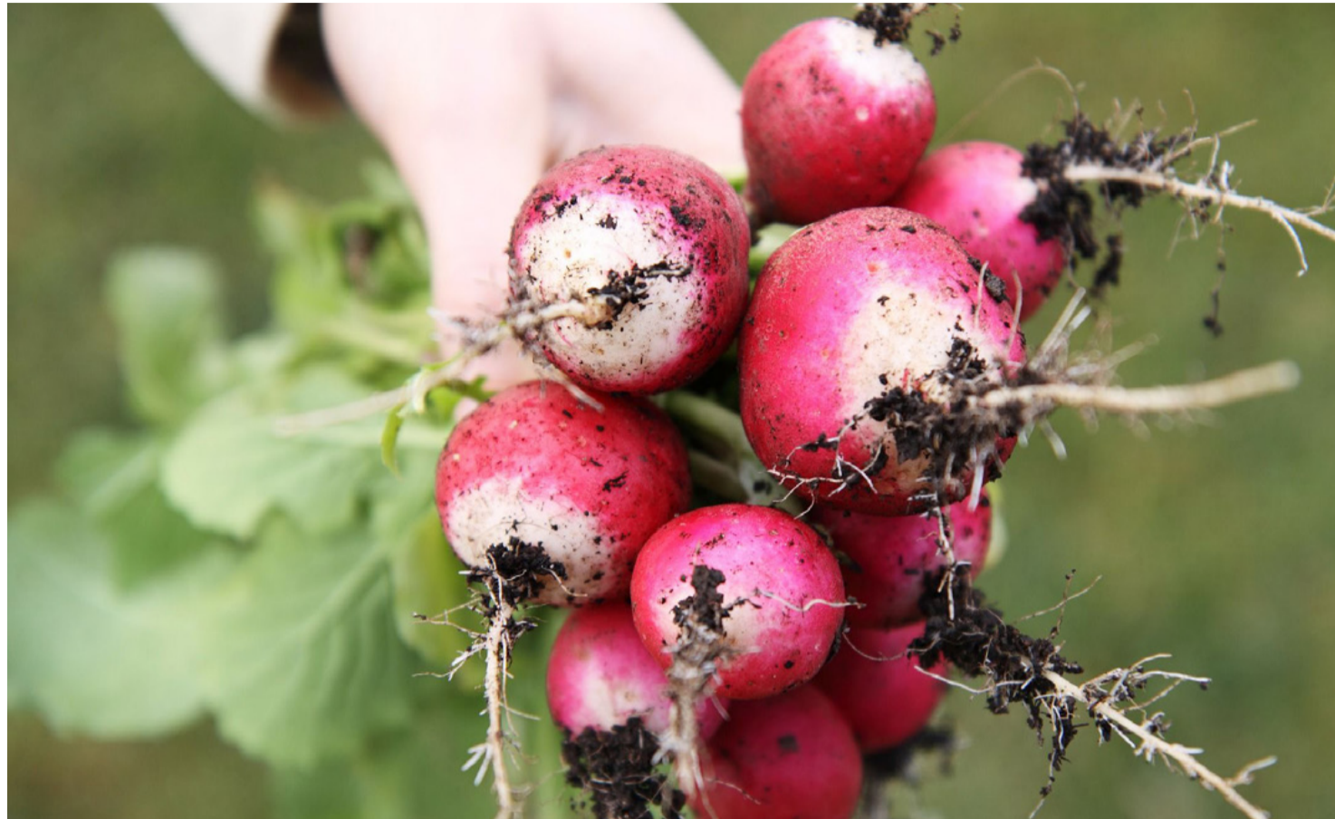
Az első szabadföldi primőr, amivel meglephetjük magunkat, a retek