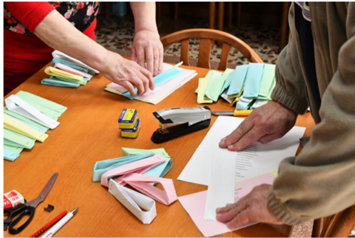
Szorgos kezek válogatták és csomagolták a verseket