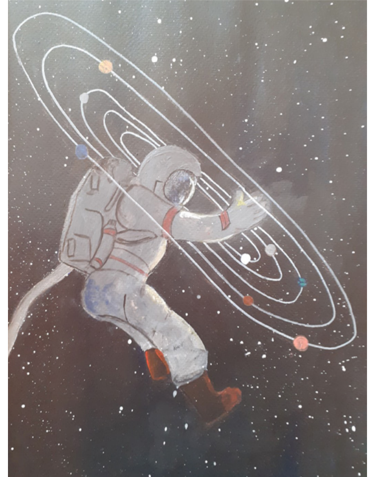
Pelikán Zsóka 7. osztályos (Magyarpolány) látomása az űr meghódításáról