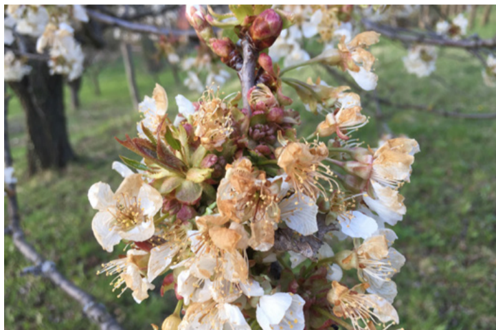
A virágszirmok megbarnulása egyértelműen fagykárt jelez

Rengeteg gazda esett kétségbe, amikor reggel megpillantották a fagyos, kerteket. Nem csak a gyümölcsfák virágai heverték a földön, de az oly nagy gonddal