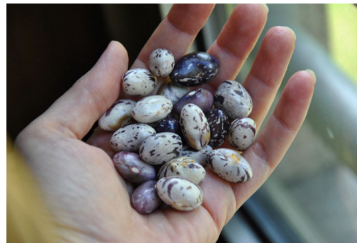
Cowboy-filmekben sok humoros jelenet forrása

A zöldbab ültetésénél figyeljünk arra, hogy kizárólag szabadföldi, állandó helyre való vetéssel szaporítható, nem lehet előnevelt palántáról. Csírázási szakaszban melege van szüksége, a hideget nem szeretni. Érdemes úgy vetni, hogy 30-40 cm-es sortávolságot és ugyanennyi tőtávolságot hagyjunk. Így egészen széles kis bokorra tud fejlődni, mert a tövek nem korlátozzák egymást. A zöldbab ültetése után 2-3 hetet kell várni arra, hogy egy kis zöld kezdemény kidugja a fejét, majd 5-7 hét múlva fog teremni. Nagyon fontos, hogy a magokat jó tápanyagú, kelően nedvességtartó földbe helyezzük el, amelyet előzőleg felpuhítottunk, rögmentesítettünk. A későbbi