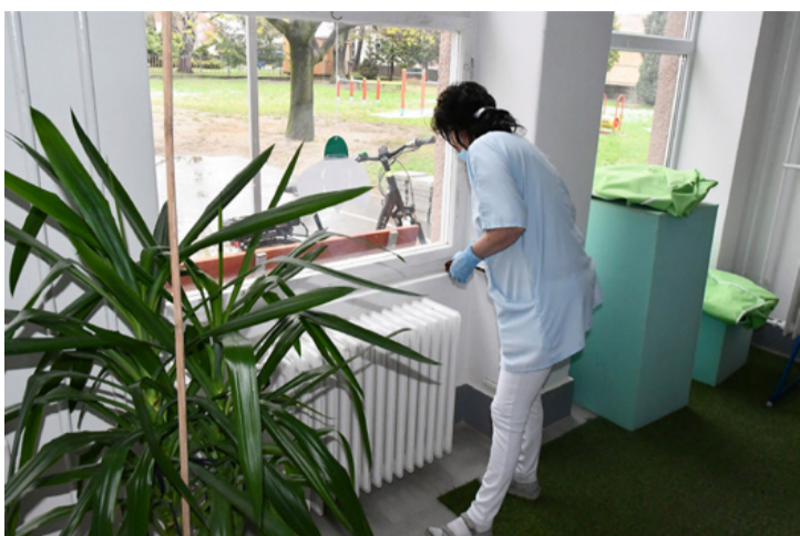
A Csodavárban az újrainyitás előtt is szinte folyamatosan tartották