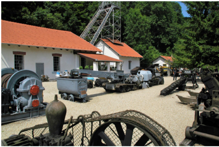
A városzépítők céljai közé a múlt értékeinek megőrzése is bele tartozik. A Bányászati Múzeum bányagép-szkanzenjébe még tavaly is került új gép

■ Januárban tartotta tisztújító közgyűlését az ajkai Városszépítő Egyesület. Az új tisztségviselők megválasztása mellett a terveket, az új célokat is megfogalmazták, hiszen a 2020-as év nem kedvelt sem az eddigi városépítő tevékenység folytatásának, sem az új, hosszú távú célkitűzések meghatározásának. Holott az 1985-ben alakult civil szervezet elévülhetetlen érdemeket szerzett magának a város szépítésében, új városfejlesztési irányvonalak kitűzésében, melyeknek érdekében folyamatosan tevékenykedtek az elmúlt majdnem negyven évben.