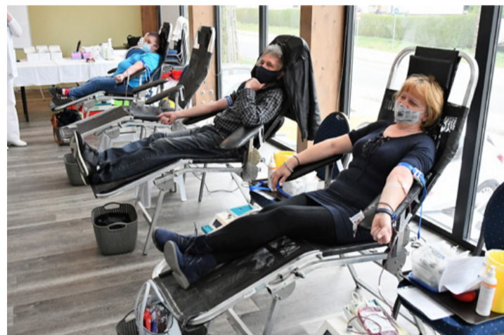
Az április elején tartott ajkai véradás

A veszprémi vérellátó állomáson, a Mártírok utca 5. szám alatt minden hétköznap várják a segíteni szándékozókot. Aki egyéb elfoglaltsága miatt nem tud a lakóhelyén szervezett véradáson megjelenni, Veszprémben bármikor jelentkezhet, előzetes időpontegyeztetés sem szükséges. A vérellátó hétfőn, kedden és csütörtökön 8-15 óráig, szerdán 8 és 18 óra között, pénteken 8-12 óráig tart nyitva. A koronavírus fertőzésen átesettek gyógyulásuk után 3 héttel már adhatnak