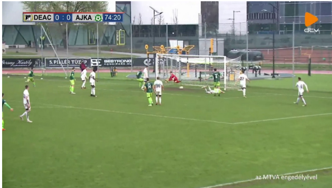
Gyömörei bal belsejével a hosszúra, ahogy kell...