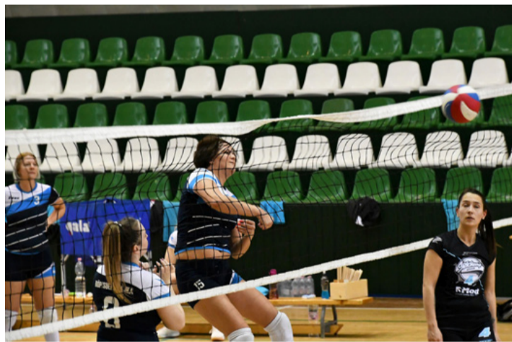
Egy jó leütés – a röplabda sava-borsa