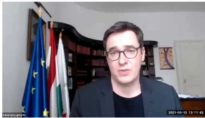
Karácsony Gergely szerint van remény

– Sajnos azt kell, hogy mondjam, nagy csalódás ez a helyreállítási terv, amit a kormány nyilvánosságra hozott – kezdte mondandóját a főpolgármester. – Azt gondolom, hogy ez alapján Magyarország nagyon rossz esélyekkel indul abban a versenyben, amit a jövőért vívunk, és az az összeg, az az 5800 milliárd forint, ami történelmi esélyt jelentene Magyarországnak, hogy felzárkózzon és ne csak a koronavírus által okozott gazdasági és társadalmi problémákat tudja megoldani, hanem egy új gazdasági struktúra mellett kötelezze el az országot, ez az esély most