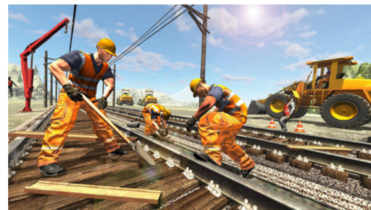
A tervezett Budapest-Belgrád vasútvonal állítólag 2400 év alatt „térül meg”

A felsorolt céloknak összhangban kell állniuk az Európai Unió országspecifikus ajánlásaival. A többi között fontos, hogy a támogatásokkal erősödjön a növekedési potenciál, újra lendületet ve-