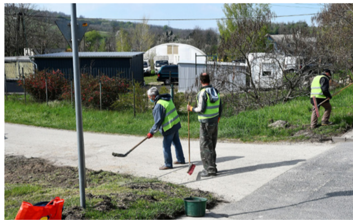
A közmunkások a mellékutakat is megtisztították

számíthatnak a Közútkezelő Kht. munkatársainak a segítségére, illetve a közcélú foglalkoztatás keretében