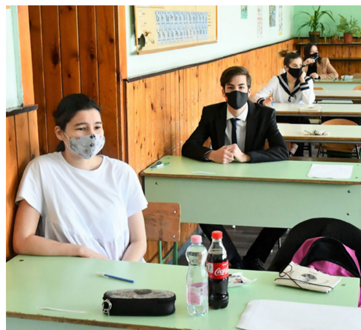
Teljes „fegyverzetben”

(ta) ■