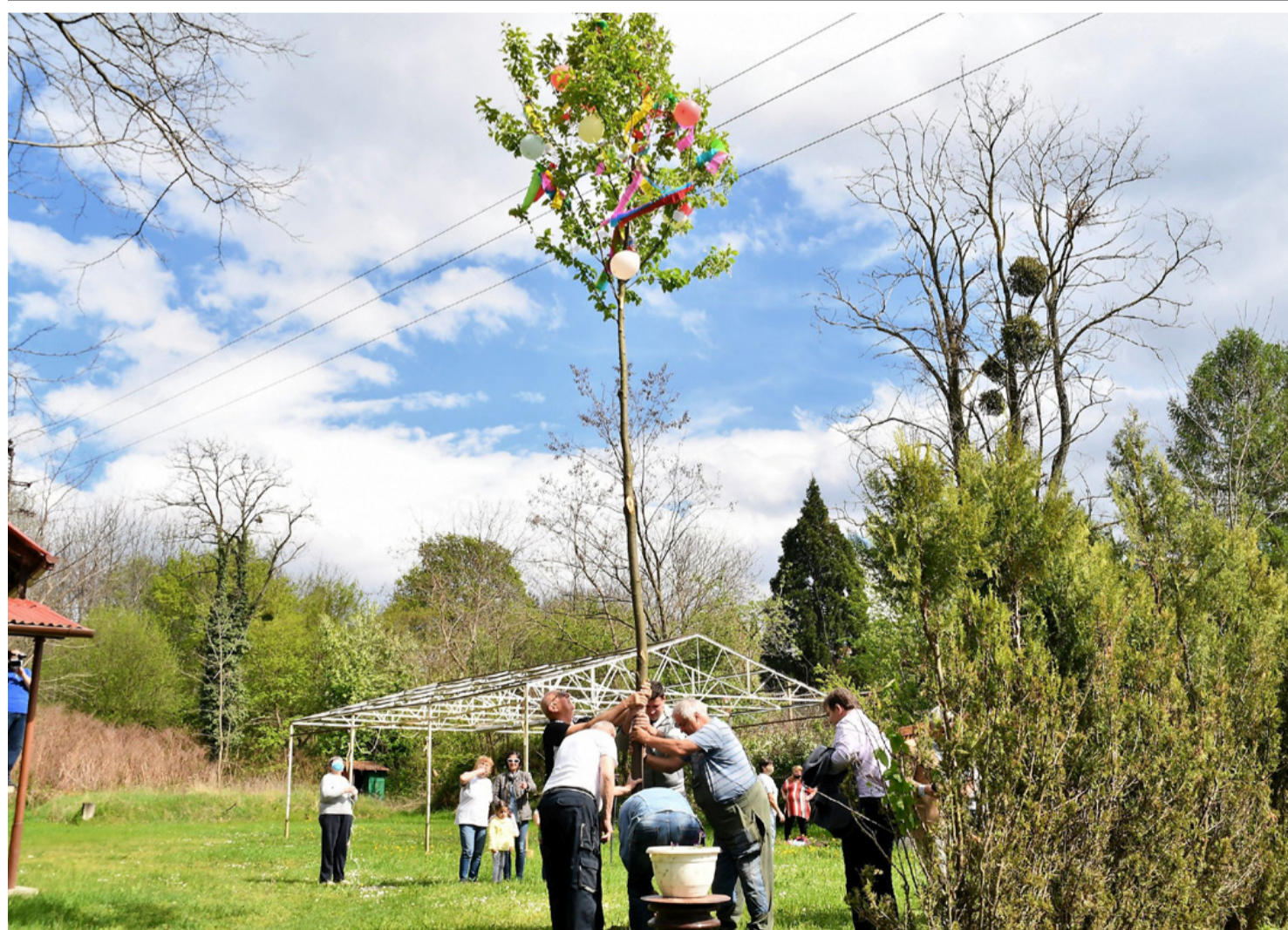
Április 30-án a Civil Fórum Padragkútért Egyesület tagjai az idén először találkoztak a Borbála szobor mögötti rendezvényen, hogy májusfát állítsanak a településrész lakóinak.