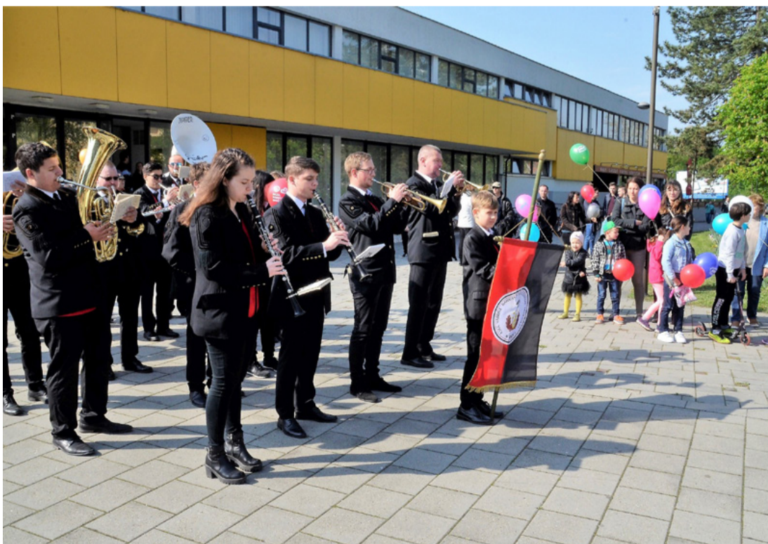
Az Ajkai Bányász Fúvószeneke – évtizedek óta nincs majális nélküle

Május 1-je kapcsán aktuális téma a munkajog jelenleg folyó korszerűsítése, aminek egyik eredménye, hogy az Alkotmánybíróság néhány nappal ezelőtt megsemmisítette az úgynevezett „rabszol-