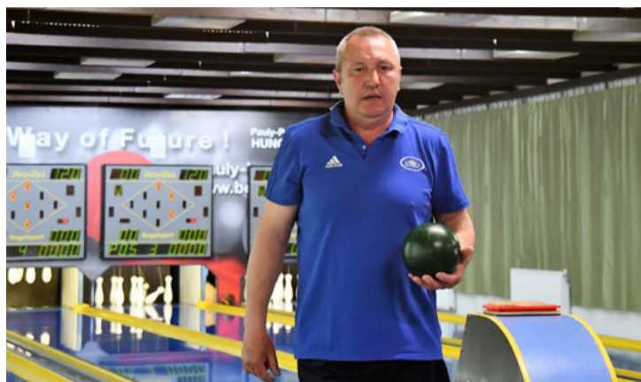
Nagy Lajos nagy formában volt