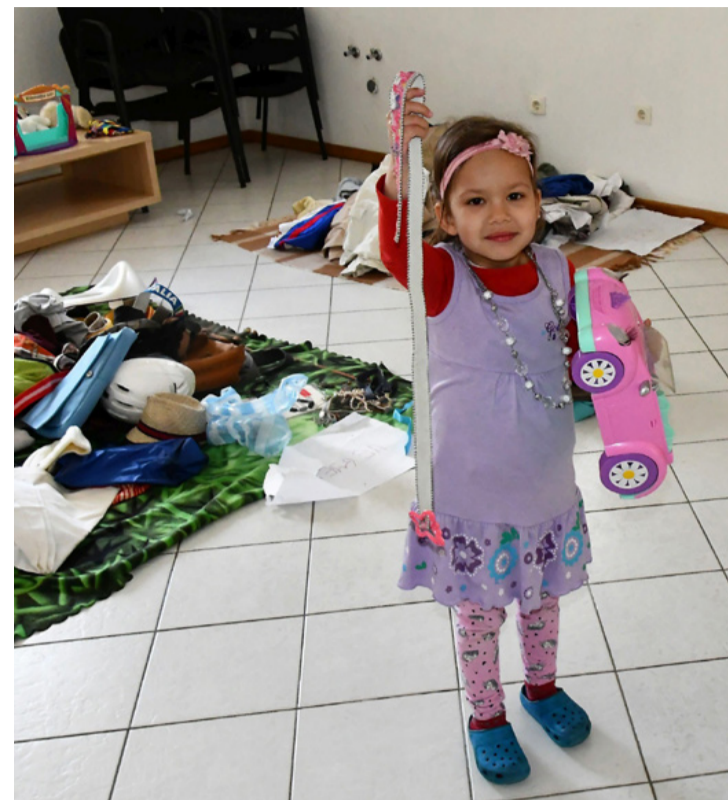
Mi kell még a boldogsághoz?