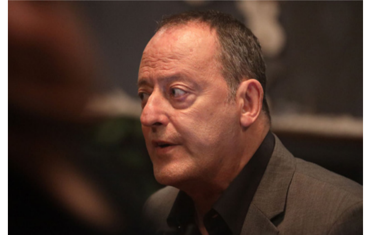
Jean Reno a Több mint portás egyik főszereplője

Valaki a túloldalon 2D - svéd horror, 87 perc (16) - vetítési időpontok: minden nap 20:30.