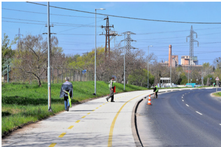
Tisztább lesz a kerékpárutak környéke is

■ Tavaszi nagytakarítás keretében végzik el a játszótérek, utcai hulladékgyűjtők, padok, köztéri szobrok, kandeláberek, hirdetőablak tisztítását, felújítását az ezzel megbízott szakemberek. A munkát minden évben elvégzik, de most a vírusjárvány idején erre fokozottan nagy figyelmet fordítanak