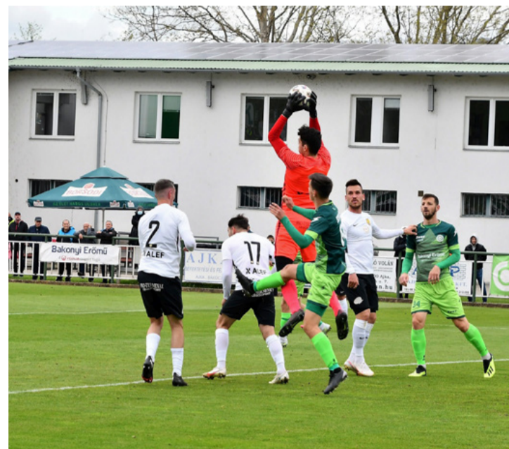
Háromesélyes meccs volt, igazságos döntetlen született