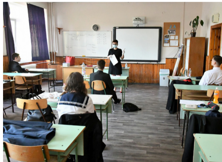
Érettségüket bizonyítják a bánkisok

■ Négy középiskola diákjai kezdték meg érettségi vizsgáikat hétfőn, május 3-án Ajkán. A mostani tanév is rendkívülüként vonul be az oktatás történetébe. A világjárvány következtében ismét elmaradtak a ballagások, és a szalagavató sem a szokványos módon zajlott ott sem, ahol egyáltalán megtartották. Az online oktatás hónapjaiban a tanárok minden igyekezetükkel azon voltak, hogy jól felkészítsék tanítványaikat. Az, hogy mennyire volt mindez gyümölcsöző, a diák szorgalma és hozzáállása döntötte el. Hétfőn magyar nyelv és irodalom tantárgyból adtak számot tudásukról a diákok.