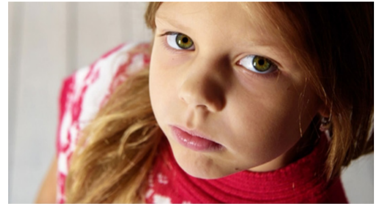
Bogi tíz éves, havonta látogatják a szülei

intézményei, vagy a nevelőszülői hálózat. A gyerekekről való gondoskodás nem csak arról szól, hogy étellel és tiszta ruhával látják el őket. A szakembereknek néhány évük van arra, hogy a sérült fiatalokat átsegítsék az elszorított traumákon, a saját múltjukon. Súlyos indokok szomorú következményeként emelik ki a családból a csemetéket, a szakemberek szerint többségük: elhanyagolás, bántalmazás, szexuális erőszak, a szü-