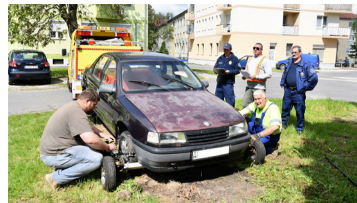
Egy elfelejtett autó, ami mostantól már nem rontja a városképet