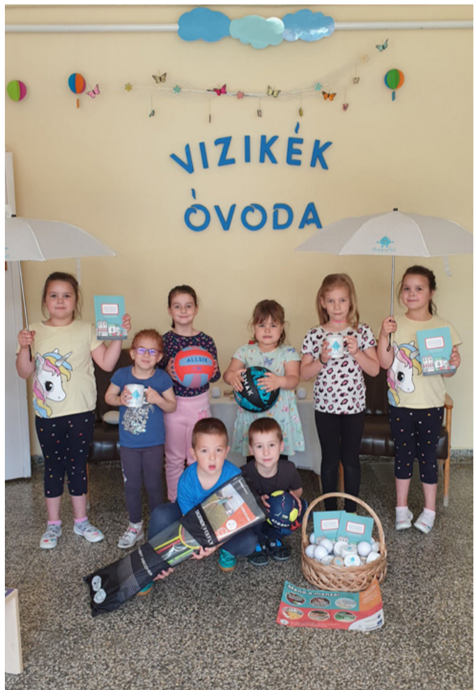
Az ovisok ajándékokkal