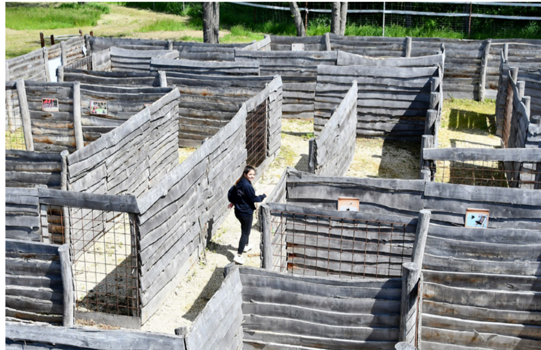
Itt csak Ariadné fonala segíthet

szzerű, amilyennek gondolnák. Mielőtt elkeseredtek volna, az állomásvezető elmondta, hogy a gránát, ha éles, akkor is képes pusztítást végezni, ha nem pontos a találat. A negyedik állomáson azt játszották el, hogy egy küzdősportoló akarta megszerezni az utcán sétáló fiatal pár fiú tagjának a telefonját. A megtámadottak védekeztek, látszott, hogy nem profi karatesokba kötött bele a támadó, de küzdésből kiválóra vizsgáztak. Következő feladatként egyik csapatagnak 60 fekvőtámaszt kellett csinálnia. Negyvenig minden szuperül ment, majd látszott, hősünk minden karhajlítással egyre fáradtabb. Tudta, nem adhatja fel, csapatának ugyanis, ha végigcsinálja, 10 pontot szerez, ami a végső sorrendet is befolyásolhatja. Társai biztatták,