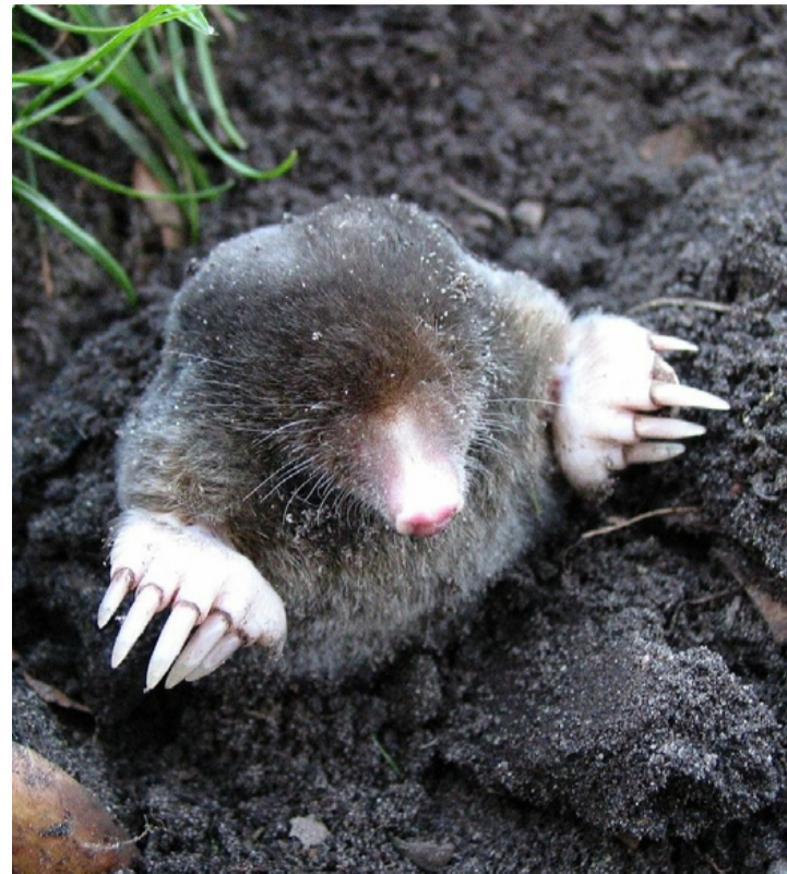
Nem nagyon lát, de jobbra hasznos

Az érzékeny állatok számára minden hangforrás, zaj elviselhetetlen ezért néhány