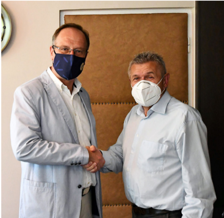
A polgármester kihasználta az alkalmat, hogy közvetlenül informálja Ajka terveiről a kormánybiztost