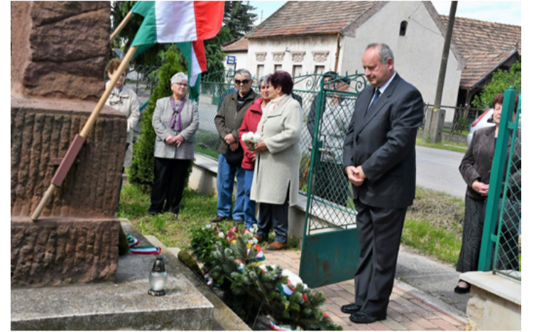
Puskás Károly szerint egy háborúnak nincsenek győztesei, csak vesztesei