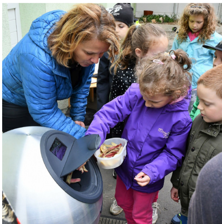
A gyerekek örömmel „ettették” a komposztáló robotot

A nyíláson beteszik a komposztálni valót, majd lecsukják a tetőt, a rendszer megforgatja, és a folyamatot meggyorsító folyadékkal permetezi le. Ha végzett, jöhet az újabb adag, mindaddig, amíg az edény megtelik. A folyamatot számítógép segítségével végig lehet kö-