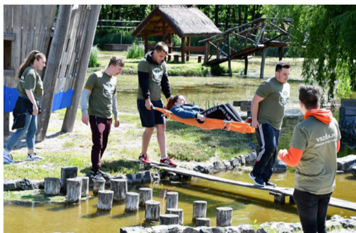
Sérült kimentése egy hajóról