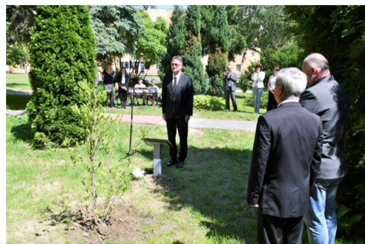
Tisztelgés a múlt előtt, üzenet a jövőnek