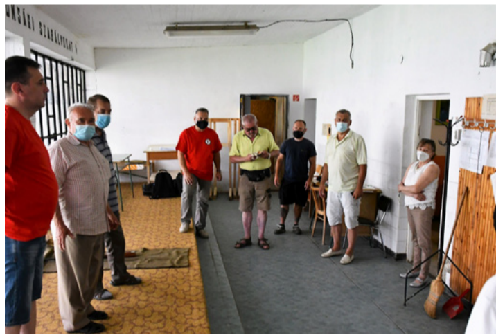
Eligazítás lövészet előtt