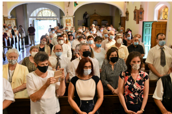
Zsűfólásig megtelt a templom az aranymisére

a hála, abból irigység, sértettség és örömtelenség lesz