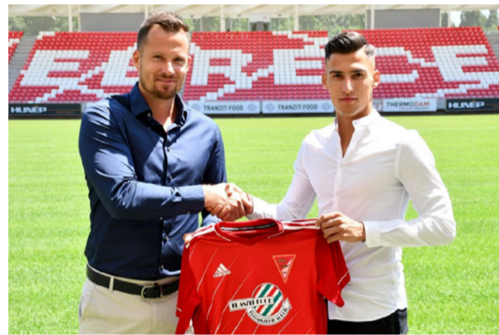
Soltészt is levadászta a civis város ismét NB I-es csapata