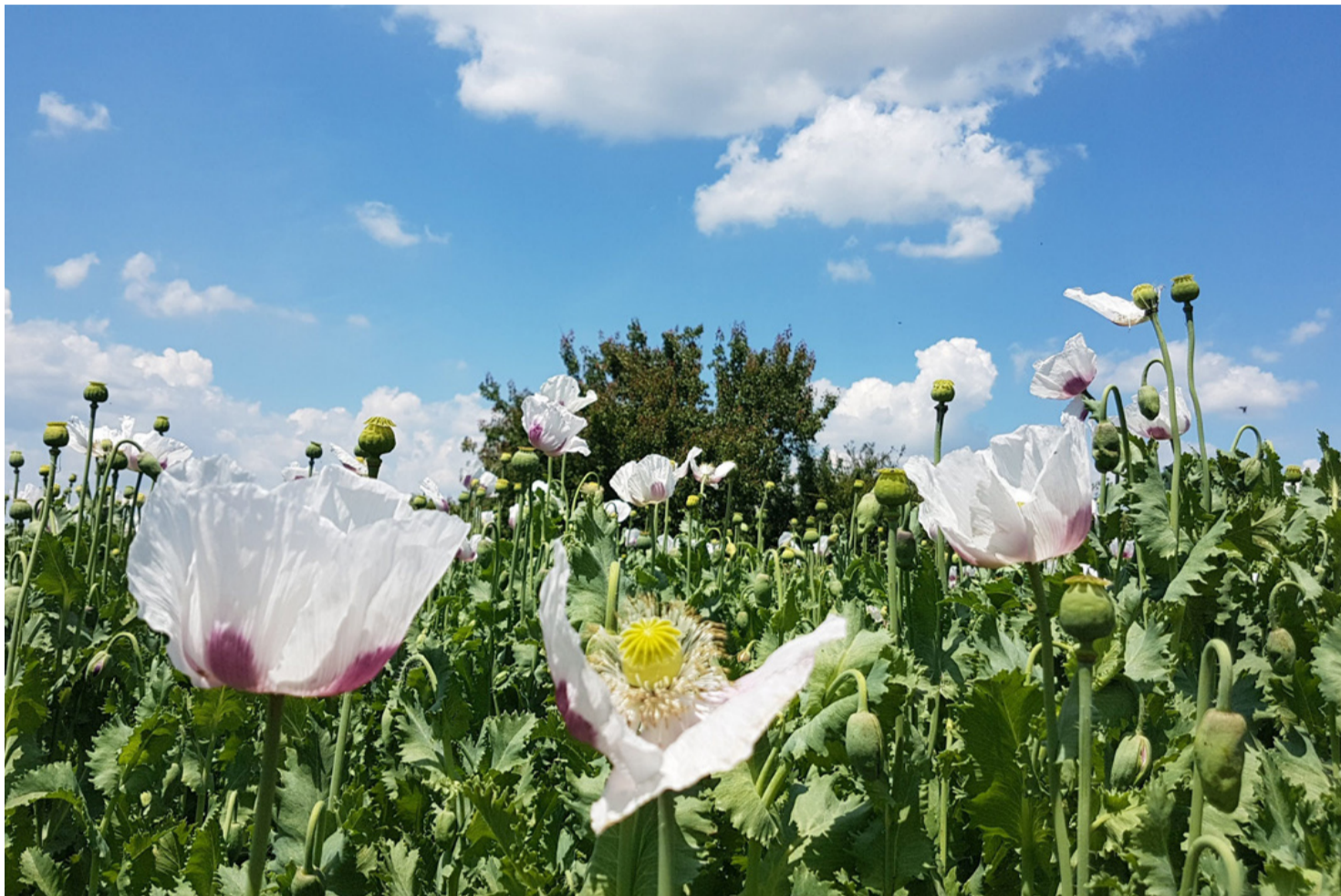
Ennek a mákföldnek a gazdája, nem tudja, mit szabad, vagy szereti a mákteát... De nem lesz mákja, ha így folytatja

A mák egyike a legrégebbi kultúrnövényeinknek. Már Egyiptomban is ismerték és használták a gubójában és szárában található alkaloidok narkotikus hatása miatt. Hazánkban a karácsonyi bejgli és a hétköznapi mákos tészta, rétes, guba, palacsinta töltelék egyik kihagyhatatlan alapanyaga.