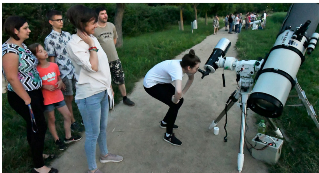
Az égi látványosság sok érdeklődőt vonzott a tóhoz