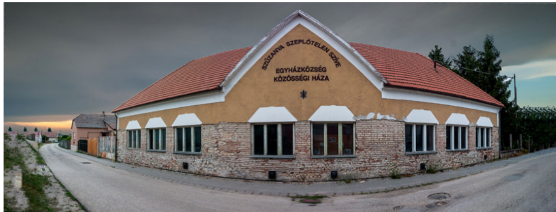
A felújításra szoruló épületben életminőség javító vállalkozásba kezdhetnek a baptisták

■ A szociális törvény értelmében az a települési önkormányzat, amelynek területén tízezerél több állandó lakos él, pszichiátriai betegek részére nyújtott nappali ellátást köteles biztosítani. Ajka Város Önkormányzatának képviselőtestülete augusztus 2-án rendkívüli ülést tartott, melynek keretében egyhangúlag elfogadták a Baptista Tevékeny Szeretet Misszió által tervezett Új Esély Központ létrehozását, mint a város közigazgatási területén szociális alapszolgáltatásként nyújtandó közszolgáltatást. A felek ellátási szerződést kötnek az intézmény kialakítása, megteremtése céljából.