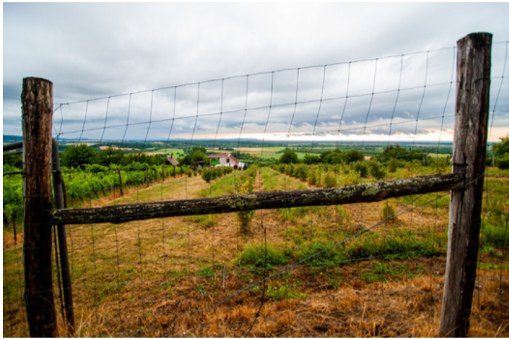
Az egyre fogyó szőlőben is nagy károkat okozhatnak a vadak

■ A városban a legnagyobb zártkerti terület a Csékúti szőlőhegy, amelynek tulajdonosai és a területen működő vadásztársaság jelezte, hogy egyre nagyobb gondot jelent számukra a vadak károkozása. Csékúti Hegyért Egyesülettel és az érintett vadásztársasággal egyeztetve eldöntöttek, hogy a megoldást az 1,3 kilométer hosszúságú vadkerítés felállítása volna, valamint rövidebb szakaszokon az utak felújítása, amelyekre egy pályázaton igényelhetnek támogatást.