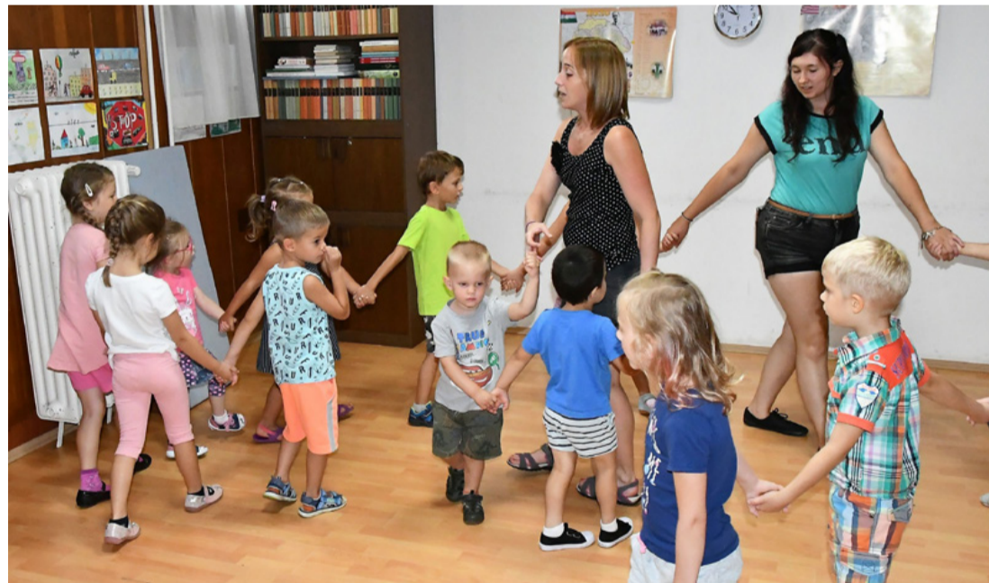
Vizsga közben az egyik hallgató és társa