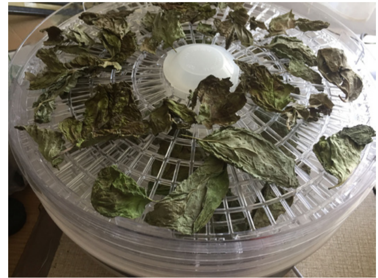
Csak óvatosan a szárítással

Gyorsabb eredményt érhetünk el, ha a modern világ vívmányait is bevetjük, mint az aszalógépet vagy a sütőt. Ezeket a magasabb nedvességtartalmú levelek esetén érdemes alkalmazni. Idén nálam rengeteg bazsalikom termett ezért én is többféle tartósítási módot próbáltam ki ezen a növényen. Azt tapasztaltam, hogy a levegőn szárított bazsalikom bár lassabban száradt, de sokkal finomabb és ízletesebb lett, mint az aszalóban készült társai. Sokan