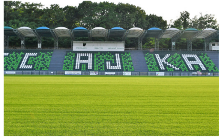
Az MLSZ szerint már rendben van a pálya, de szakértő szemek még felfedezhetnek hiányosságokat

A vezetőség 21 településen 12.000 darab promóciós bérletet osztott szét, hogy az ajkai és környékbeli lakosok is kilátogathassanak a mérkőzésekre. Amennyiben augusztus 8-ára rendben lesz minden, meglepetéssel is készülnek az új stadionban a szurkolók számára. A pálya nyugati oldalán a kapu mögötti részen egy büfé sor kerül kialakításra, valamint két darab 30 négyzetmé-