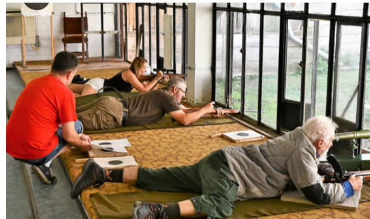
Lőállásban a kispuskások