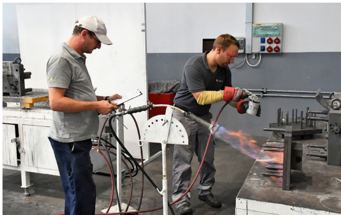
Vizsga közben az egyik hallgató és társa