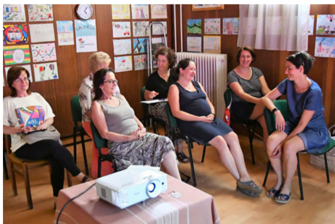
Az ökokör foglalkozások főleg hölgyeknek „jönnek be”