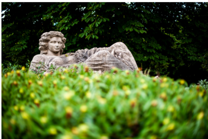
Gea még mit sem sejt a költözésről

■ Pályázat beadásáról való döntéshozatal határideje miatt tartott rendkívüli ülést Ajka Város Önkormányzatának képviselőtestülete augusztus 2-án. A döntéshozatal előtt szokás szerint a szakbizottságokban megtárgyalták az előterjesztéseket.