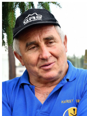
Varga Károly, az 1980-as moszkvai olimpia bajnoka is jól szerepelt

Második idej minősítő lövészversenyét tartotta 31 résztvevővel július 31-én az