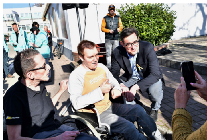
A főpolgármester mindenkivel emberi hangot ütött meg, aki hozzá fordult