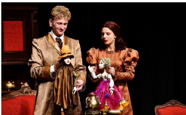
Ezúttal is szárnyalhatott a képzelet