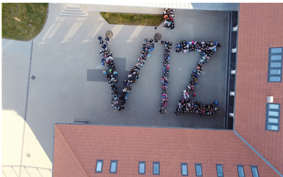
Az iskola tanulóinak élőképe a Víz világnapja alkalmából szervezett eseményen