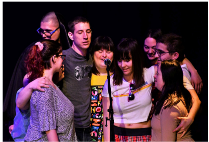
Az együtt éneklés felszabadítja a lelkeket