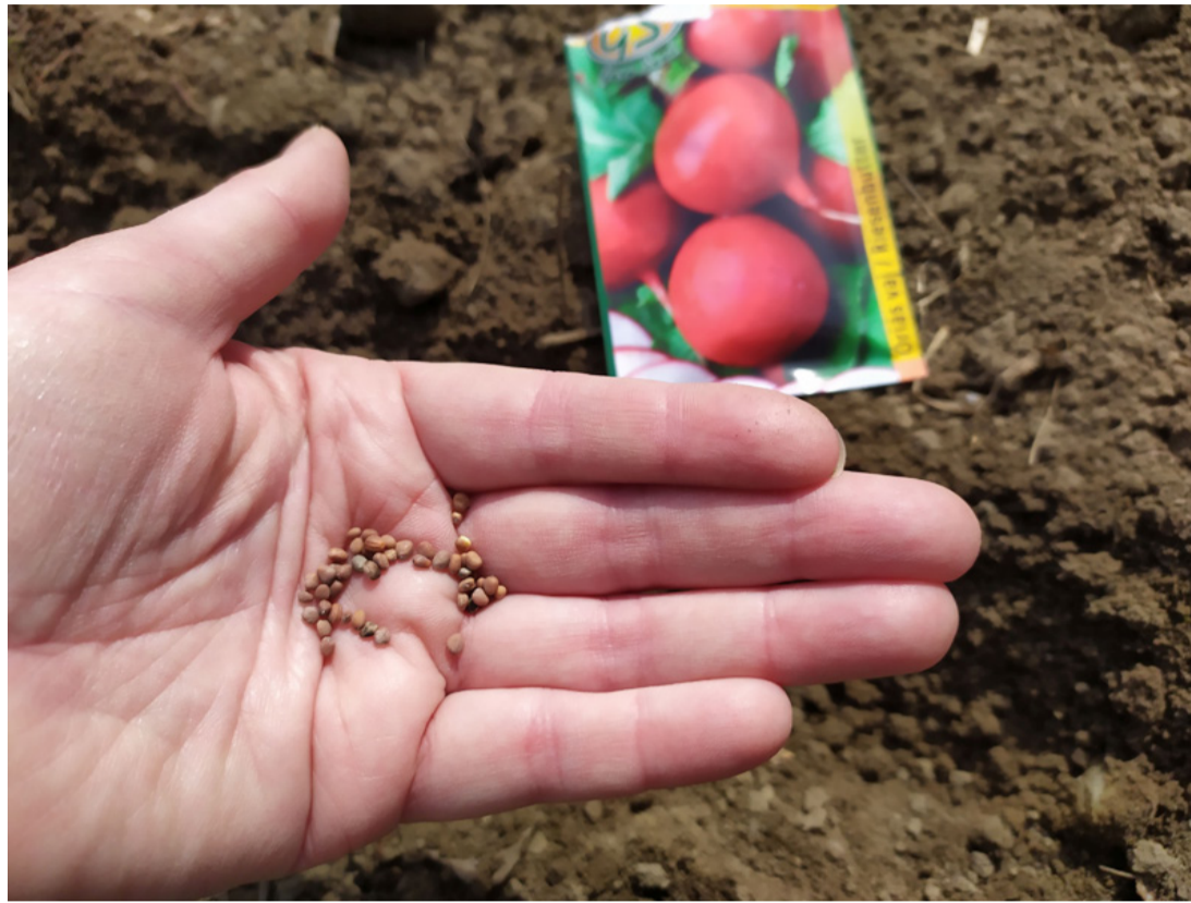
A retekmag gyorsan szárba szökken