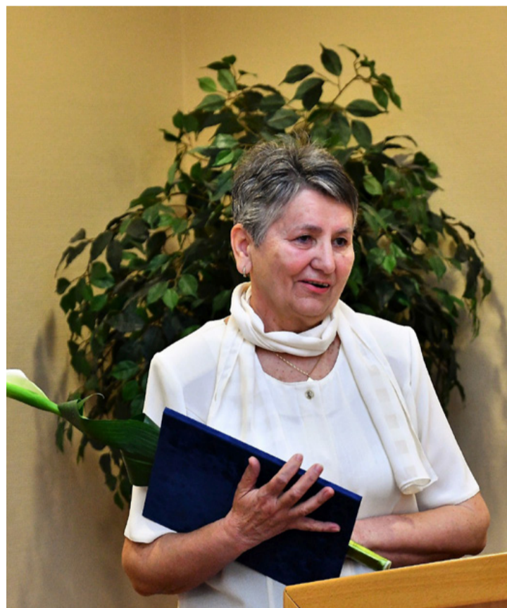
A kitüntetett helytörténész