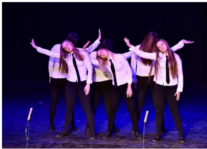
A Szent-Györgyi-s diákok sokszínű programmal készültek a díjkiosztó gálára

■ Gálaműsorral, majd a kiemelkedő tanulmányi, kulturális és közösségi munkát végző diákok elismerésével ünnepelte a Veszprémi Szakképzési Centrum Szent-Györgyi Albert Technikuma és Kollégiuma fennállása 30. évfordulóját a Nagy László Városi Művelődési Központ színháztermében március 25-én. Szerepelt a kollégium énekara, Papp Ferenc zenei kíséretével, bemutakoztak a tanárok egy vidám énekkel, a diákok verssel, dallal, tánccal és önvédelmi bemutatóval készültek.