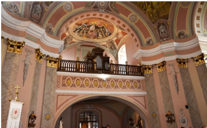
Mária, a kórus felett a cisztercita rend védelmezője, most a templombelsőt is megővta