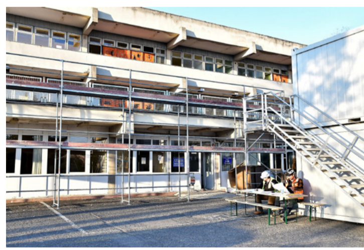
Építik, vagy bontják? – ez itt a kérdés