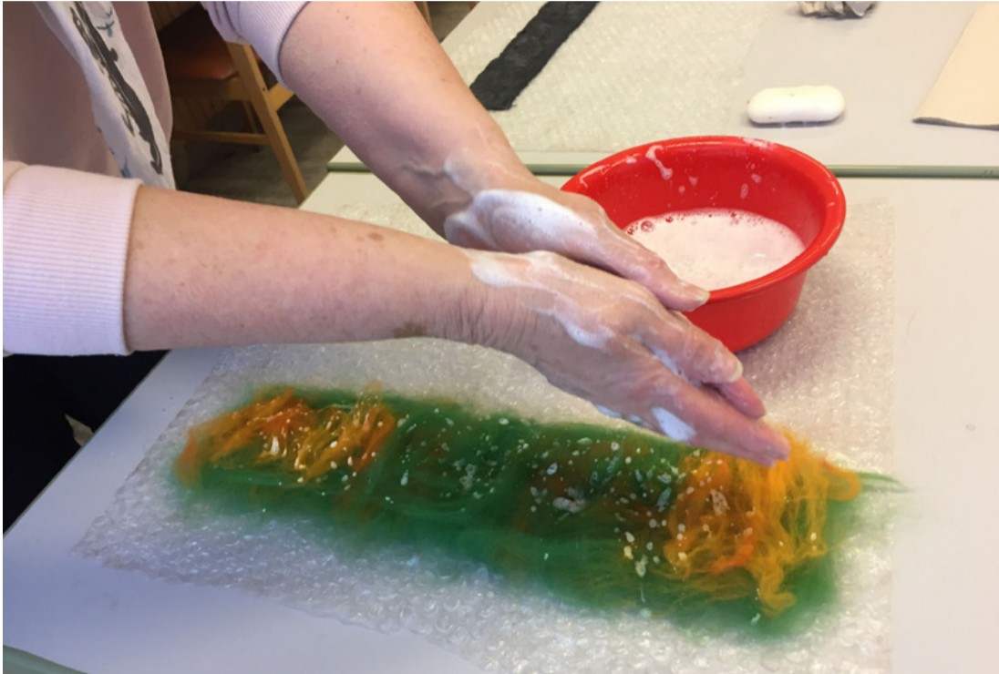
Itt nem kézmosáshoz kell a szappanos víz