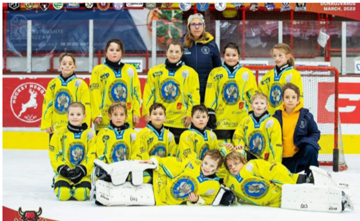
Az Ajkai Óriások U8 és afölött