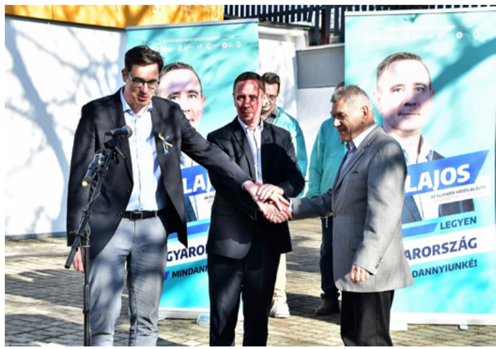
Együtt dolgoznak Magyarország szebb jövőjéért