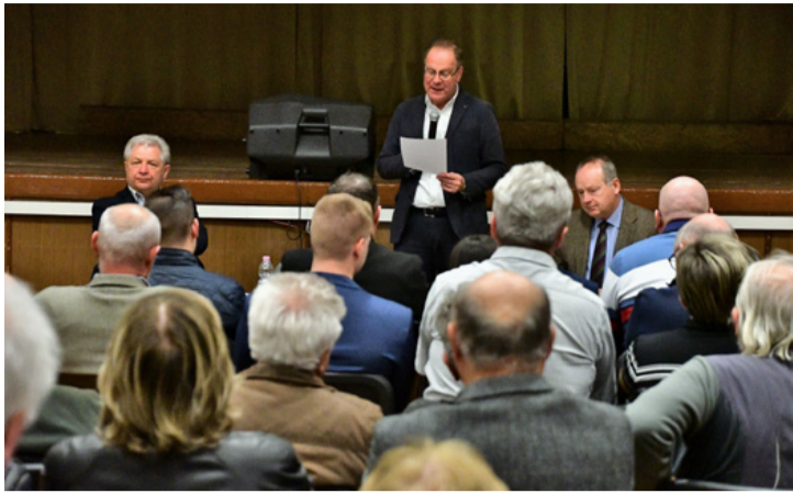
Szemben a lakossággal