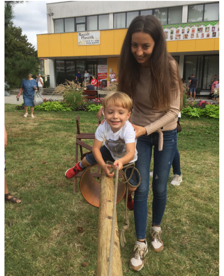
Próbára tette az ügyességet és a nevetőizmokat a hordós-rönkös játék