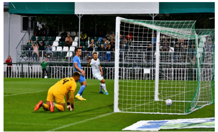
lta a pont...