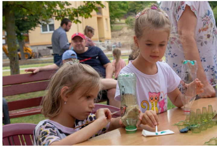
Látszólag nem a Föld megmentéséért küzdenek, pedig de...

■ Ezúttal mindent új köntösbe öltöztetünk! - ígérték a szervezők a harmadik Bazalt és Plasztik kreatív napon augusztus 20 -án az Agórán.