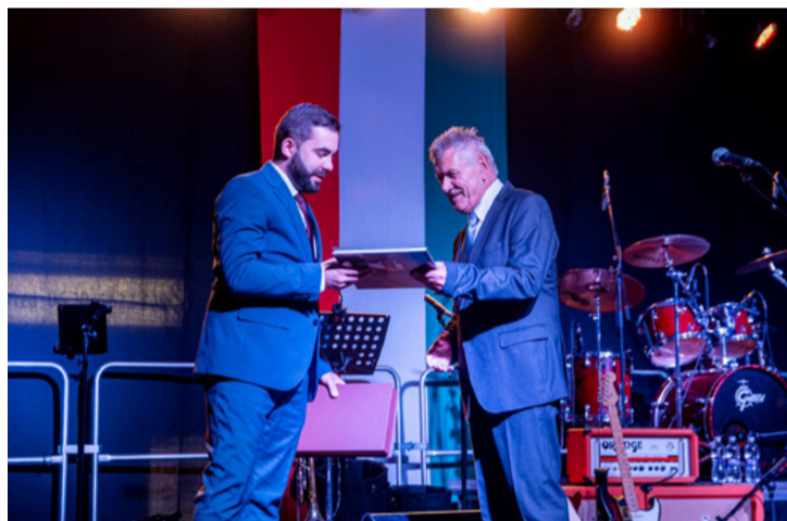
Ajka és Székelykeresztúr 30 éve testvérvárosok, de kapcsolatuk a romániai forradalomban fogant

■ Ajka főterén, az Agórán ünnepelt a város augusztus 20-án, ahol minden korosztály találhatott magának érdekes és izgalmas programot. A játékos és zenei rendezvényeken kívül elismerések átadására is sor került. A szórakoztatás mellett a nemzeti ünnep mondanivalója az összefogás fontossága köré szerveződött.