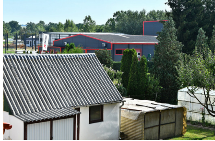
Ipari üzem a kiskertek mögött

Rossz nyelvek azt beszélik egyébként, hogy az avatáskor nem tudta (mert nem hívták fel a figyelmét rá), hogy ugyanazt az üzemet adja most át, ami ellen (még márciusban)