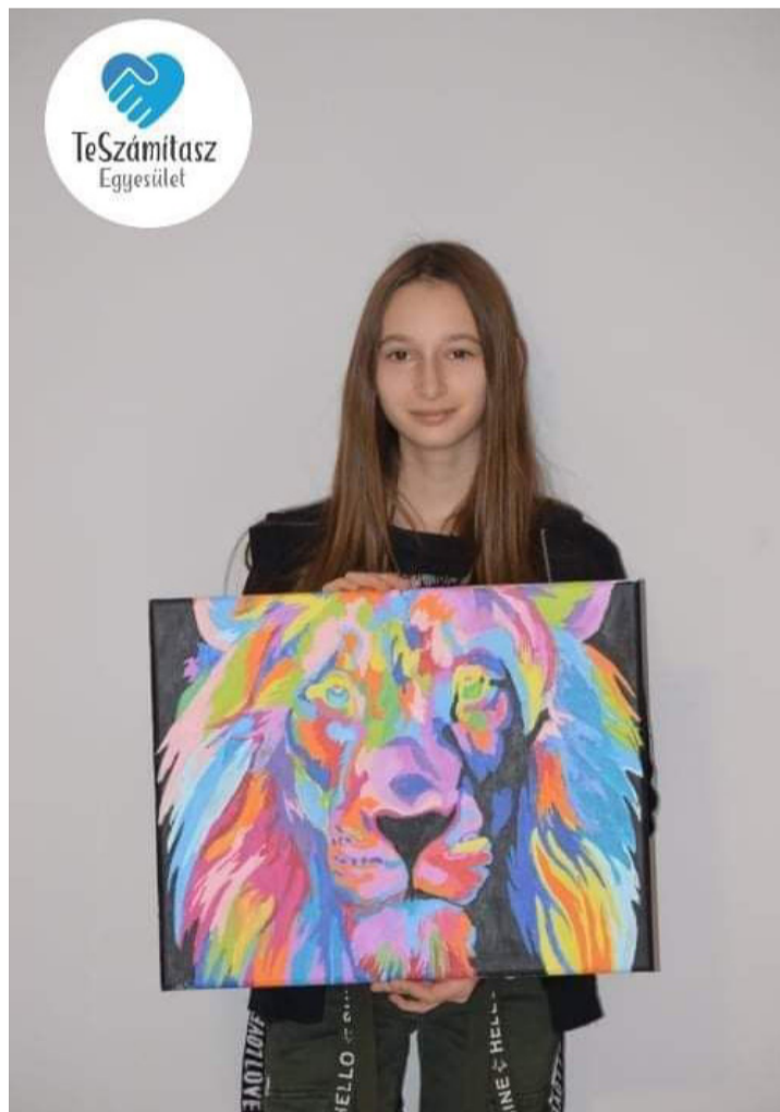
Az első festmény felajánlás

Vahur Állatvédő Egyesület is szerepet játszott. Róluk fontos tudni, hogy az állatok mentésén túl kampányokat indítanak rászoruló gyerekek segítésére is. (A két civil szervezet tehát egy-egy közös cél érdekében együttműködik.) Tavaly karácsonykor is sok gyereknek szereztek örömet személyre szóló ajándékokkal. Így amikor Viki kézbe vehette az új festőkészletét és a vásznat, munkához látott. Úgy döntött, szeretné valahogy megköszönni és meghálálni az ajándékot, amit az emberektől kapott. Így az elkészült képet árverezésre ajánlotta fel, melynek teljes bevételét a Te Számítasz Egyesület kapta – akik női higiéniai termékek vásárlására és adományozására költötték az összeget. Az árverési licit nyertese ezen túlmenően húszezer forint zsebpénzzel ajándékozta meg Vikit. Biztos vagyok benne, hogy már ki is találták, mit tehetett ez a jószívű, fiatal kamasz az összszeggel. Festővászonra és festékekre költötte, hogy aztán ismét felajánlhassa a bevételt. A kedves kutyát ábrázoló művéből származó árverés összegét ezúttal a „vahurok”