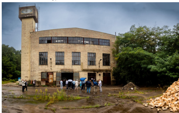
A küldöttségek az átalakulóban lévő Kriptongyárat is megtekintették