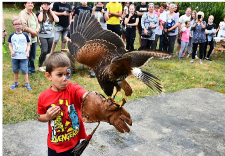
Arcfestés után jól jön egy kis sólyomröptetés