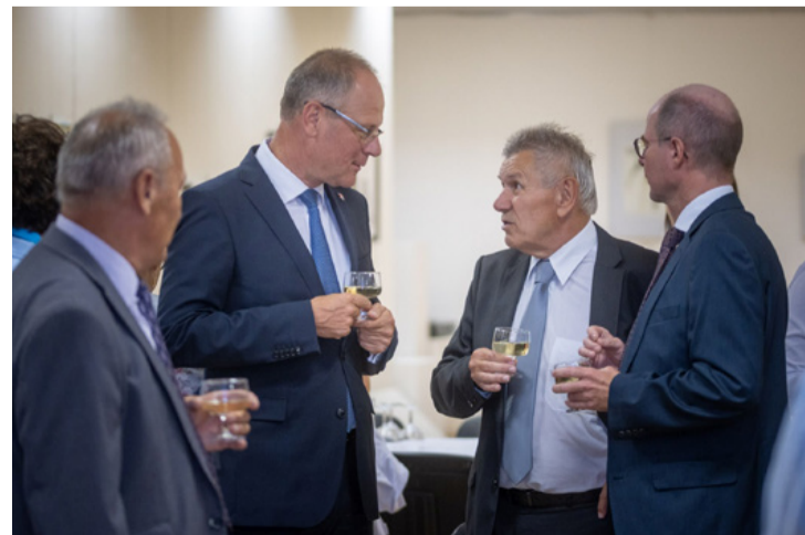
Néha egy kis pohár pezsgő mellett nagy dolgok is eldőlhetnek