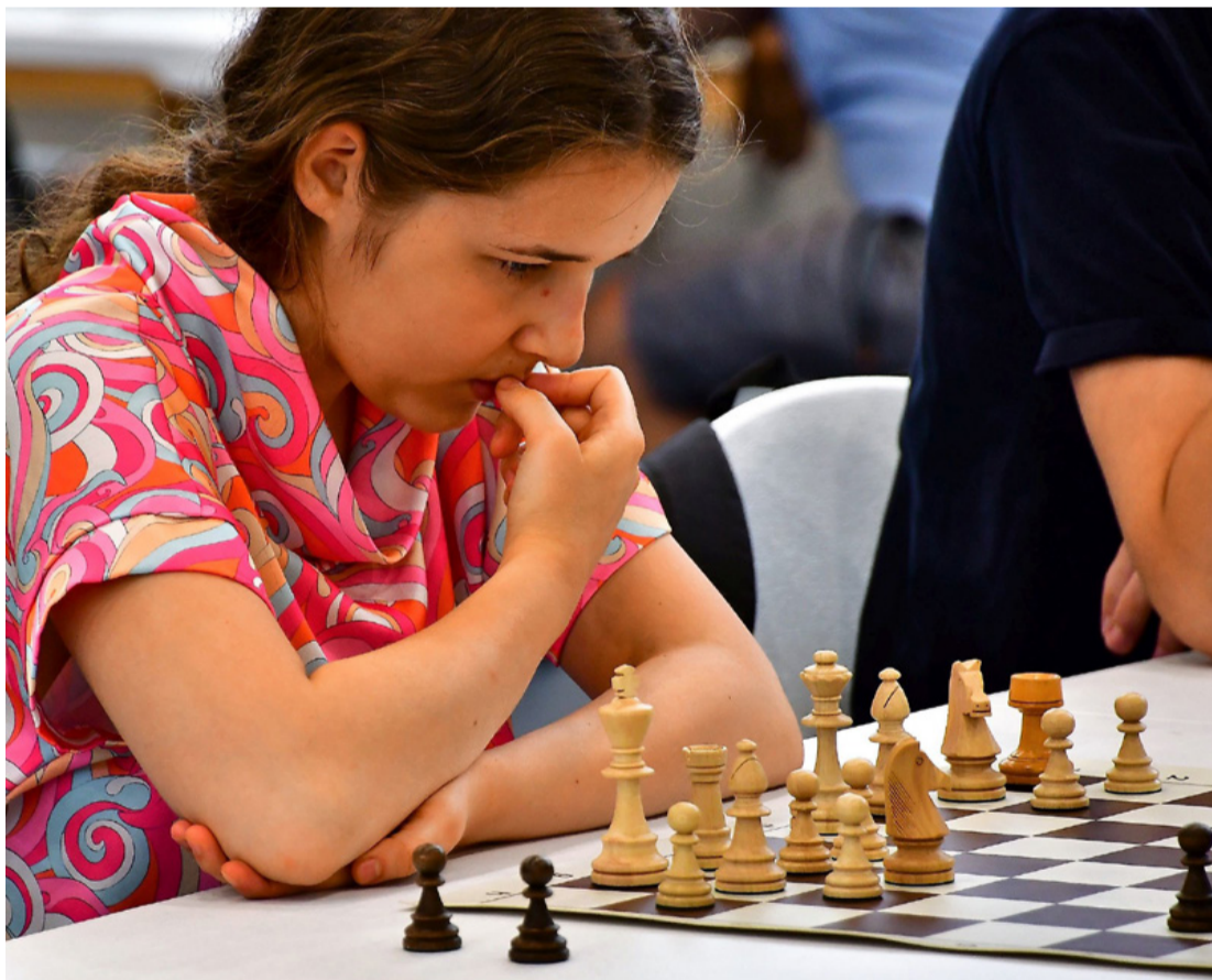
Ajka legifjabb olimpikonja