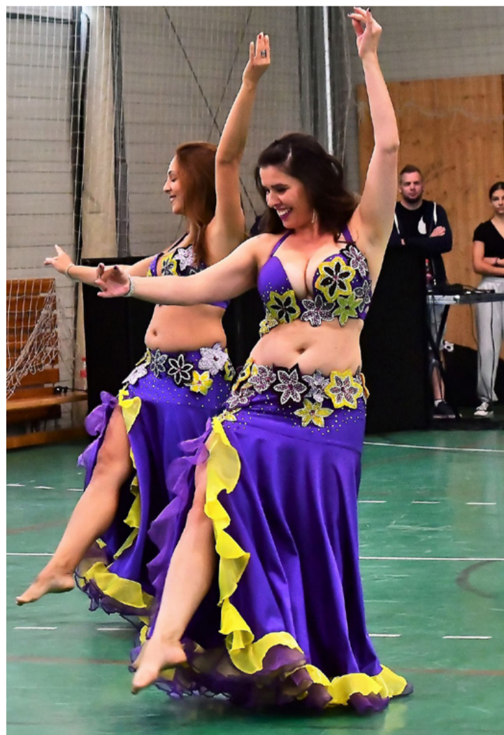
A hastáncosok a mozgás örömeinek élő reklámjai