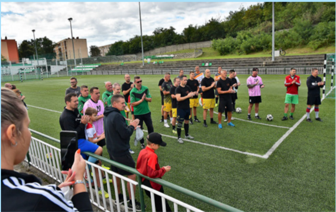
A foci pályán emlékeztek elhunyt sporttársukra