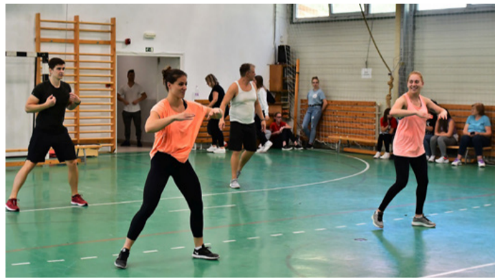
Egészségmegőrzésen munkálkodó hölgyek és urak a Szent-Györgyi tornateremben