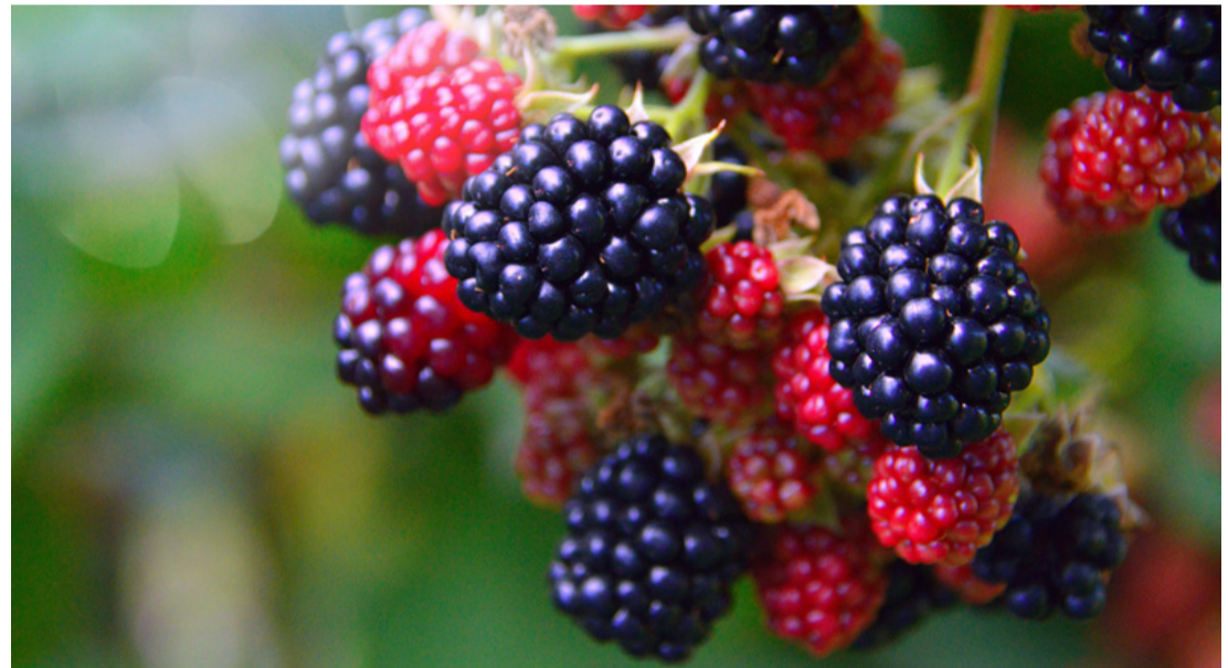
Amelyik piros, az még zöld...