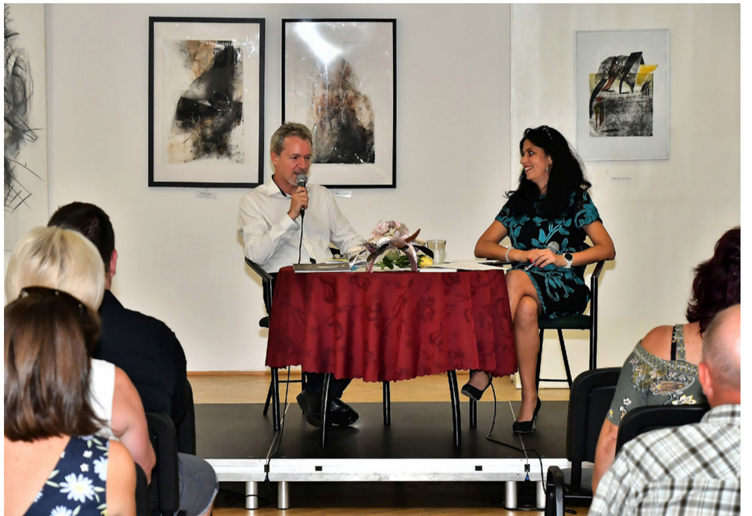
Az előadás egyik pillanata