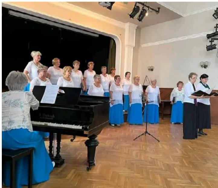
A Jubilate Női Kar fellépése a FEY-on

Kórusunk a partnerkoncert keretében délután lépett fel az Eötvös Gimnázium dísztermében a házigazda Jubileumi Eötvös Kórusal és a Gumpoldskircheni Mach 4 Férfikkal. A kórusok széles repertoárral jelentkeztek, és a hálás közönség nem sajnálta a vastapsot. Az énekesek komolyan vették a feladatot, ugyanakkor könnyedség hatotta át az összes produkciót, hisz ez alapvetően egy baráti találkozó volt. Nem ma-