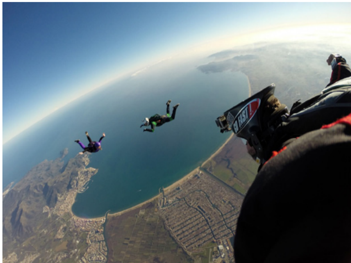
Ez az élmény mindent felülír