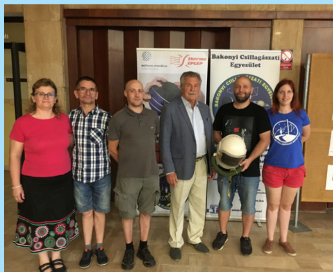
A sztratoszféra ostromlói egy hús-vér űrhajós társaságában