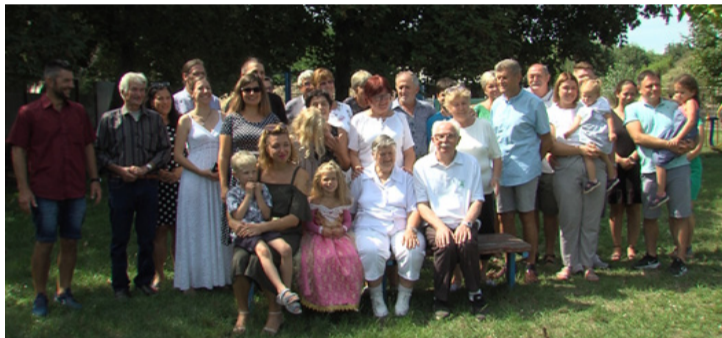
A szűk család. Jobbra az „ifjú pár”