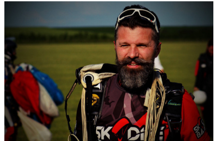
Ugrás után kisimultan