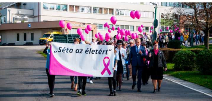
A séta a figyelemfelkeltést és a reményt szolgálja