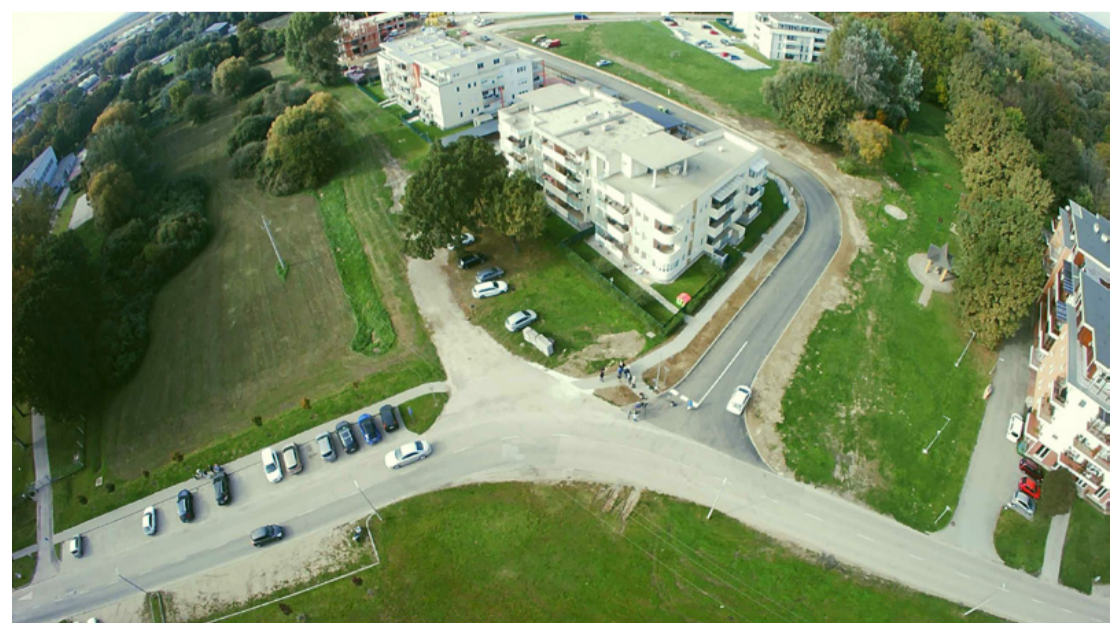
Az átadás előtti pillanatok madártávlatból