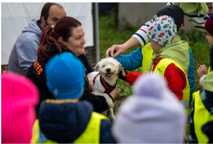
Simizni is lehetett...