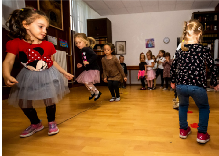
Olyan ez, mint beszélni, vagy járni tanulni. Később jöhetnek a „dialektusok”

A néptánc tanulás sokféle kompetenciát fejleszt, például megtanulnak együtt, csapatban játszani, zenére mozogni, javul a mozgáskoordinációjuk, a ritmusérzékük, a figyelmük. A tánc, éneklés, játék élményt nyújt, örömmel csinálják, észre sem veszik, hogy közben több néptánc motívumot is elsajátítanak.