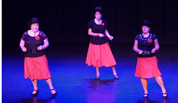
Mindenki annyi idős, amennyinek érzi magát

Az idősbárát önkormányzatok – mint amilyen Ajka is – idén is pályázati lehetőséggel segítik a klubéletet. Ajkán 25 nyugdíjas klub van, amiben több mint ezer nyugdíjas van jelen, akik tesznek