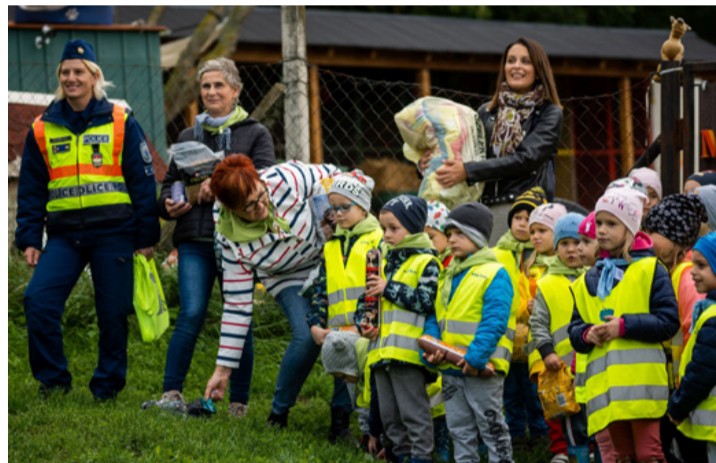
Sokan már otthon is ismerkednek a felelős állattartással

Az elmúlt időszakban több olyan ebet vettek gondozásukba, aminek a gazdája meghalt, de olyan is előfordult, hogy válást követően egyik félnek sem kellett a korábban szeretettel gondozott kedvenc. A menhelyen élő kutyák sétáltatására továbbra is várnak önkénteseket. (ta) ■