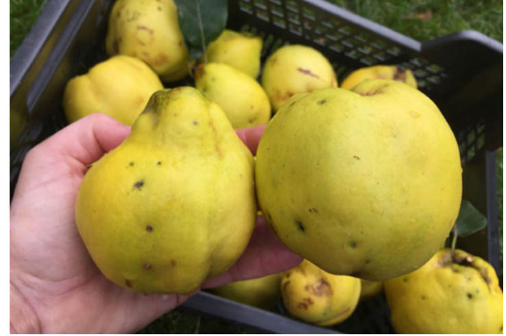
Össze lehet hasonlítani az „almát” a „körtével”? Igen!

A hagyományos birsalmasajt recept Horváth Ilona klasszikus szakácskönyvéből: „Szép, érett birsalmákat negyedekbe vágunk, magházuktól megtisztítjuk, héjával együtt forró vízben puhára főzzük. Szűrőkanállal kiszedjük és szitán áttörjük. Most az áttört gyümölcsöt lemérjük és egy