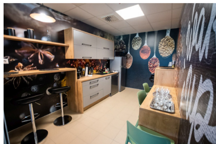
Az „étvágygerjesztő” teakonyha

Megtalálható ugyanitt egy pihenőszoba is, ahol babzsákok és függő fotelek vannak, a falon pedig az őserdő idézõ tapéta. Van „London”, „Párizs” és „New York” tárgyalószoba, amelyek falait az adott