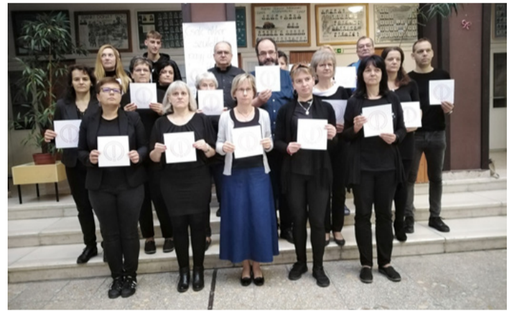
A sztrájkoló bányászok csapata