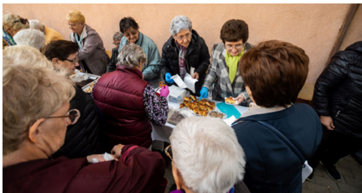
A közösségépítő rendezvény egyik csúcspontja hagyományosan az Üveges Klub gasztroshow-ja

Az Ajkai Szónak hírek, tudósítások küldhetők az ajkapress@gmail.com címre. Telefon: +36 30 9930 364