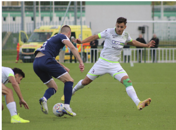
Máté (háttal) lendületes játéka ellenére már a 23. percben lecserélték

Ajka Városi Sportcentrum, 1200 néző. Vezette: Görög Mórió (Bede Tamás, Bertalan Dávid)