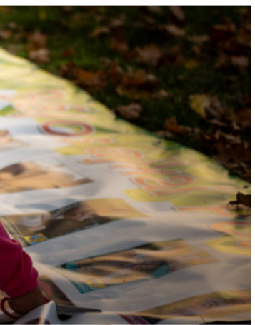
A tesó archépe családi ereklje lesz

Az alpolgármester köszönetet mondott mindazoknak, akik