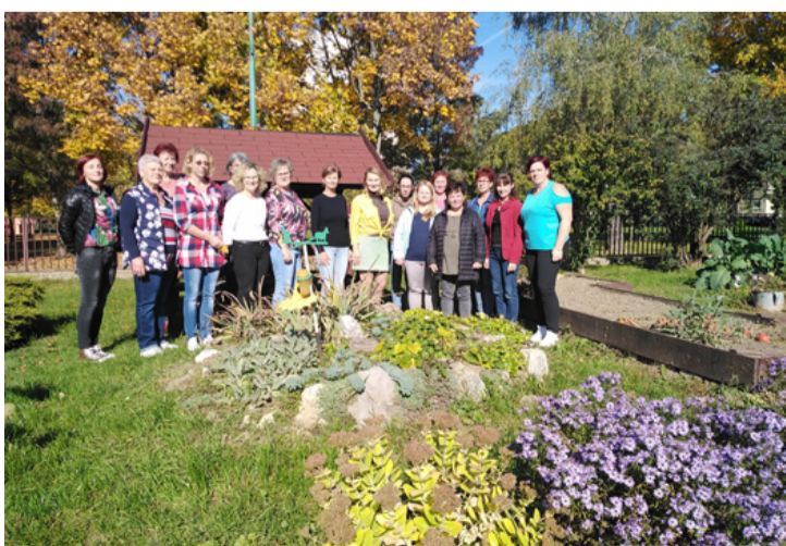
A vendégek és az ajkai óvodapedagógusok a Hétszínvirág óvoda kertjében