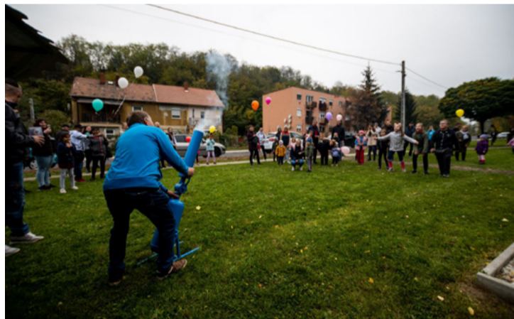
A Fafeszt látogatóit sok érdekes játék várta

A Kreatív kuckóban falevelekből készítették faliképet.