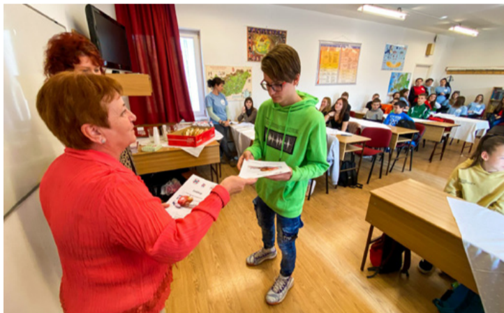
Most sem maradt el a díjazó a verseny végén

Kilenc csapat között dőlt el az Egy nap az egészségéért vetélkedő helyezéseinek a sorrendje. Az egészségügyi hivatás iránt kedvet érző hetedik és nyolcadik osztályos diákokat 1994 óta hívja a versenyre a Veszprémi Szakképzési Centrum Szent-Györgyi Albert Technikum és Kollégium. Az idén a Magyar Egységügyi Szakdolgozói Kamara is segített a szervezésben és a lebonyolításban. A résztvevő csapatok tanárai segítségével az előre kiadott tematika alapján készülhettek.