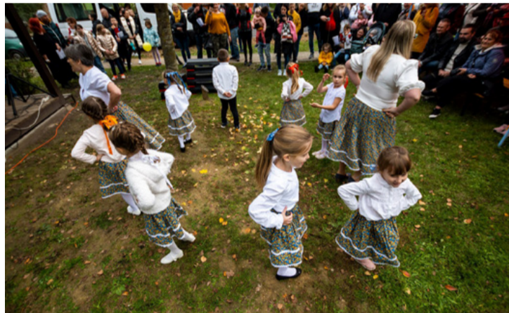
A Pataktéri óvodások a közönség gyűrűjében

■ Ismét több százan látogattak el a Csingervölgyért Egyesület által második alkalommal megrendezett Csingeri Fafesztiválra október 22-én. Az eseményen fel-lépők a belvárosból kisvonattal utaztak a helyszínre, a Bányászati Emléparkba.