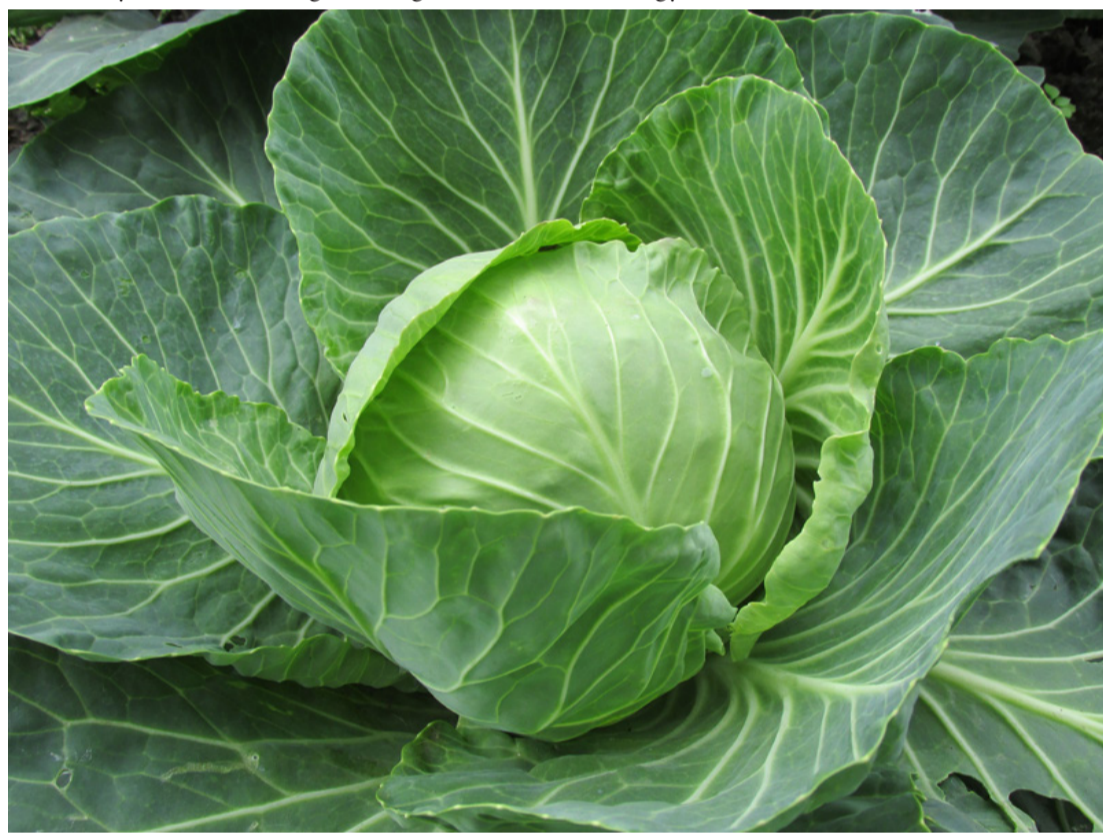
A gasztronómiai kultúra nélkülözhetetlen eleme egész Európában