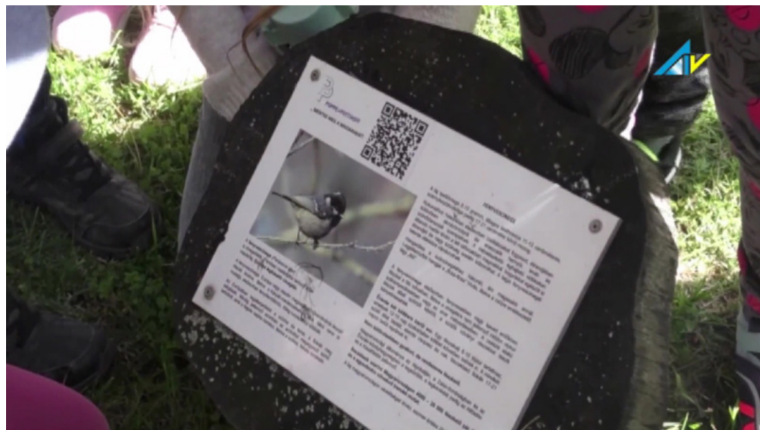
Egy képkocka az Ajka TV tudósításából

Ha a szülők óvodás vagy iskolás gyermekükkel megteszik a túrát, akkor lehetőség van kétszer kitölteni az űrlapot. Ebben az esetben magánszemélyként jár ajándék