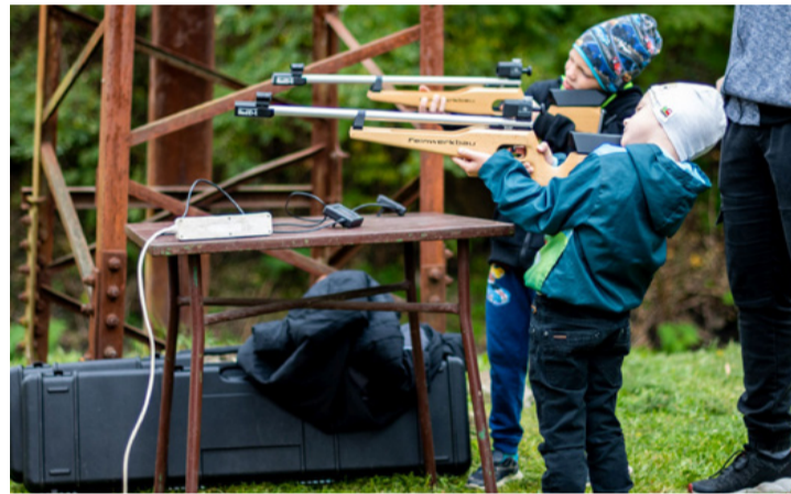
A lézerlövészet puskáit szemlátomást nem ergonómikusok tervezték