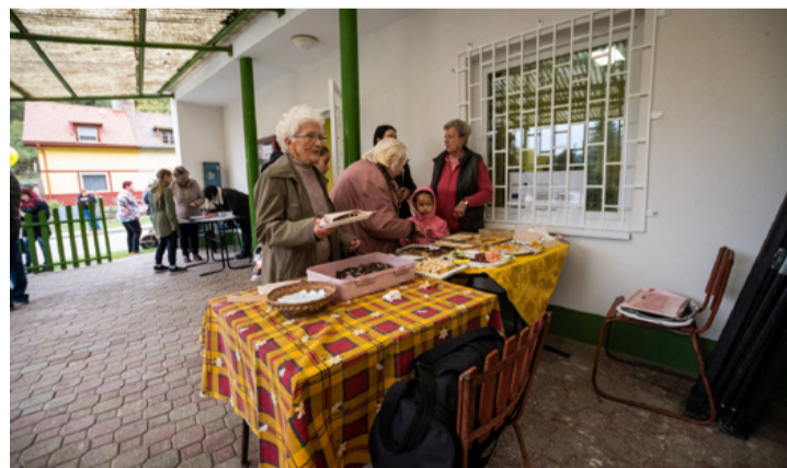
A Csingervölgy hölgyei ezúttal is jelesre vizsgáztak vendéglátásból