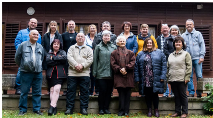
Az egykori diákok és ma már vasdiplomás tanítójuk