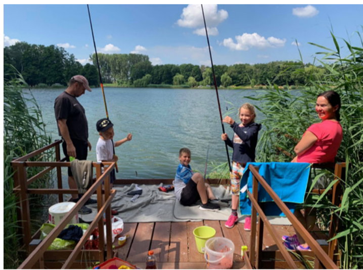
Amikor még napfényes volt minden – horgászverseny a Lőrinczi-tavon

Múlt vasárnap ülésezett a Lőrinczi-tavi Horgász Egyesület, de a jövő évi tagdíjakról elnapolta a döntést, mivel néhány kérdés még tisztázásra vár. Az biztos, hogy a haltelepítés árának emelkedése és az egyéb költségek növekedése őket sem kerüli el. A tagdíjak