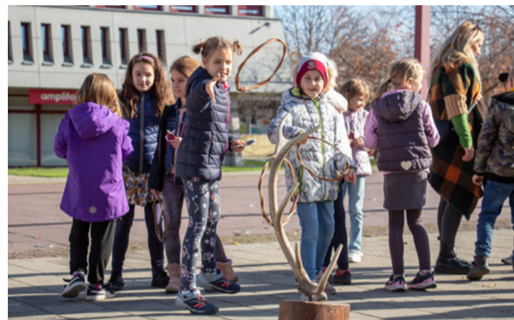
Így kell agancsra karikát dobálni