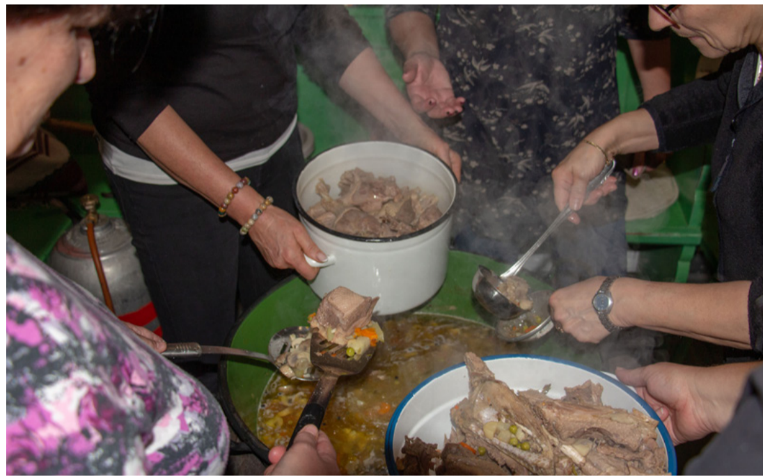
Így készült a rendeki libaragu leves – gazdagon