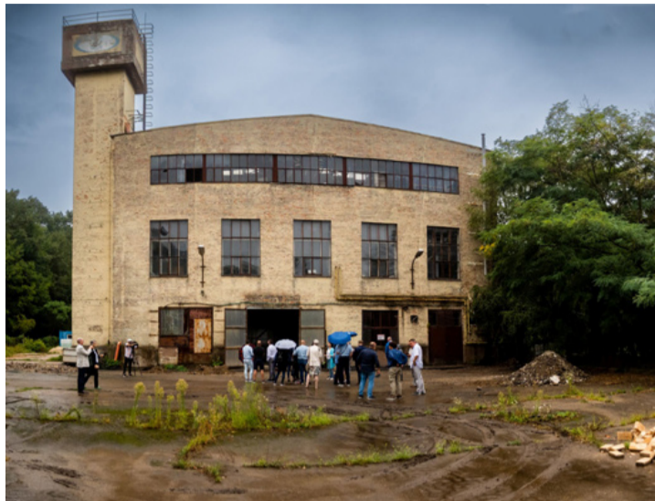
A Kriptongyár kulturális és turisztikai funkciót kap, ezért vált szükségessé a terület övezeti átsorolása