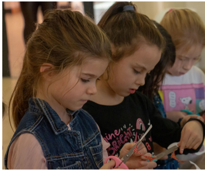
Ami ilyen nagy figyelemmel készül, biztosan szép is lesz

■ Őszi hangulatú játékdélelőtre várták november 3-án délelőtt 9 órától a Nagy László Városi Művelődési Központ dolgozói az Agóra és a színházterem aulájába a gyerekeket és a felnőtteket. A szervezők népi fajtákkal és kézműves foglalkozással készültek.