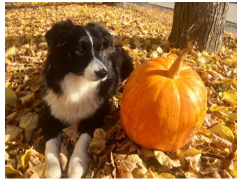
A tök három „árnyalata”