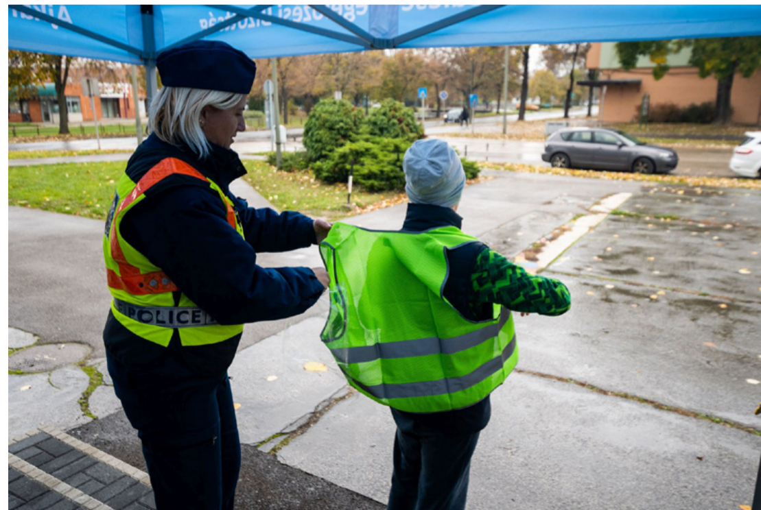
Átöltözés láthatósági mellénybe. Angliában ma már hétköznapi viselet a fényvisszaverő kabátka

logosként is a viseljenek lehetőség szerint olyan ruházatot, ami tartalmaz fényvisszaverő felületeket is. Ezzel megkönnyítve azt, hogy a járművezetők idejében észleljék őket és mindenki biztonságosan hazerjen. (ta) ■