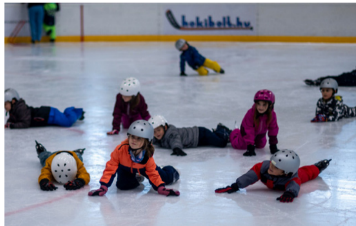
Először is el kell tudni esni

Több, mint 200 kisgyermek szülei igényelték az oktatást, amelyet az Ajkai Óriások