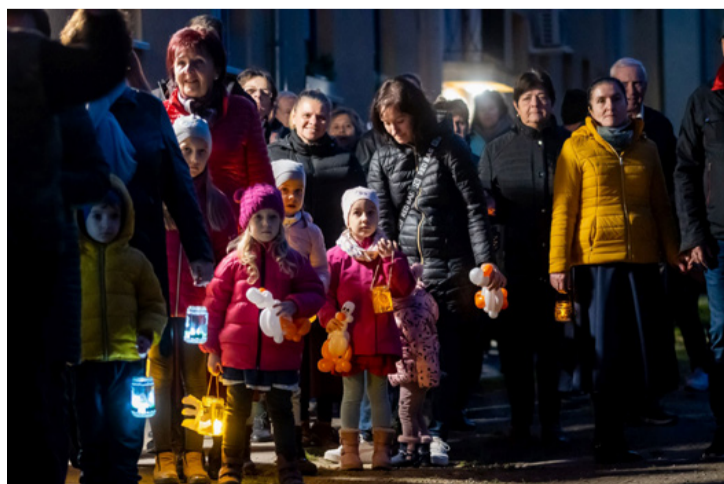
Kicsik és nagyok együtt őrzik a hagyomány lángját