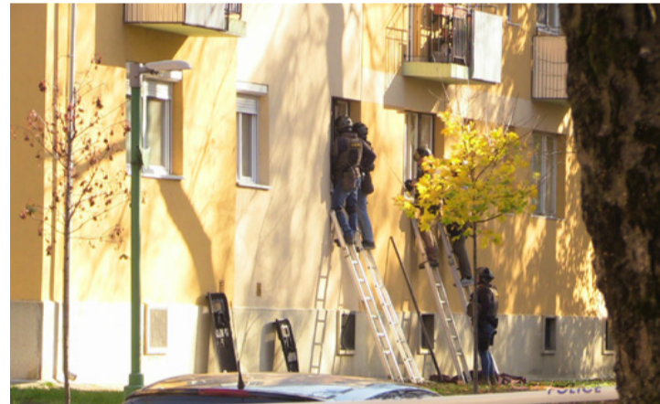
Néhány létra és „kész a kocsi”

Az egyenruhások kérésére a 65 éves dühödt férfi már a lakásában tartózkodott, de nem akart ajtót nyitni a rendőröknek. Ordítva fenyegette a hatóság embereit is. A rendőrök hallották, ahogy a férfi