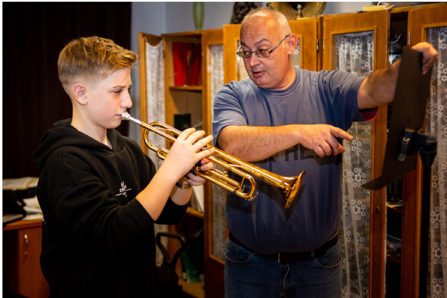
Egyik növendékével a zeneiskolában