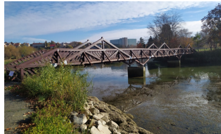
Jövő nyárra megújul majd a fahíd is, így újra megközelíthető lesz a sziget

A sajtótájékoztató kérdéseket is lehetett feltenni a szakembernek, aki szívesen vála-