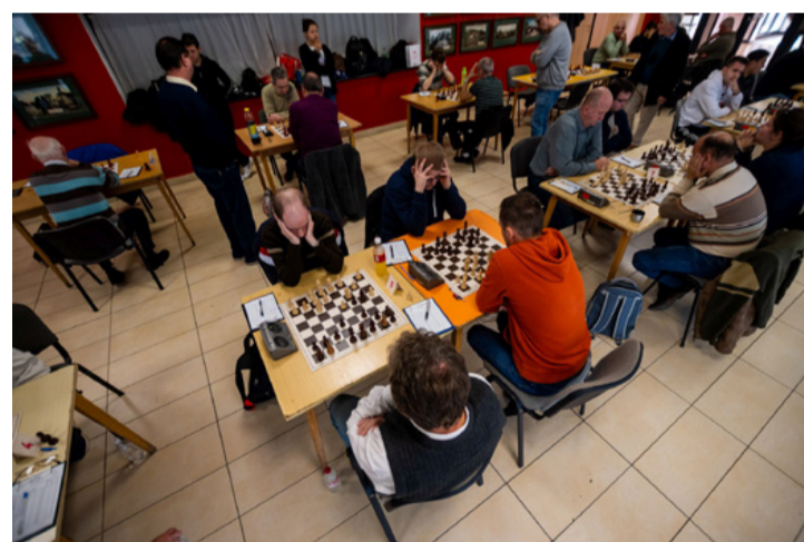
A sakkcsata „huszár perspektívából”