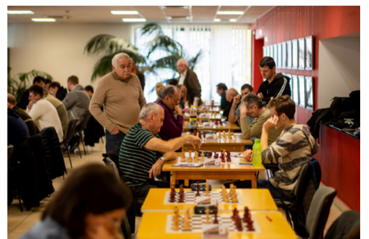
A helyiek küzdelme...