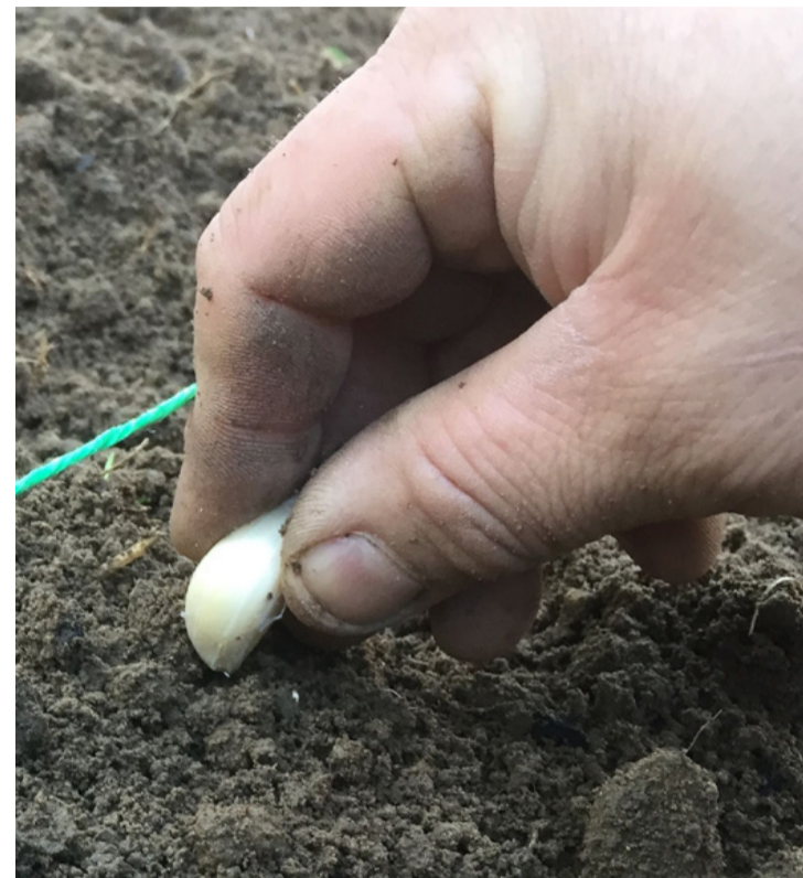
Vigyázzunk, nehogy fordítva dugjuk a földbe a gerezdet

Az ültetéshez, egészséges, ép gerezdeket használjunk, amiket egymástól 10 cm-es tőtávolságra és 25 cm-es sortávolságra rakjunk a földbe. Mindig jól nézzük meg mielőtt a földbe dugjuk, hogy nehogy fejfelé sikerüljön a műveletünk. Az ültetés helyét napos, világos esetleg kissé árnyékos helyet is választhatunk. Teljes árnyékba ne ültessük.