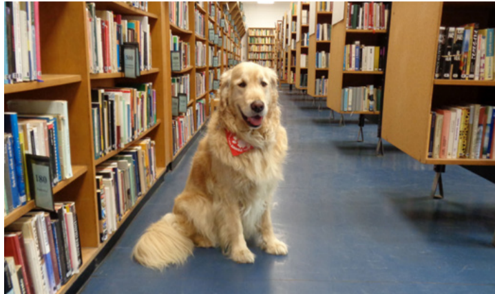
Mese a könyvespolcok között

Nemrégiben az ajkai Bogáncs Gyermekkönyvtárban is vendégeskedtünk Mesével. Külön örömmre szolgált, hogy olyan könyvajánlókat is tartottak a könyvtárosok a diákok számára, amelyek a kutyák neveléséhez, felelős tartásához nyújtanak segítséget. A rendezvényekre Mesét Lego, a tanuló terápiás kutya is