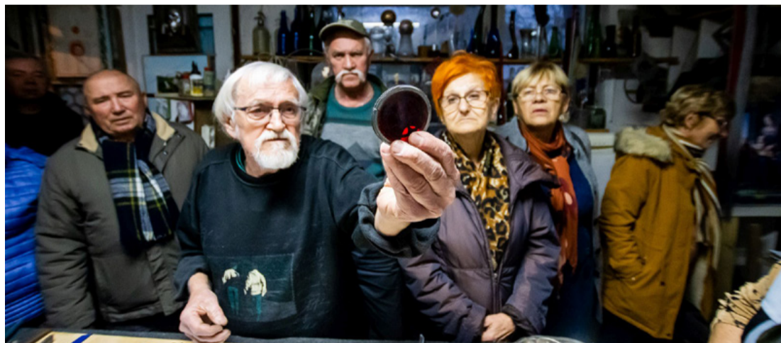
Kiss Miklós az érdeklődők egy csoportjával