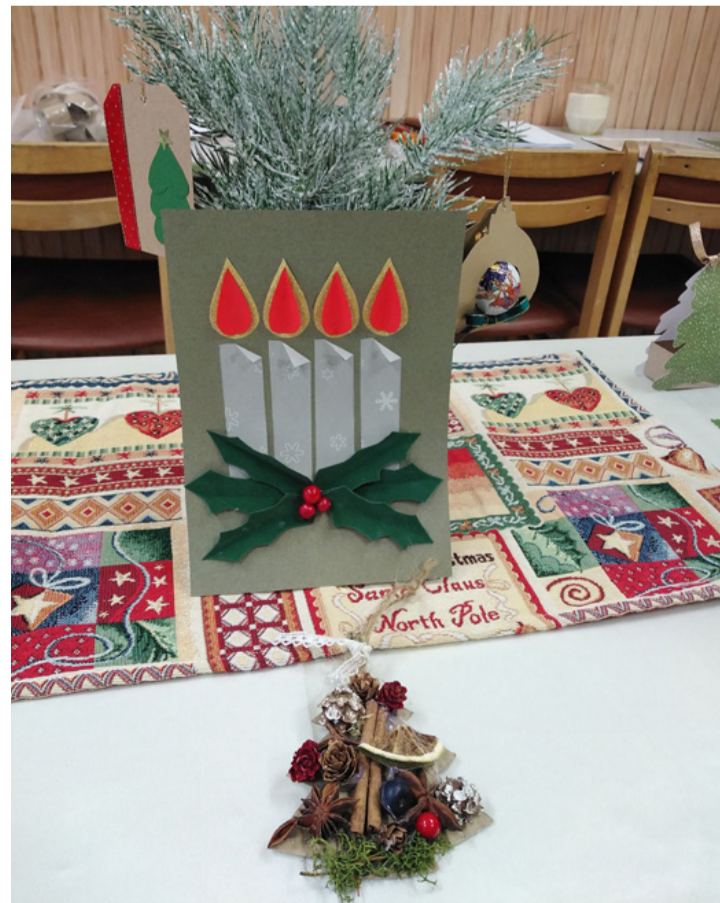
Ötletek a börzéről