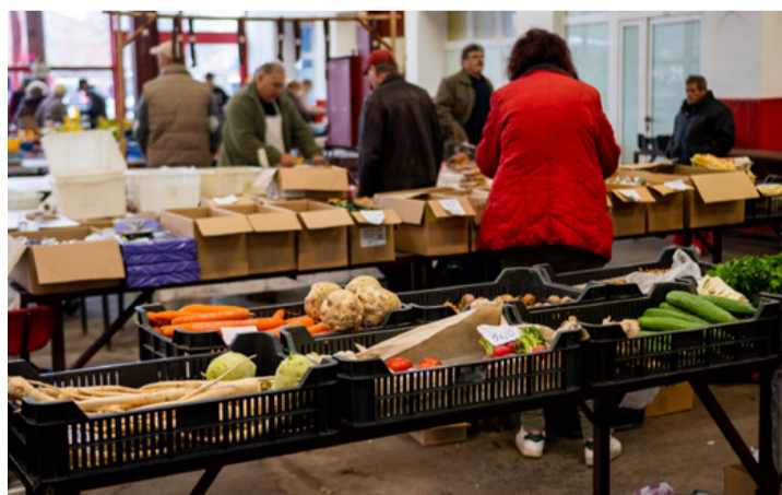
Árúból nincs hiány