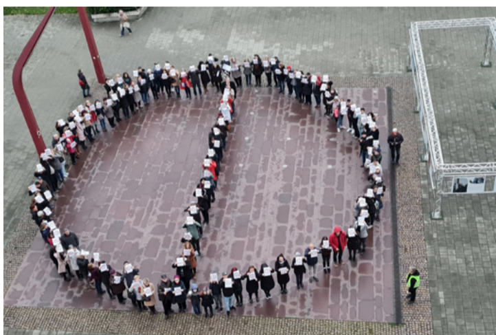
A tiltakozás és a jövőért való aggodás élő emblémája