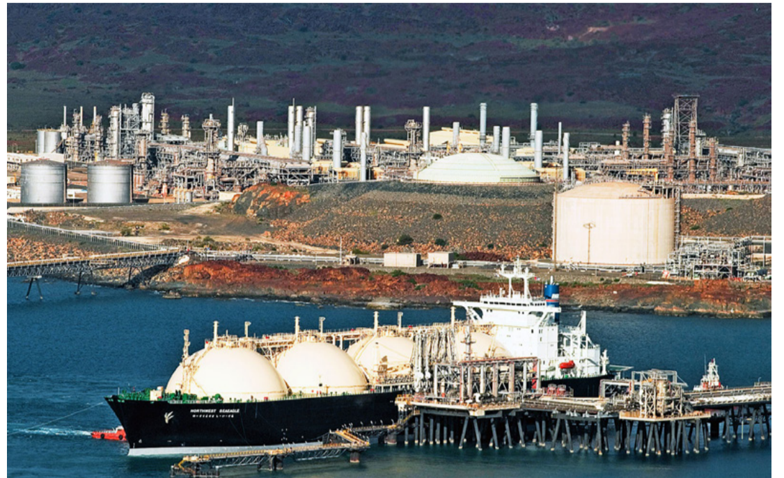
Palagázzal töltenek fel egy tankert

Ennél is aggasztóbb, hogy a palagázt ún. hidraulikus rétegreperesztésnek nevezett eljárással termelik ki, melynek