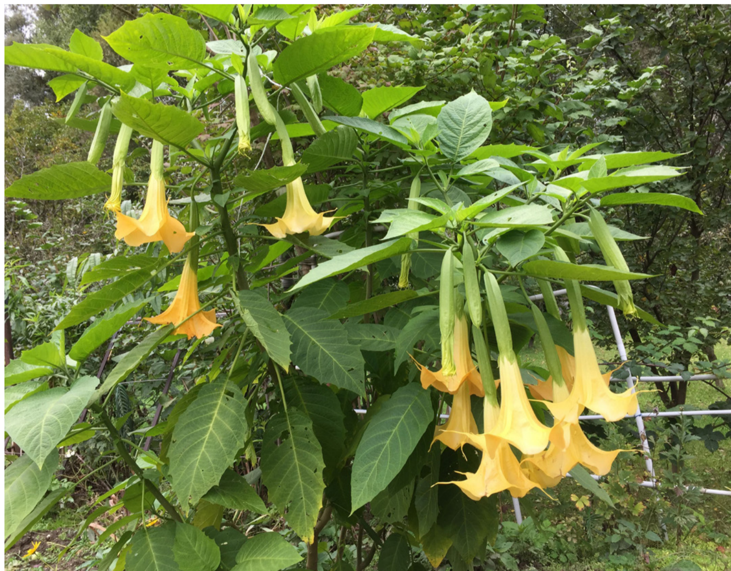
Kertünk mérgező csodája

*Az adatok tájékoztató jellegűek, mivel az adatokat csak rossz minőségű képfájlokban kapjuk meg, az átmásolás így hibával járhat.