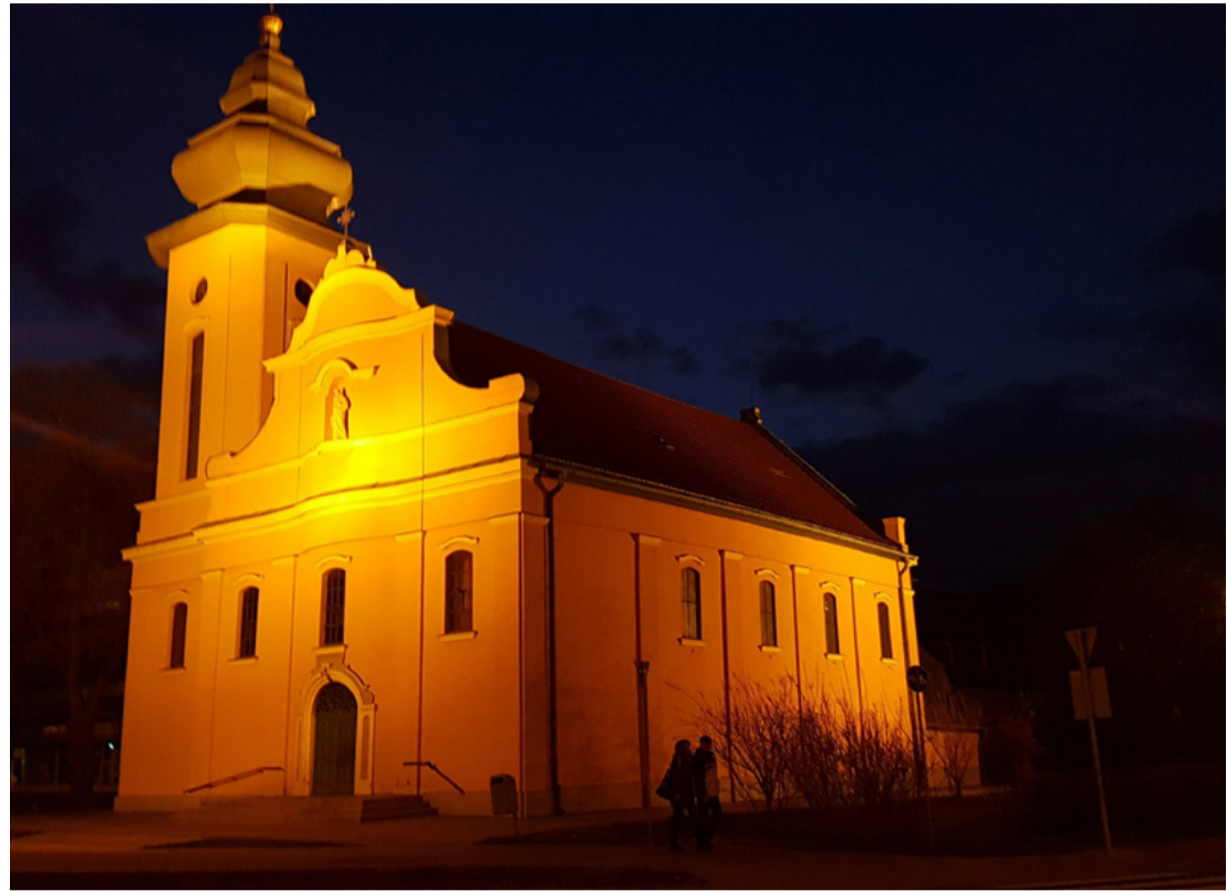
Ezentúl csak nappal csodálhatjuk?

Az intézkedés végrehajtása természetesen az E.ON, mint energia szolgáltató bevonását is szükségessé teszi, ezért az elmúlt hetekben Ajka Város Önkormányzata az E.ON Energiamegoldások Kft.-vel tárgyalásokat folytatott arról, hogy az energia-válság miatti többletköltségek csökkentése érdekében a városunkban található templomokat és egyéb helyszíneket megvilágító reflektorok átmenetileg kikapcsolásra kerüljenek. Az Önkormányzat kezdeményezte, hogy a Kft. járuljon hozzá 59 db díszvilágítási reflektor ideiglenes kikapcsolásához, használatuk átmeneti szüneteltetéséhez. A díszvilágítás átmeneti szüneteltetése