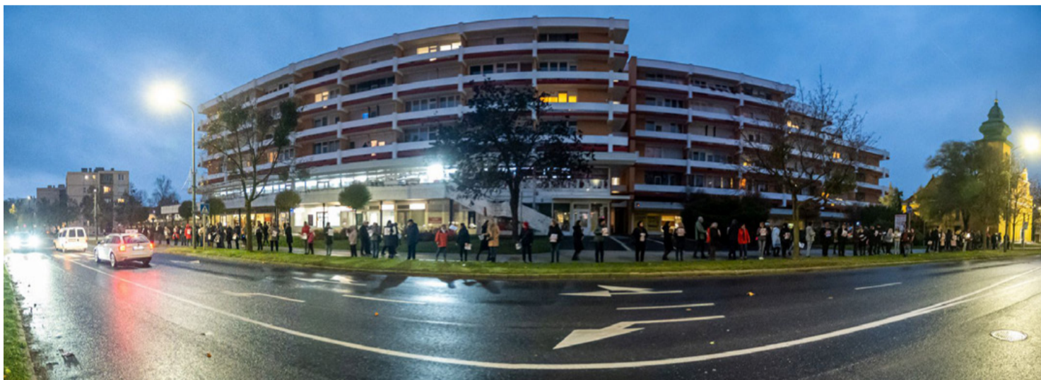
A jövőnk most mindennél fontosabb. Élőlánc a Szabadság téren