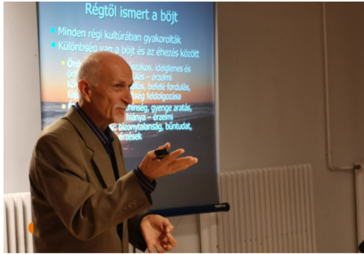
A bójt fontossága minden világvallásban hangsúlyosan szerepel