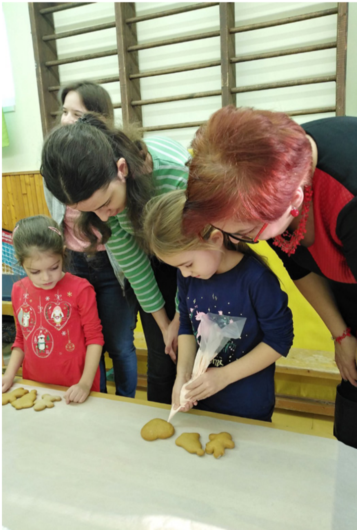
Közösen díszíti a mézeskalácsot az óvodás és a középiskolás

A karácsonyi felkészülés jegyében zajlottak a Szeretet hete programjai a Zöldikék óvodában advent harmadik és negyedik hetében. A generációk közti együttműködés keretében nagyszülők érkeztek az egyik nap, akik meséltek arról, hogyan ünnepelték a karácsonyt gyermekkorukban, majd papírból közösen karácsonyfákat készítettek.