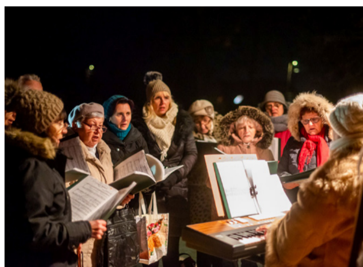
Meghitt várakozás Csikólegelőn