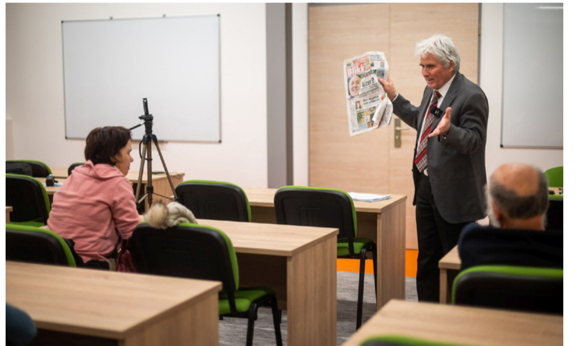
A bulvársajtó elsősorban a példányszám növelésére közöl „kattintásvadász” híreket