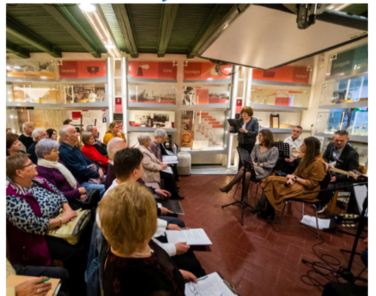
Hangulatos este volt, az adventhez méltó