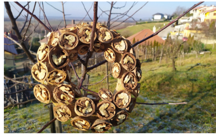
A diókoszorú hasznos és ráadásul szívet melengető látvány

Évek óta keringenek hírek és képek a közösségi oldalakon, amik arról szólnak, hogy mennyire veszélyesek a cinkegolyók. Az írás szerint a kismadarak könnyedén bele tudnak gabalyodni a műanyag hálóba, ami miatt elpusztulhatnak. Sőt a műanyag hálót is megeszik, ami szintén pusztulásukhoz vezet. De mi az igazság a cinkegolyóról?