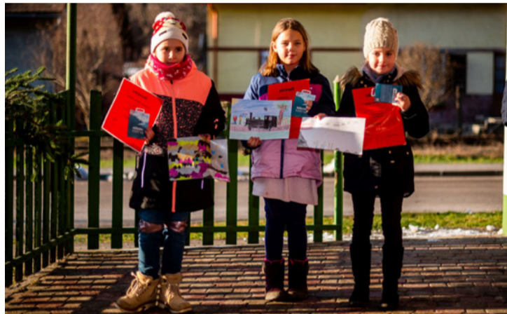
A második, a harmadik helyezett és a különdíjas (A győztes nem volt jelen a díjátadáson)