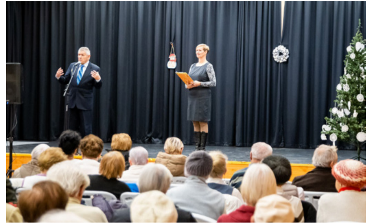
Schwartz Béla igyekezett erőt önteni a nyugdíjasokba

Karácsony a szeretet ünnepe, de nem csak azokat szeretjük, akik ott vannak velünk. Ha egyedül vagyunk, gondoljunk szeretteinkre, nézegessük legalább a fényképeiket. A közösség is segítséget hozhat. A nyugdíjas egyesületek tagsága csaknem 700 fő. Egy ekkora közösségben óriási szeretet és erő van. A polgármester mindenkinek kellemes ünnepeket kívánt.