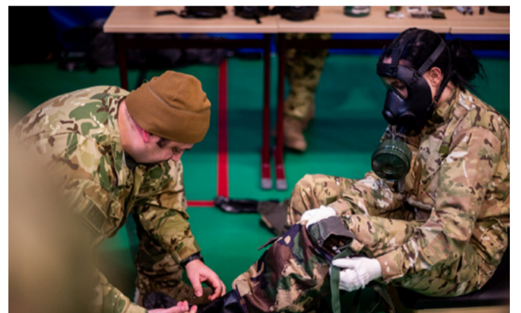
A vegyvédelmi köpeny felvétele korántsem egyszerű feladat. Legény (leány) legyen a talpán, aki fél óránál tovább kibírja benne

A harmadik állomáson egy újfajta fegyvert nézhetek meg, tanulmányozhatták an-