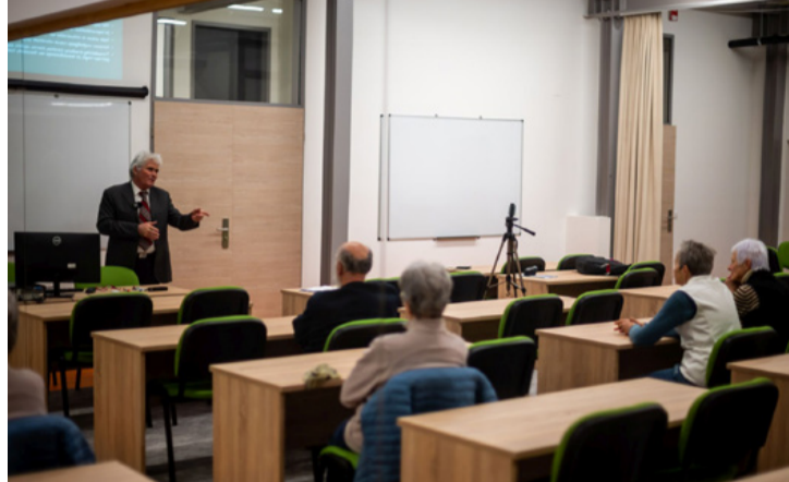
A szabadegyetem második foglalkozására a Kampusz tükrös termében került sor

■ Az újságolvasóknak is szóló szabadegyetem második foglalkozását Lékó Sándor, lapunk főszerkesztője tartotta. A központi téma ezúttal az volt, hogyan különböztessük meg egymástól az ál- és valódi híreket. Az előadás elérhető az Ajkai szó online Facebook oldalon.