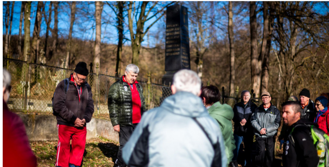
Főhajtás az emlékműnél