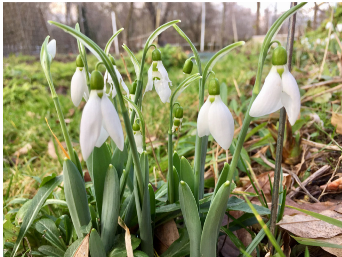
A hóvirágot ősszel kell elültetni a kertben és már télen virágozni fog