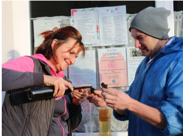
A pálinkát rendeken a disznó megperzselt körömből kínálják