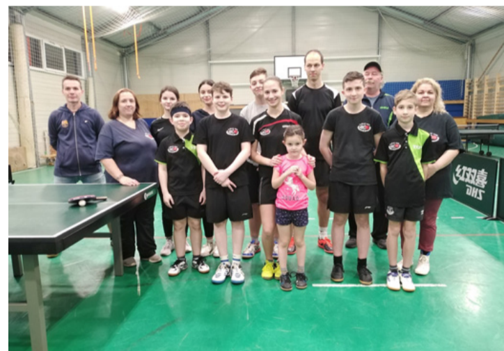
A csapat az edzőkkel