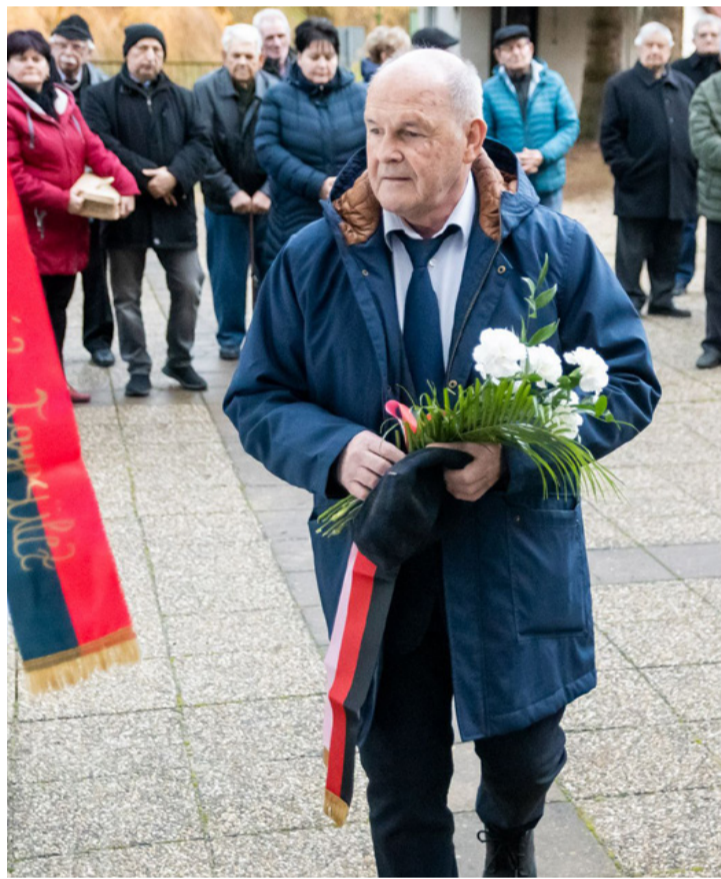
Az alpolgármester a megemlékezés virágaival