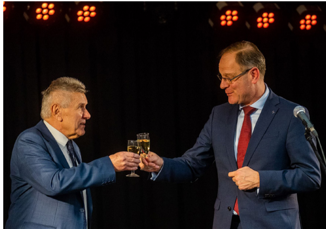
Ők ketten sokat tehetnek a városért az idén is