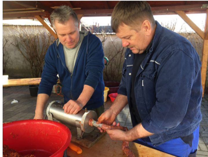
A kolbásztöltés nagy figyelmet és precizitást igénylő folyamat