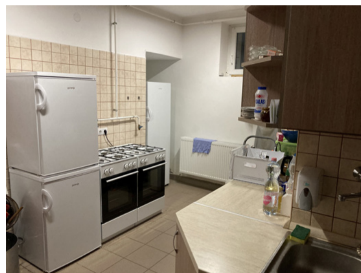
A rendeki társasági élet elengedhetetlen kelléke egy jól felszerelt konyha

szükség mert az egyik legnagyobb hagyományörző téli programunk a közösségi sváb disznóvágás, ez sok embert megmozgató eseményünk, amit mindig egy disznótorral zárunk. Így az ételek feldolgozásához és tárolásához szükségünk van ezekre az eszközökre. Nem mellesleg sok családi és munkahelyi esemény helyszíne a kultúrház, amikor jól jön a konyha felszereltsége. A régi, de még használható háztartási gépeket a családsegítő központ segítségével elajándékoztuk részurulóknak – tájékoztattott bennünket az elnökszóny.