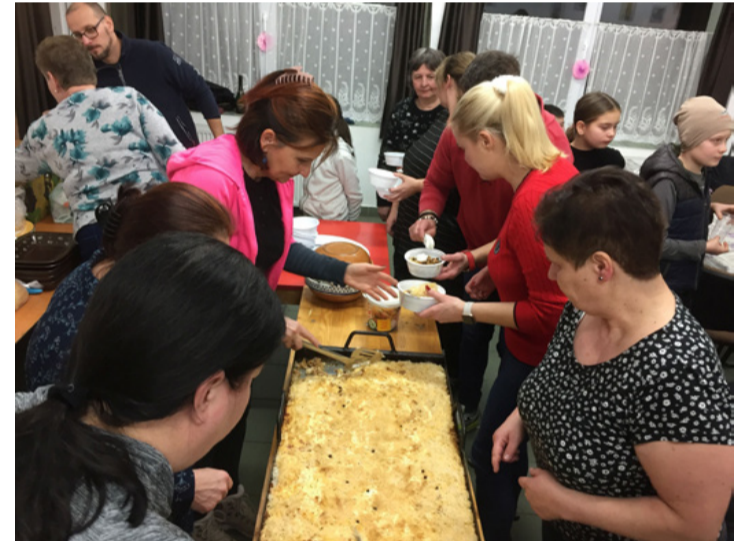
A rakott káposztának senki sem tudott ellenállni