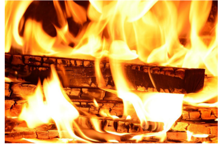
Miután kiadta melegét, tovább hasznosíthatjuk...

Az elmúlt években hazánkban nagyon elszaporodtak a sárga meztelen spanyol csigák. Ellenük is jó riasztó, ha a megvédendő növényeink köré szórjuk. A hamu szárítja a csigák nyálkás testét így elkerüljük a leszórt részt. Természetes tápanyag-utánpótlás mellett a hamu a legkiválóbb káliumos trágya. A kálium azok közé a nélkülözhetetlen tápelemek közé tartozik, amelyekből a