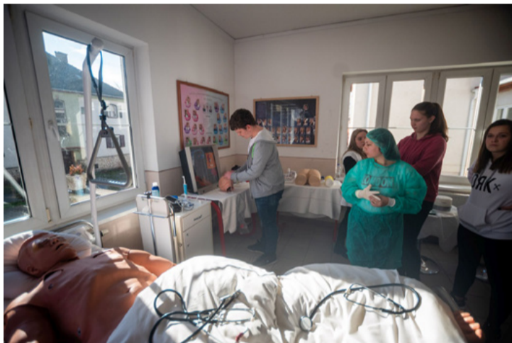
Kórházi hangulat a Szent-Györgyiben

Minden tantárgyat szaktanár oktat, az épület modern, minden korszerű eszköz rendelkezésre áll a szakmák elsajátításához. (ta) ■