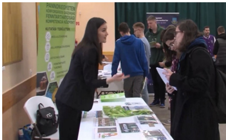
A továbbtanulás iránt érdeklődők ellepték az Ajka kampusz nagytermet

■ Első alkalommal várta a Pannon Egyetem Ajka Kampusza a nyílt napon, január 20-án, a pályaválasztás előtt álló középiskolásokat és az érdeklődőket. A nap folyamán az egyetem minden kara, egyetemi központja és a duális partnereik is bemutatták kínálatukat. A programon minden ajkai technikum és gimnázium részt vett. Az érdeklődők a képzési formák mellett a diákélettel, a diákönkormányzat által nyújtott lehetőségekkel is megismerkedhettek.