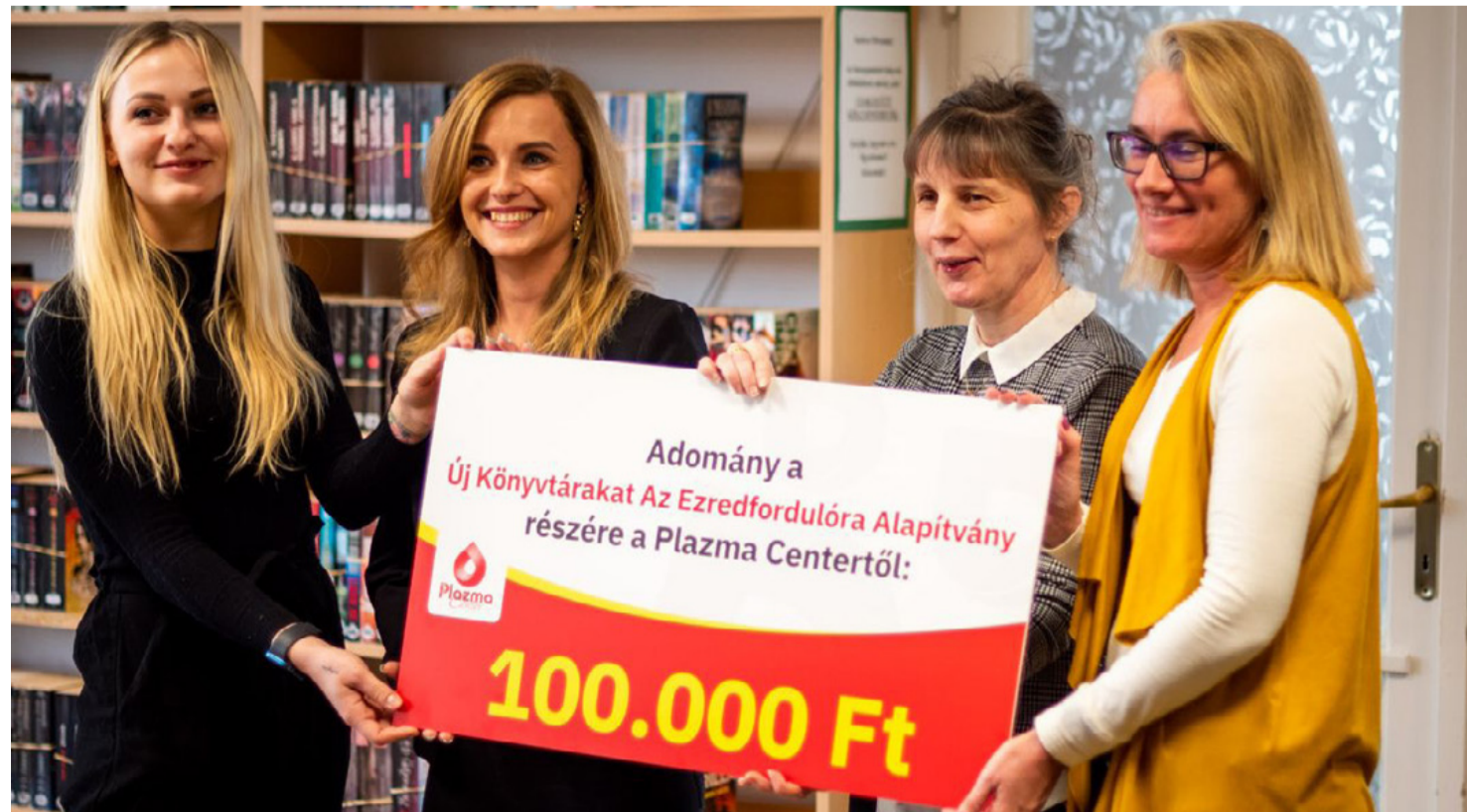
Az adományozás pillanata