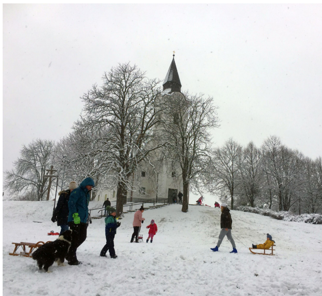
A tél idén egybeesett a Magyar Kultúra Napjával