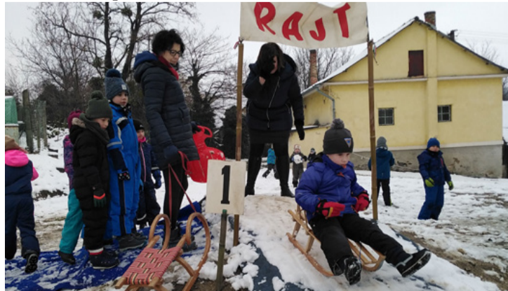
A Pataki-parti óvodások az Ilona malomnál szánkóztak