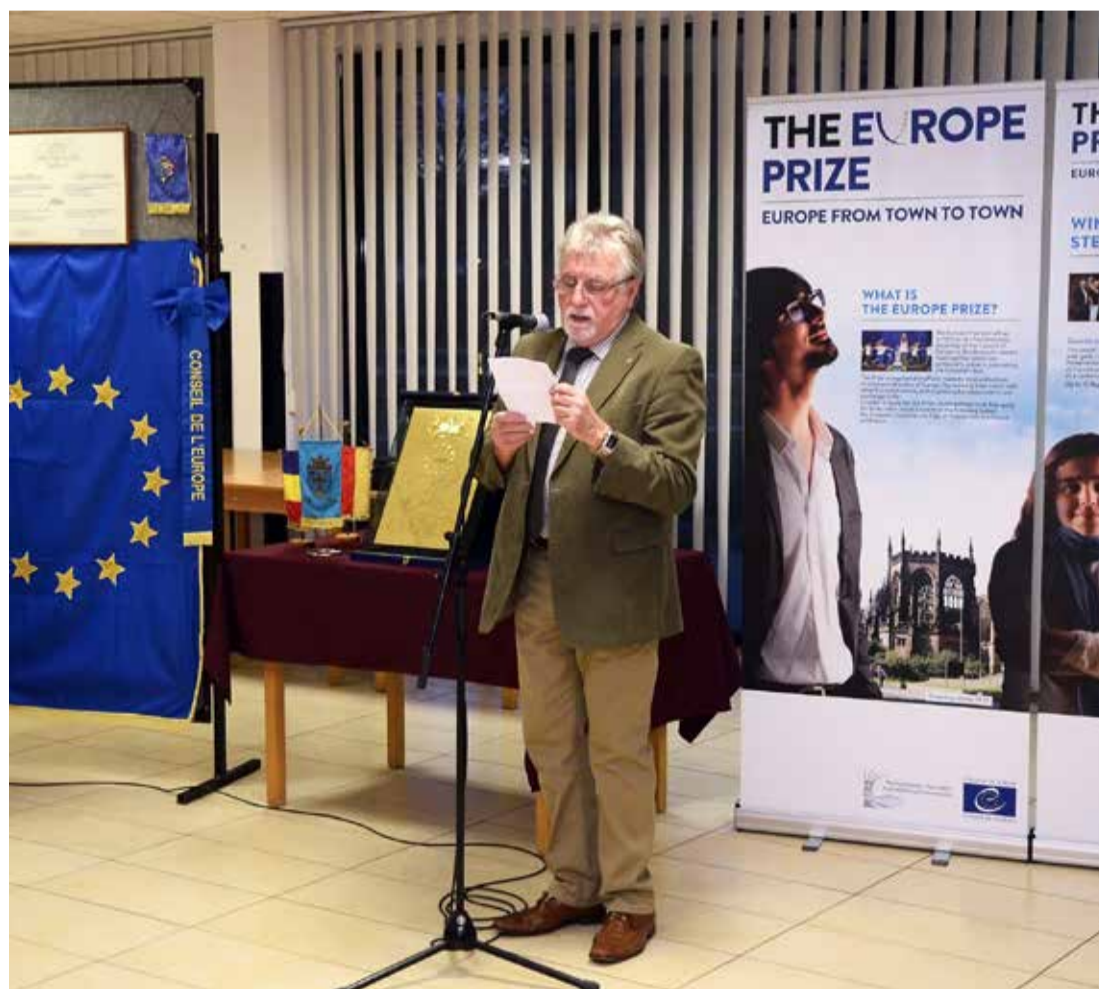
A tárlatot dr. Horváth József alpolgármester nyitotta meg

Ajka Város Önkormányzata is sokat tett már az elismerés felé vezető úton. Négy testvérvárosával (Weiz, Unna, Székelykeresztúr és Rovaniemi) jó kapcsolatot alakított ki, amit kezdetektől folyamatosan ápol, találkozókkal és csereprogramokkal színesíti. A virágzó együttműködésnek köszönhetően 2009-ben egy négylépcsős pályázaton indulva Európai Diplomát kapott az önkormányzat, 2010-ben Becsület Zászló kitüntetésben részesült, 2014-ben pe-