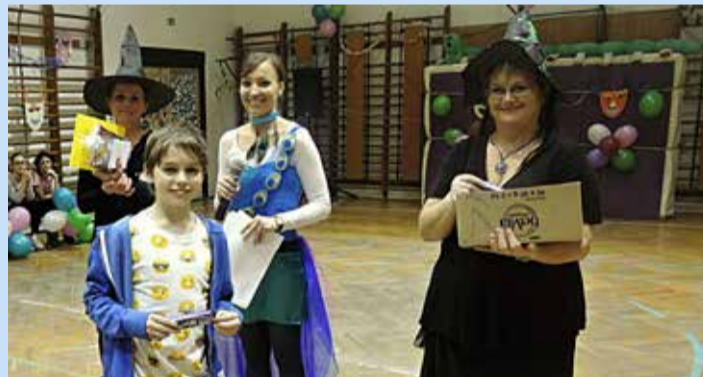
A legeredményesebb totózők csokoládé-jutalomban részesültek

Mini koncertjükkel vette kezdetét hát a mulatság táncos része, melyet meg-megszakított a szervező, Marcsi néni egy-egy eredmény-hirdetéssel. Lehetett szavazni ugyanis a legjobb jelmezre, az első három helyezett pedig díjakat és oklevelet vehetett át. Az előtér-