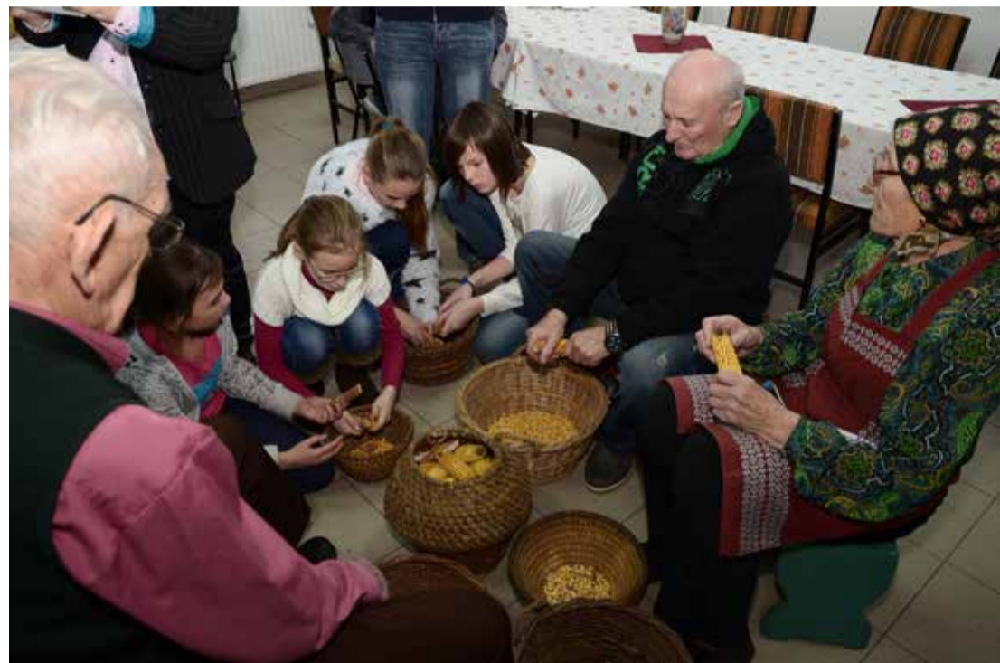
A diákok lelkesen figyelték a nyugdíjasokat