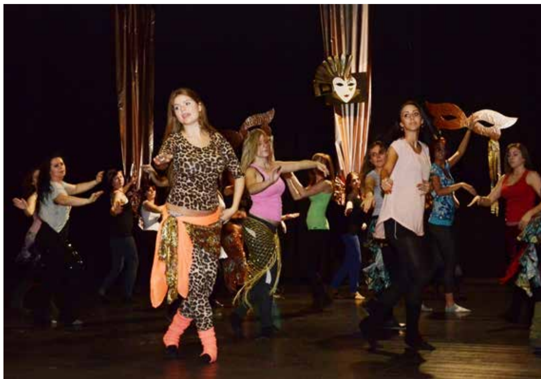
Mindenki talált olyan mozdulatot, amivel a saját produkcióját fűszerezheti