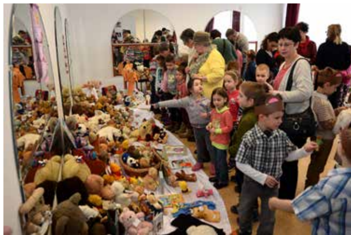
A macikiállítás mindig rengeteg érdeklődőt vonz