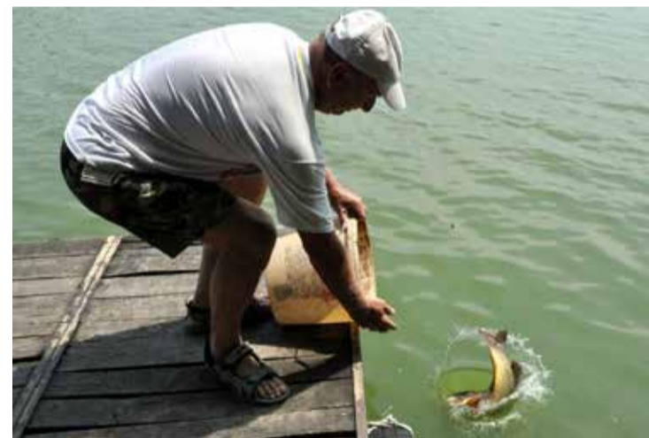
A Széki-tón nem ritka a jó fogás