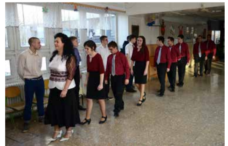
A végzősök még egyszer végigjárták az iskolát

Az iskolában, amelyben az ideai tanévben a korábbi évektől eltérően három osztály készül a szakvizsgára, február ötödikén tartották a szalagavató ünnepséget.