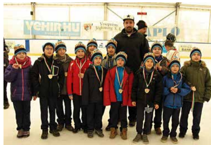
A Veszprémben remeklő U10-es csapat

A gyermek jégkorongtornán a játékon van a hangsúly, az eredményt mindenki csak magának számolja. Az Ajkai Óriások négy mérkőzése alatt a nézők kiegyenlített küzdelemnek lehettek tanúi. A Veszprém 1-es csapata ellen