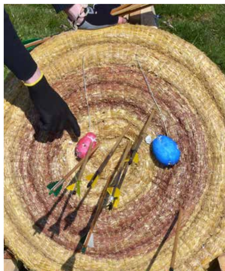
Húsvét alkalmából tojások is voltak a céltáblákon