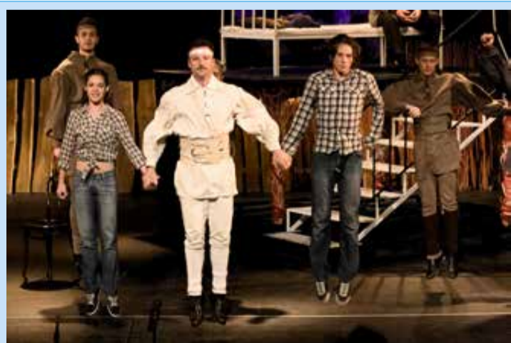
Az előadás az Ajka-Padragkút Táncgyüttesel közös produkció

Köszínházi szezonunk különös műfajú produkciójának ígérkezik Peter Shaffer: Equus című drámájának bemutatása. A mű magyar környezetben szólal meg, felerősítve üzeneteit. Fiala főhősünk médiafüggősége, családi, társadalmi példaképeket és mintákat nélkülöző magányossága, istenség-teremtő megszállottsága, majd a megvakított istenség, a ménes mindent elpusztító száguldása, nagy