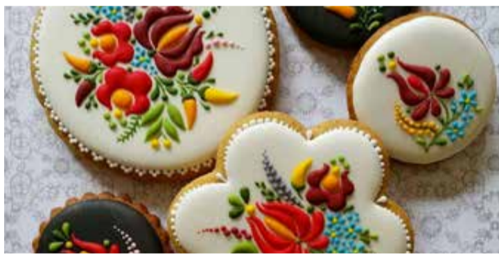
A magyaros minták nagyon népszerűek mézeskalácson is

– Ha jól tudom, az eredeti foglalkozásod porcelánfestő, de műkörmösként is dolgoztál. Hogyan lett ebből mézeskalács-művészet?