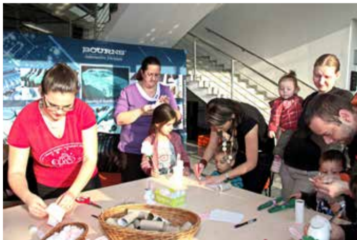
A kicsik ismerős arcokkal találkozhattak és önfeledten játszadozhattak