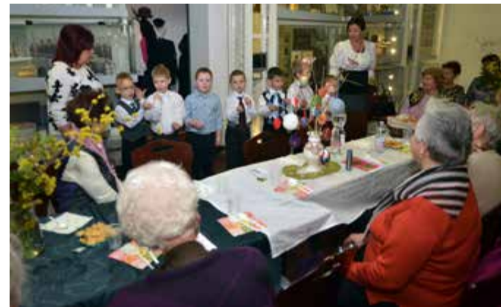
A gyerekek kedves műsorral készültek, vidámságot hoztak

lapunk kérdésére elmondta, hogy már második alkalommal szervezték meg az óvodásokkal közösen a húsvétra hangolódó összejövetelt, ahol a beszélgetésen és műsoron túl kézműves foglalkozáson vettek részt kicsik és idősek közösen.