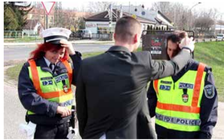
A húsvéti locsolás a rendőrlányokat is utolérte

Az alosztályvezetőtől azt is megtudtuk, hogy szerencsére évről évre csökken az ittas vezetők száma. Riportunk készítésekor az őrnagy nem tudott