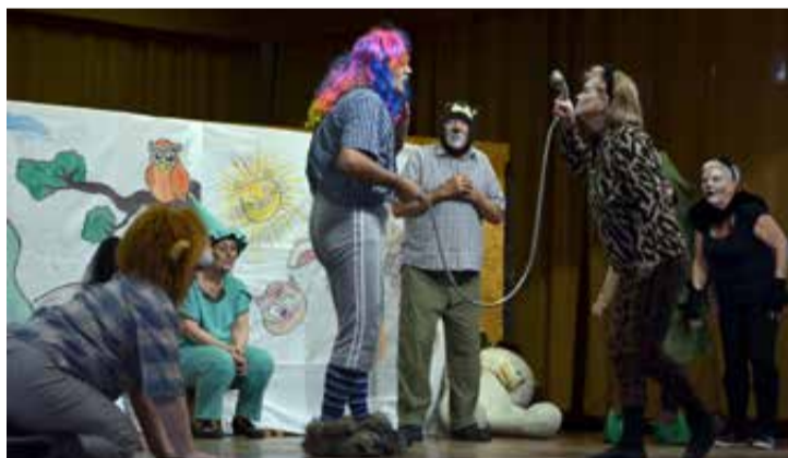
A színpadon megelevenedtek Lázár Ervin mesealakjai