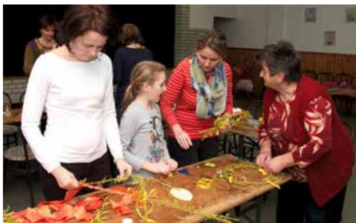
Tavaszi barkaágakat is felhasználtak az ajtó- és ablakdíszek készítéséhez

- A tojás már évek óta megvan, csak ünnepek alkalmával került elő a szekrény mélyéről. Most elérkezett az a pillanat, amikor méltón