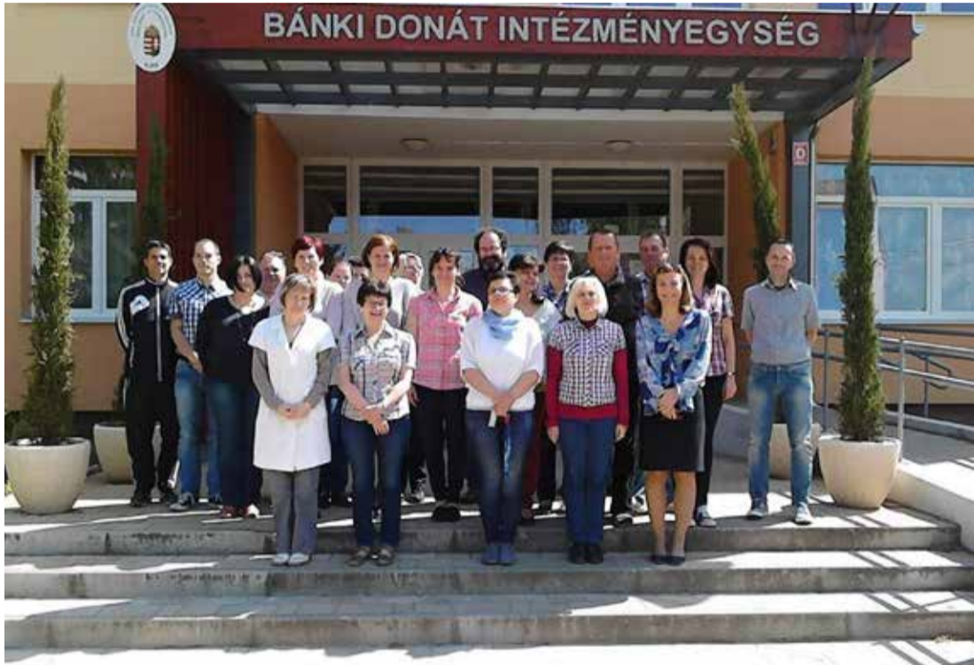
Csoportkép a Bánki sztrájkoló tanáiraíró