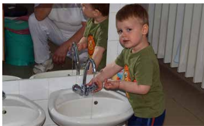
Ő már hamarosan óvodás lesz

A gyermekek többsége a nevelési év elején, szeptember 1-jétől folyamatosan kerül be az intézménybe, mivel az előző nevelési év végén, augusztus 31-ével távoznak az óvodába a háromévesek. Az üres helyek betöltése nem egyszerre történik, hanem fokozatosan, mivel egy héten csoportonként csak egy gyermeket vesznek fel. A beszoktatási időszak két hét, amikor az szülő jelenléte biztonságot ad a csöppsegeknek, és megkönnyíti az új helyzet-