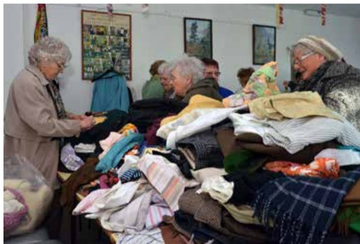
Több zsáknyi adományt kaptak a rászorulókat támogatására

bennünket. Nekik és az adományokat hozó civileknek is köszönettel tartozunk, hiszen nélkülük nem tudtunk volna másoknak segíteni. Szeretném kiemelni, hogy ezúttal mindenkitől jó állapotú, vasalt és higiénikus darabokat kaptunk, ami megkönnyítette a munkánkat, hiszen nem kellett válogatnunk, mit adhatunk tovább. A gyerekhalmik teljesen elfogytak, a megmaradt felnőtt darabokat pedig bezsákoltuk és elvittük az ajkai és a padragkúti Családok Átmeneti Otthonába. Mindkét helyen örömmel fogadták a felajánlásokat – foglalta össze a klubvezető, majd elmondta, hogy a következő ruhabörszét novemberben szeretnék megtartani. Sz.R.