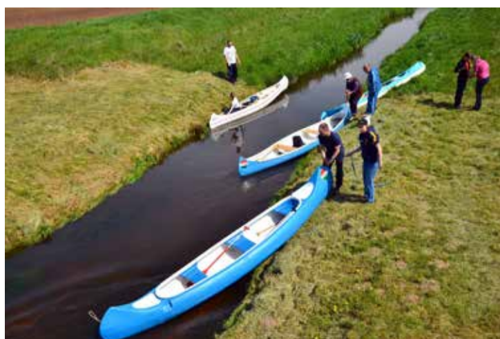
Vízre kerülnek a hajók