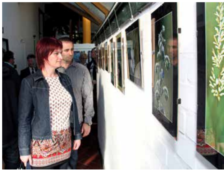
A négy évszak egymás mellett látható a kiállításon

Bár kiállítás szerepelt már Várpalotán kívül Budapesten, Tapolcán, Gyulán, Nádasdladányban, Pétfürdőn, és az ausztriai Wolfsbergben is, ez az első alkalom, hogy szülővárosában is megmutatja