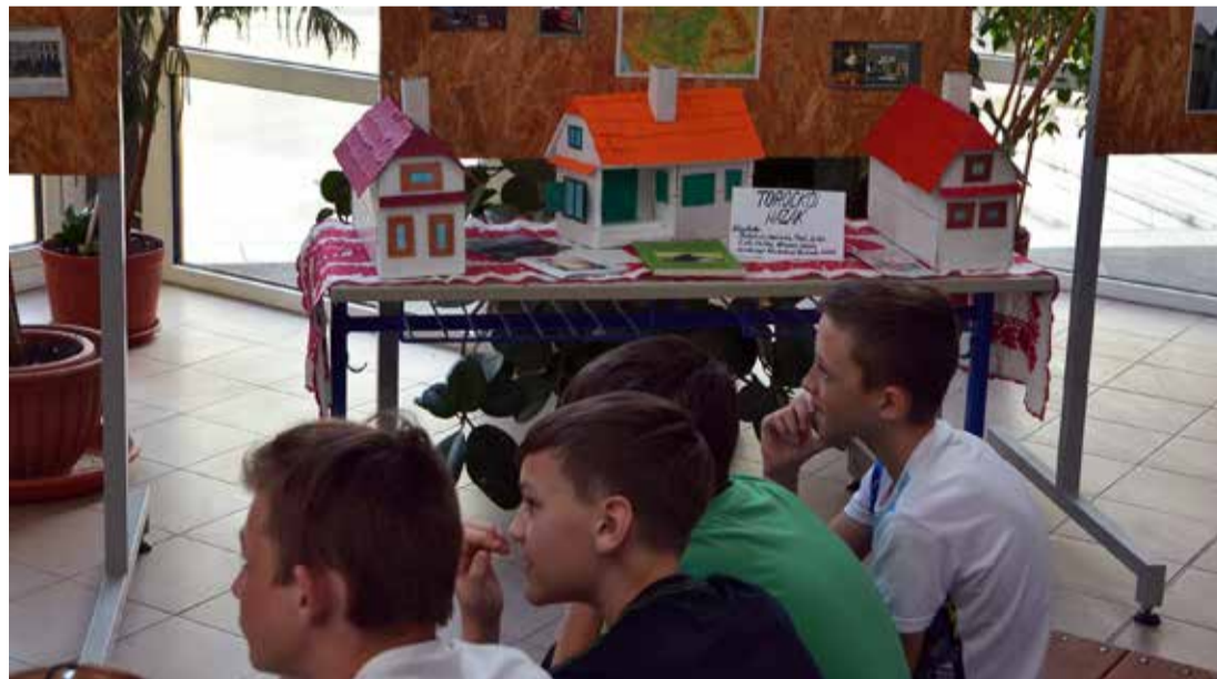
A diákok makett házakat is készítettek a bemutatónapra