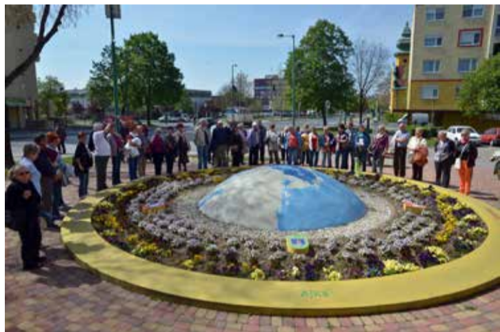
A nyugdíjas túrázók az Európa parkban