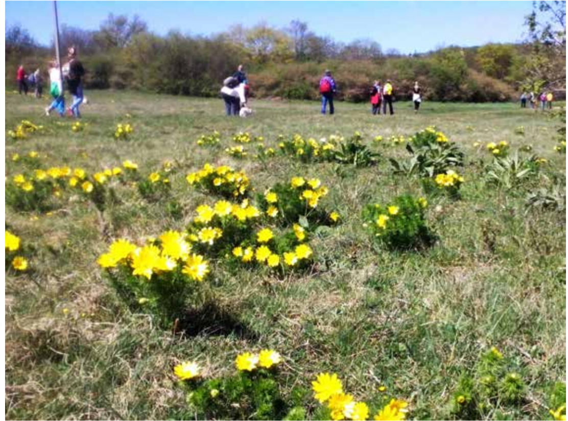
Héricszek között vezetett a túrázó útja

Vonattal érkezünk Veszprémbe. Az állomásról egyenest a Jutas vitéztől, Árpád fejedelem fiáról elnevezett kilátóhoz mentünk. A 100 farönkből megépített 6,15 méter kilátóból északra a Bakony vonulataiban, délre az Aranyos-völgyben gyönyörködtünk, háttérben a megyeszékhellyel. Majd a Séd-patak mentén haladva megtekintettük Veszprémet egy szokatlan látószögéből. A várhegy alatt érkezünk meg a Margit-romokhoz. A labirintus szökőkútnál az apróságok papírcsónakot úsz-