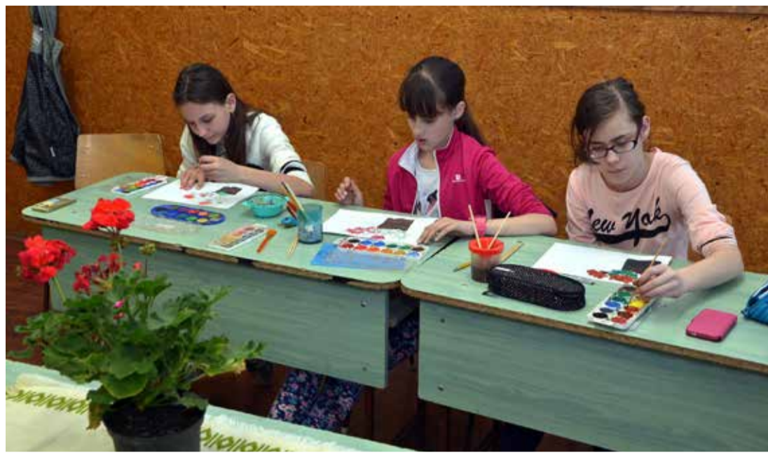
Az ötödik osztályosok vízfestéssel virágcsendéletet készítettek