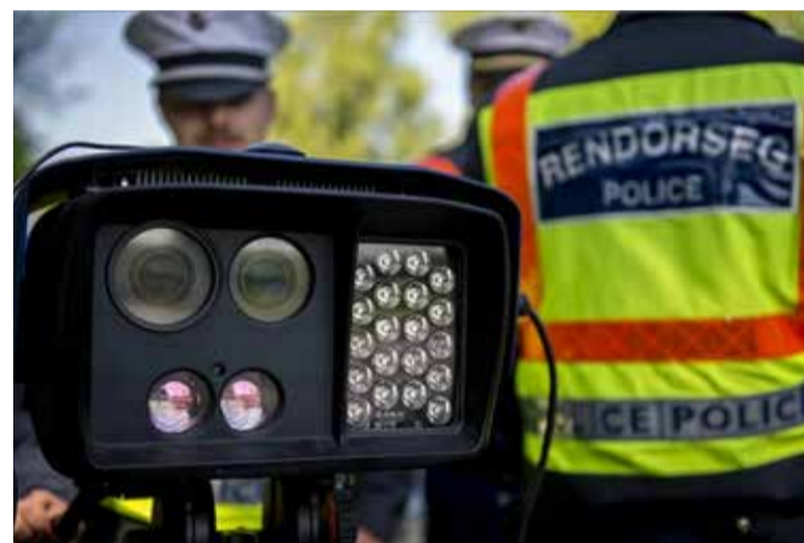
Akcióban a szupertraffipax

A rendőrök az országban összesen 3741 gyorshajtót bírságoltak meg a Speedmarathon sebességellenőrzési akció keretében – közölte az Országos Rendőr-főkapitányság (ORFK) Országos Balesetmegelőzési Bizottságának (OBB) főtitkára múlt pénteki sajtótájékoztatóján Budapes-