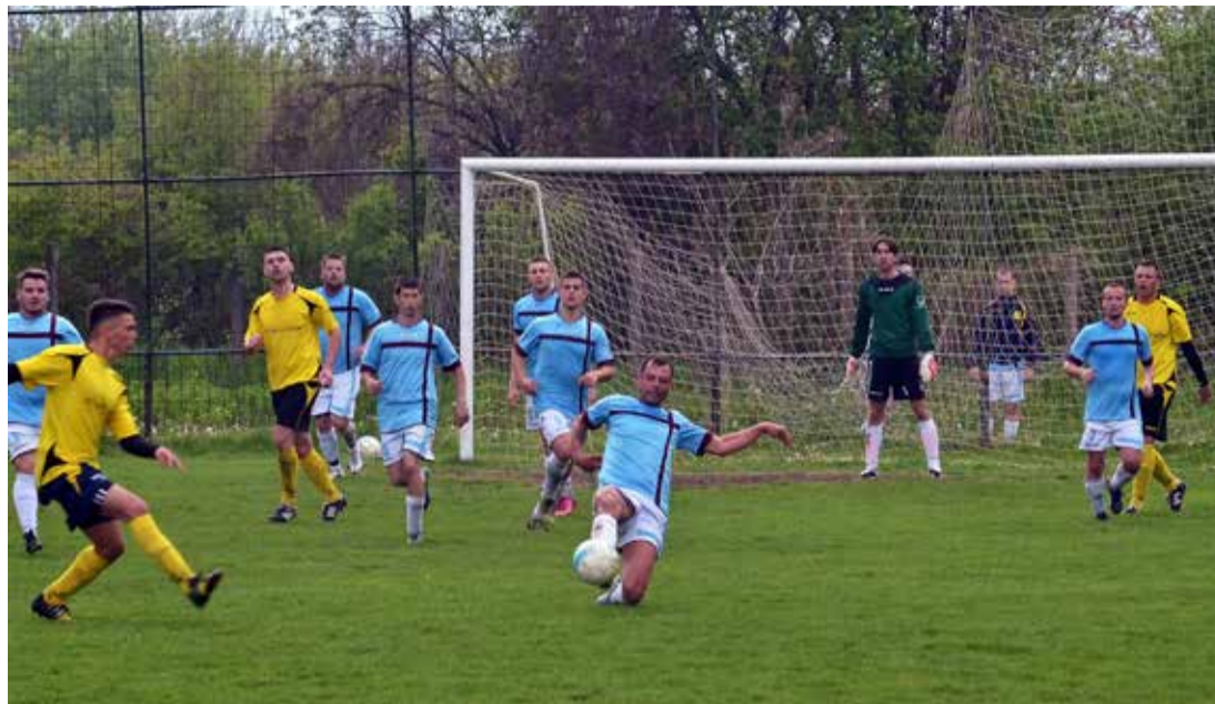
A Kristály hatásosan védekezett a Sümeg ellen