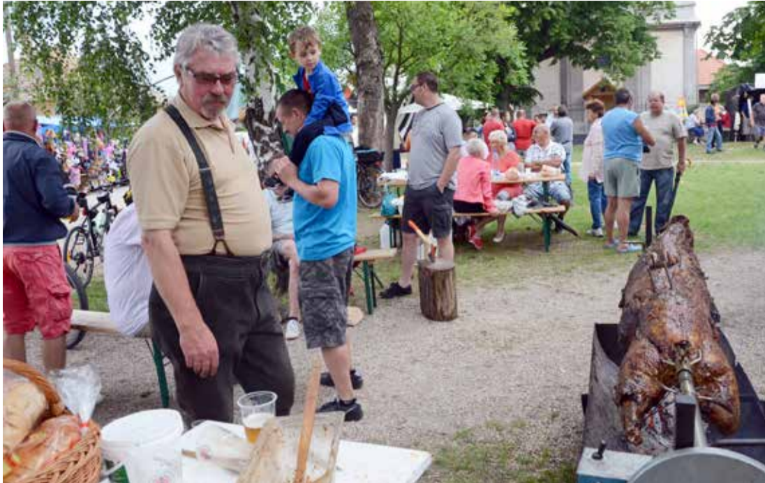
Látványosságnak is megtette a vadászok vaddisznó sütése