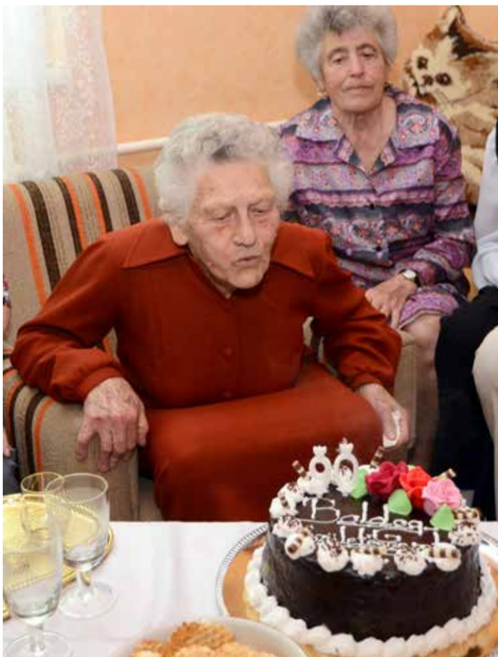
Az ünnepelt fújta el a születésnap gyertyákat