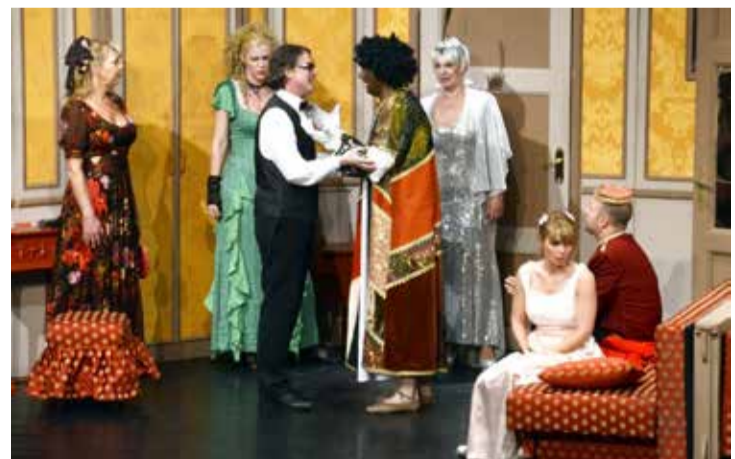
A színészek minden mozdulata és pillantása nevetésre ingerelte a nézőket

A közönség az előadás előrehaladtával egyre inkább fellelkesült és beleélté magát az olaszos háttértörténetbe, a színészek minden mozdulata és pillantása