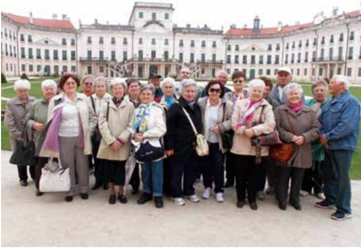
Csoportkép a fertői kastély udvarán