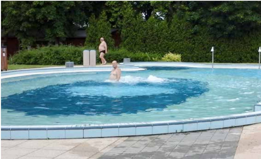
Még nem volt igazi strandidő, a nyitás napján bőven akadt hely a medencékben

De jó, erre a pillanatra vártam karácsony óta, kiállt a Viola, miután a csúszdáról belecobbant a vízbe. Az iskolás lány testvérével és barátaival érkezett a strandra a nyitás napján, június negyedikén délelőtt. A többiek is lecsúsztak, megvárták egymást, majd futottak vissza a következő körre.