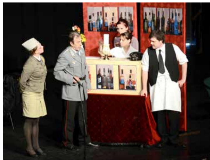
Kettős veszélyt jelentett a Gestapo és a feleség

A terem több mint egyharmada telt meg az ingyenes előadásra, ami nem tekinthető rossz aránynak, mert például a legutóbbi Dumaszínházra jóval kevesebben látogattak el. A társulat elsősorban a rokonok, barátok, ismerősök, kollégák vagy egykori pedagógusok voltak kíváncsiak, ezért a Táltosok részben hozzájuk igazították az előadás menetét, idejét. A színészek már a darab kezdete előtt kiemelték, hogy rekordhosszú, több felvonásos produkcióval készültek, amit korábban