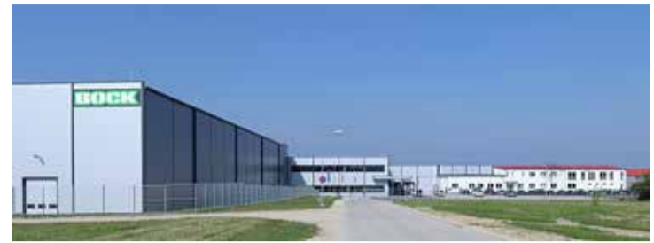
Impozáns látványt nyújt a kibővített telephely

– A Bock cégcsoport az iroda és bútortermelési piacon irodaszékek alkatrészeinek gyártásával, összeszereléssel és fröccsöntő szerszámok gyártásával, eladással mutatkozott be. Ezt a fő irányvonalat kívánjuk a jövőben is továbbvinni technológiai fejlesztésekkel, több géppel és automatizálással. – Világszerte több vállalkozást