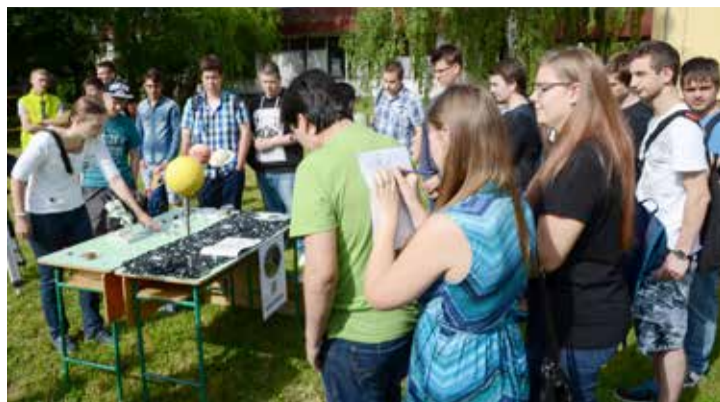
Sok érdeklődőt vonzott az úrkúti csillagászok bemutatója

Május 30. és június 2. között tartalmas programokban volt részük az Ajakai Szakképző Iskola és Kollégium Bánki Donát Intézményében tanulóknak. A Hobbi hét nevet adták annak a programjuknak, ahol szemléltették, hogy milyen pihentető, kikapcsolódó tevékenységet folytathatnak szabadidejükben a diákok. Bemutatták, hogyan valósítják meg személyes céljaikat, vágyaikat, az önmegvalósítás melyik formáját választják.