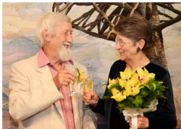
Az örökifjú pár

A szertartás alatt minden a megbecsülésről, az egymás iránti tiszteletéről, a hűségről szólt. Életük főbb állomásait felsorolta az anyakönyvvezető, amihez mindenki hozzá-