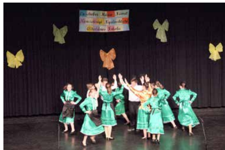
Második és harmadik osztályosok sváb tánca