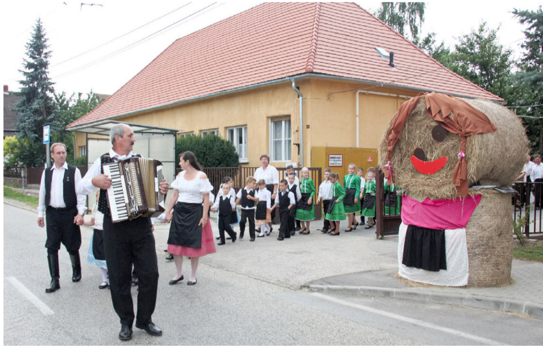
Harmonikaszóra vonultak fel az ifjú táncosok