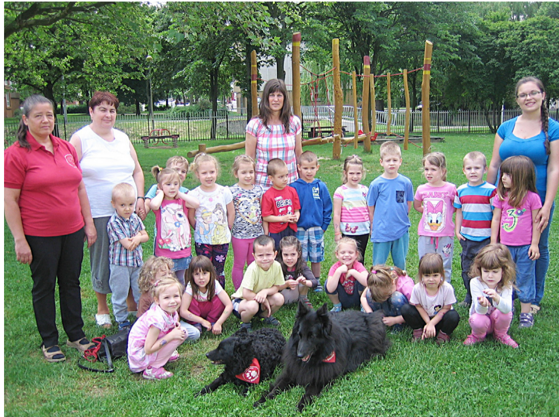
Évzáró csoportkép kutyákkal és Mazsolákkal