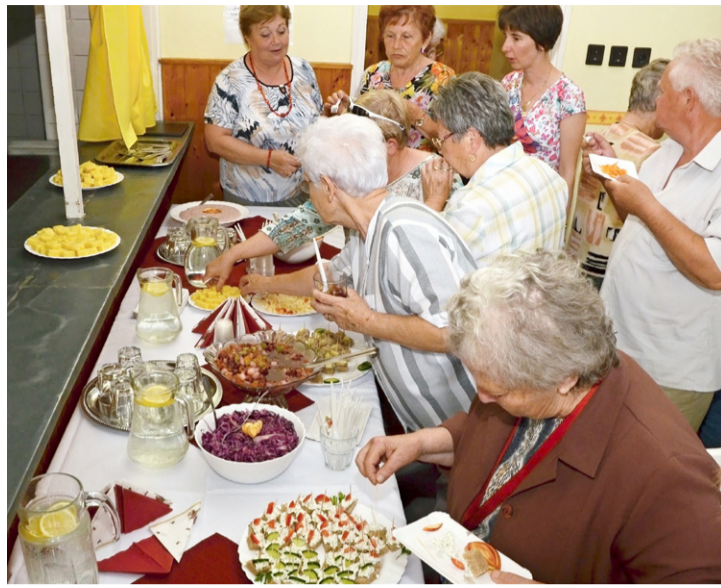
A tájékoztatót követően rostban dús, tejtermékekben gazdag hideg ételeket lehetett kóstolni