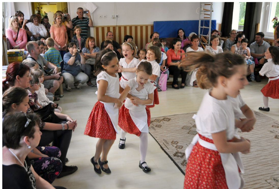
Színes program keretében mutatták be a táborozók, hogy mit tanultak