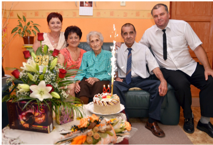
Gyertyagyújtás családi körben