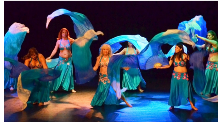
Az orientális táncok egyre népszerűbbek városunkban is