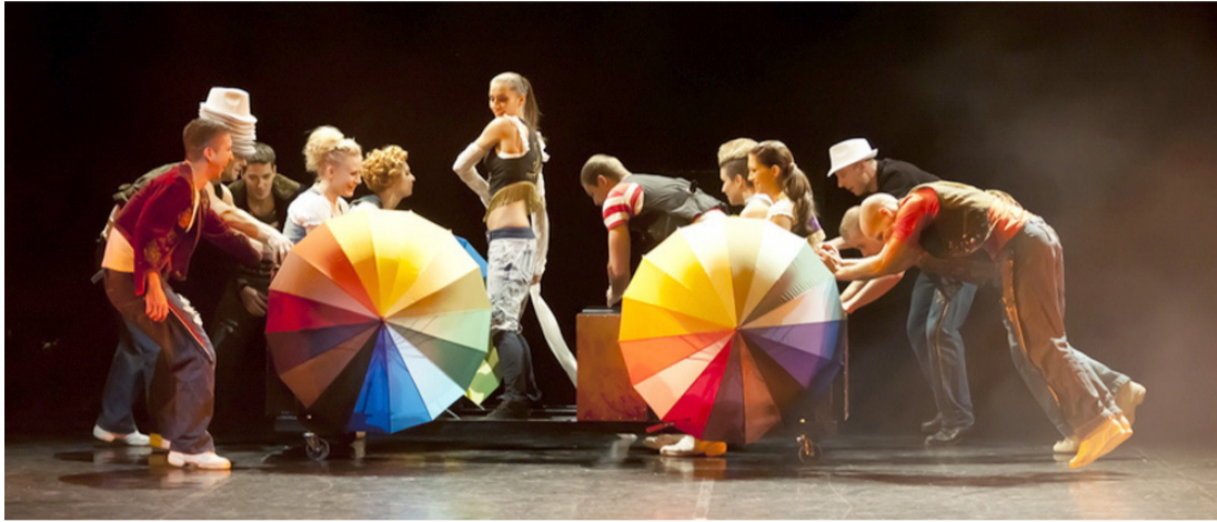
Látványos jelenetekben bővelkedik a táncshow