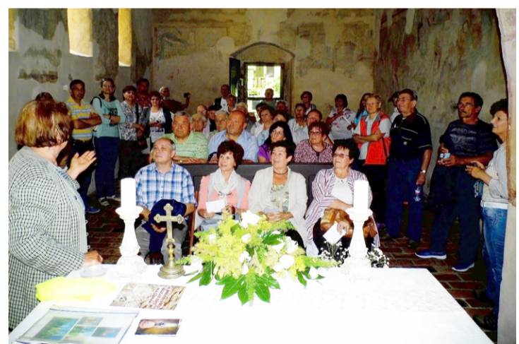
Csoportunk a veleméri templomban

fővárosában, megtekintettük az 1230 körül épült román stílusú templomerődöt. A templom falán bibliai idézeteket olvashattunk a XVII. századból, amelyek az asszonyemberre is utalnak. A templomkertben az egykori sáncárok nyomait láttuk.