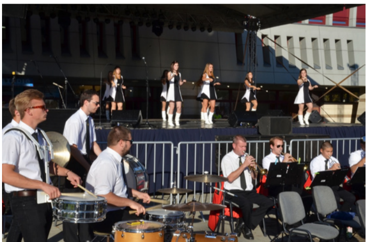
A Bányász Fúvós Zenekar és Mazsorett Csoport nélkül nincsen ajkai rendezvény

Este a Fonogram díjas Firkin együttes lépett színpadra. Pillanatok alatt robbantották az energiabombát. Ír kocsmazenével és autentikus dallamokkal próbálták elvarázsolni a jelenlévőket. Színvonalas produkciójuk igazi öröme volt, de néhány helyi ponton és a gyerekeken kívül a többséget nem sikerült megmozgatniuk. A vibráló energiára és a generált szabadságérzésre az ajkaiak valahogy nem tud-