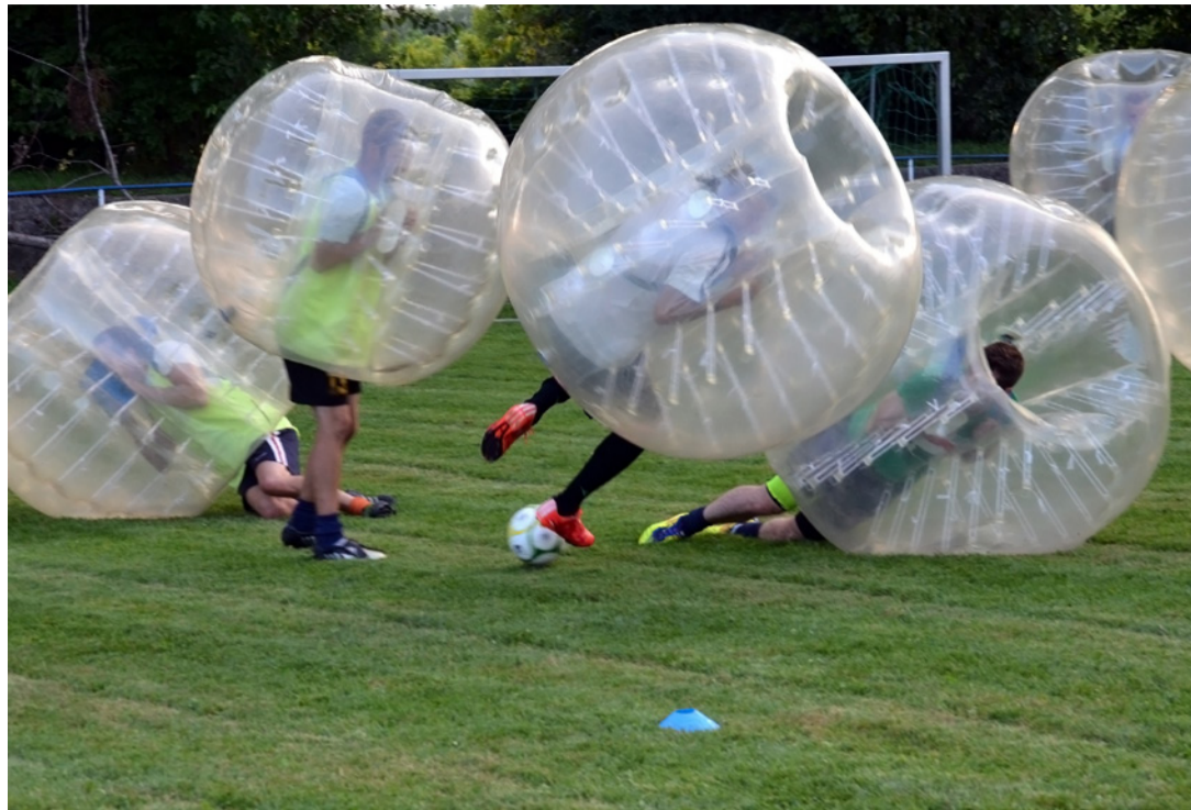
Buborékfocival edzetek a Kristály játékosai