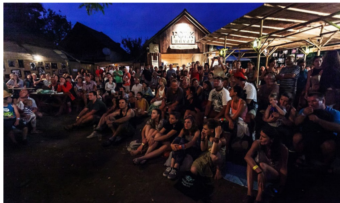
A kapolcsi Folk Udvar közönsége

A Völgyben idén három színházi helyszín nyílt, a Nemzeti Szín-Téren olyan előadások mentek teltházzal, mint Shakespeare Rómeó és Júliája, Weöres Sándor Psychéje, a Fodrászno Medvegyevtől vagy a Csehov Egyfelvonásos komédiák. Délutánonként Vidnyánszky Attila színész tréningeket is tartott az érdeklődőknek. A Színház- és Filmművészeti Egyetem hallgatói is beköltöztek, az előadásaikkal mellett udvarukban drámafoglalkozásokat tartottak kicsiknek és nagyoknak. A Színház Színpadon teltházzal mentek a Forte Társulat, a Tünet Együttes, a Nézőművészeti Kft., a Maladype Színház, az Orlai Produkciós Iroda előadásai, Mácsai Pál az Azt meséld el, Pista! darabbal érkezett.