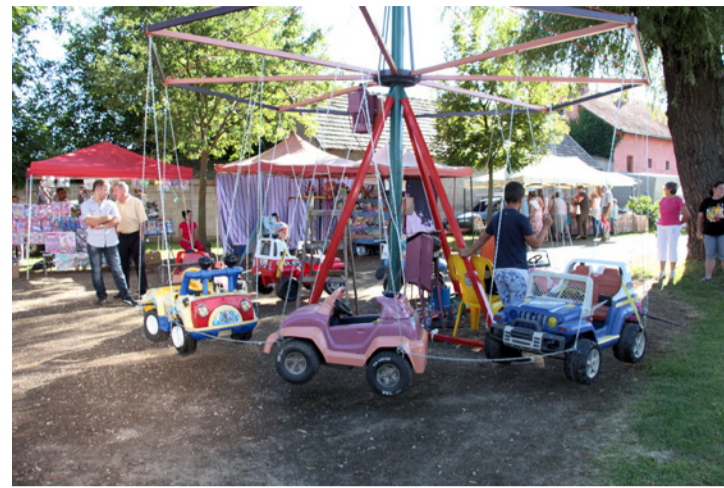
A búcsú elmaradhatatlan hozzávalója a körhinta