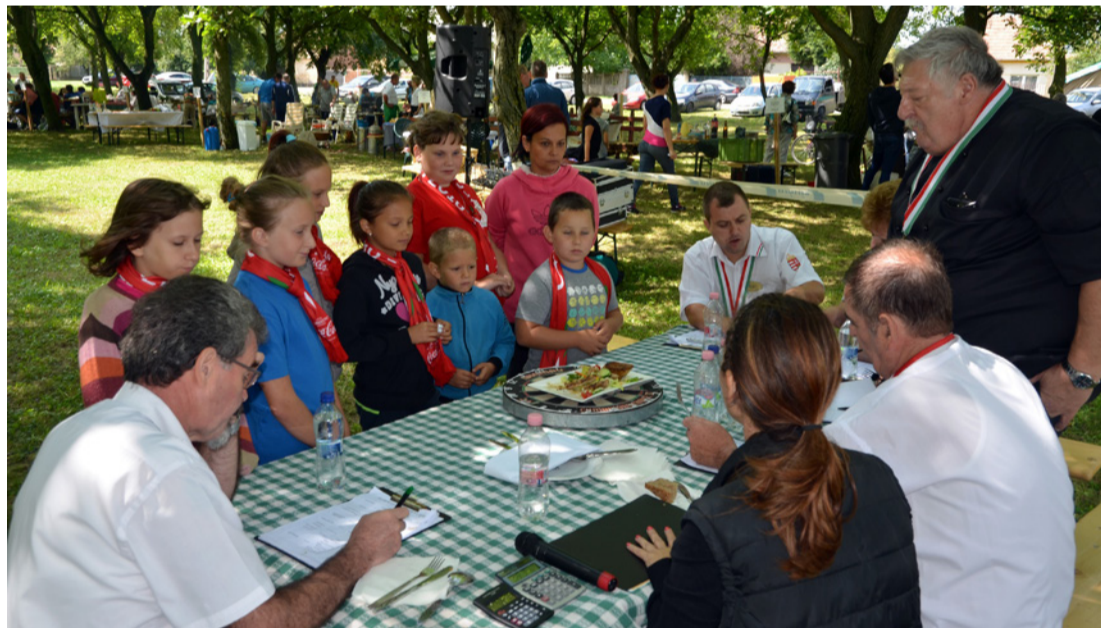
A Kids Főnix ifjainak produkcióját értékeli a zsűri