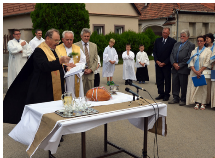
Az új kenyér megáldása