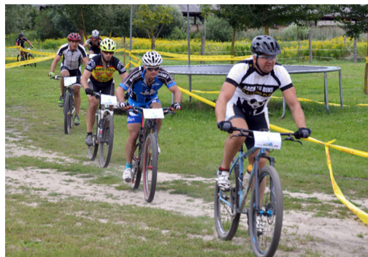
Tíz órán át tekertek a pályán

A tíz órás örületre – ahol minél több kör megtétele volt a cél – közel nyolcvan vállalkoztak, az ajkaikon kívül Sopronból, Gödöllőről,