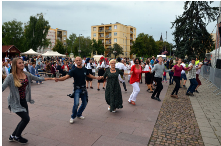
Gyerekek és felnőttek a táncosokkal együtt kacskaringóztak a téren