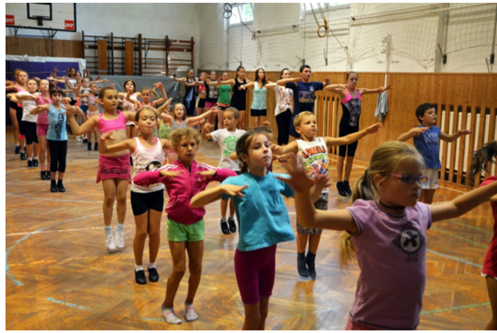
A táborozók öt napon át gyakoroltak