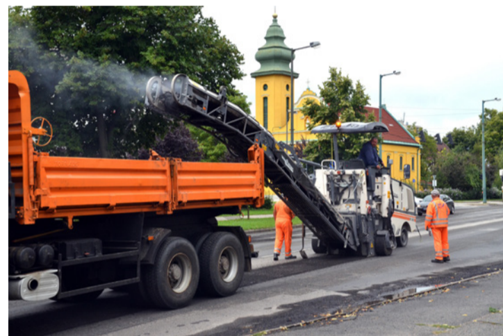
Komoly géppark dolgozik az útfelújításokon

A második szakasz, a lámpás csomóponttól a hotel irányába haladva, a település úthálózatának egyik legfontosabb része. A felújítás fő célja az ütesztika növelésén túl a burkolat állapota és a vízelvezetési hiányosságok megszüntetése. Ezen a szakaszon az út szegélyeinek cseréltetése mellett a szükséges vízelvezető rendszer átépítését is az önkormányzat finanszírozza. A Magyar Közút Zrt. munkatársai a teljes szakaszon, a szükséges előkészítő munkálatok után, melegen hengerelt aszfaltbeton kopóréteggel kiépít-