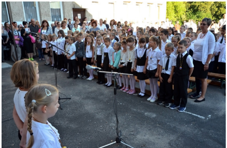
A Borsosban is az elsősök számára volt a legizgalmasabb élmény a tanévnyitó

Az első tanítási nap reggelén tartotta a tanévnyitó ünnepséget a Borsos általános iskola, először az Eötvös, majd az egykori Kosuth épületében. Ódor Erzsébet igazgató köszöntőjében üdvözölte az újként érkezett diákokat, pedagógusokat. Elmondta, hogy a most kezdődő tanévben a tanórákon kívüli foglalkozások, vidám diákélet vár mindenkit. Januárban emlékeznek a Kultúra napjára és Borsos Miklósról, az intézmény névadójára. Ismét lesznek témahetek, tavasszal