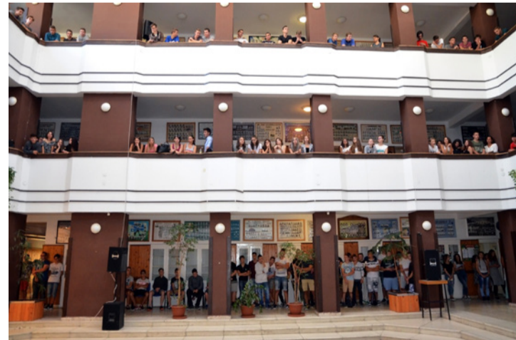
A tanévnyitóra benépesült a Bánki aulája is

Az iskola Fürst Sándor utcai épületében is 8 órakor kezdődött az első nap, osztályfőnöki órával. 9 órakor pedig itt is felcsendült a Himnusz. Rendezett sorban vonultak a diákok az iskola udvarára. Idén 491 diák kezdte meg, illetve folytatja tanulmányait ebben az intézményben. Ebből 102 fő 5. osztályos és 155 gimnazista. Az iskola udvarán az ünnepi műsort a 6. E osztályos tanulók nyitották meg, verseikkel elbűcsúztatták a nyarat majd vidám műsorukkal köszöntötték az új