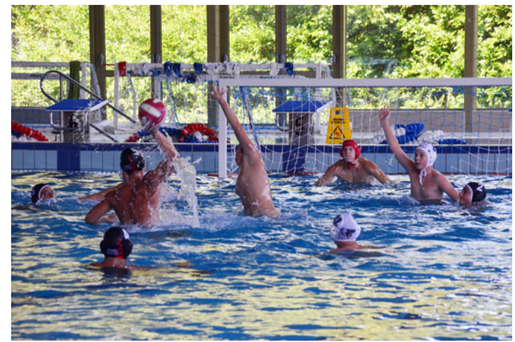
A Cápák óriási csatákat vívtak ellenfeleikkel

– A vízilabda egy meglehetősen komplex sportág, évek munkáját kell beletenni, hogy gyümölcsöző lehessen. Nem mellelesleg csapatsport, ahol az egyéneknek össze kell dolgozniuk a kitűzött cél eléréséhez. Ez pedig észrevétlenül neveli a gyereket.