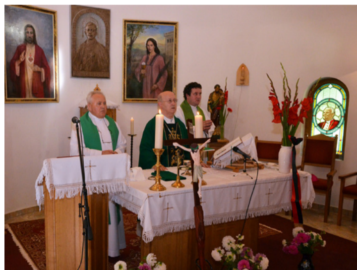
Márfi Gyula érsek mondott szentbeszédet az évfordulón tartott misén

Márfi Gyula érsek a megszentelést követően arról szölt, hogy az igazi hívó ember egész életét átszövi Isten szeretete. Bajban, bánatban, betegségben is kell hinnünk. Az idők folyamán sok minden változik, divatok jönnek-mennek, az igazi emberi értékek viszont állandóak. Azokhoz kell igazodnunk. Sokan mondják, nem léphetünk kétszer ugyanabba a folyóba. A víz folyik,