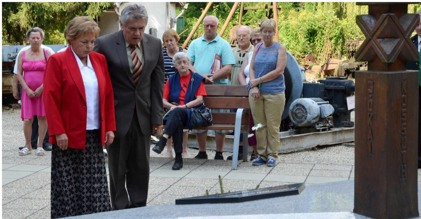
Főhajtás a munka közben életüket veszített bányászok emlékművénél