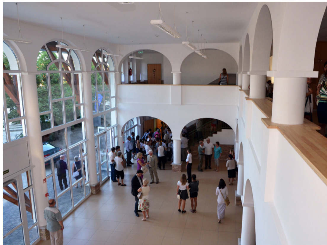
A tósokberéni tanérvnyító főszereplője a megújult iskolaépület volt