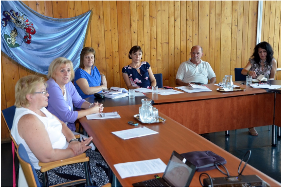
Egytértettek abban, hogy az első lépés a közös gondolkodás