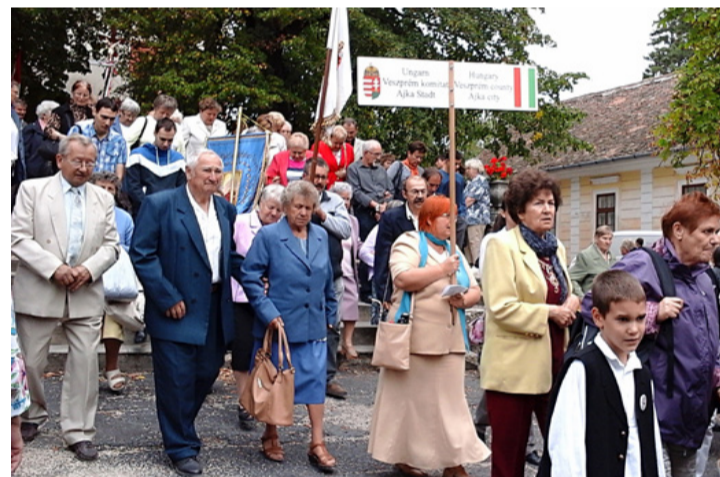
Ajkaikarandók a körmenetben