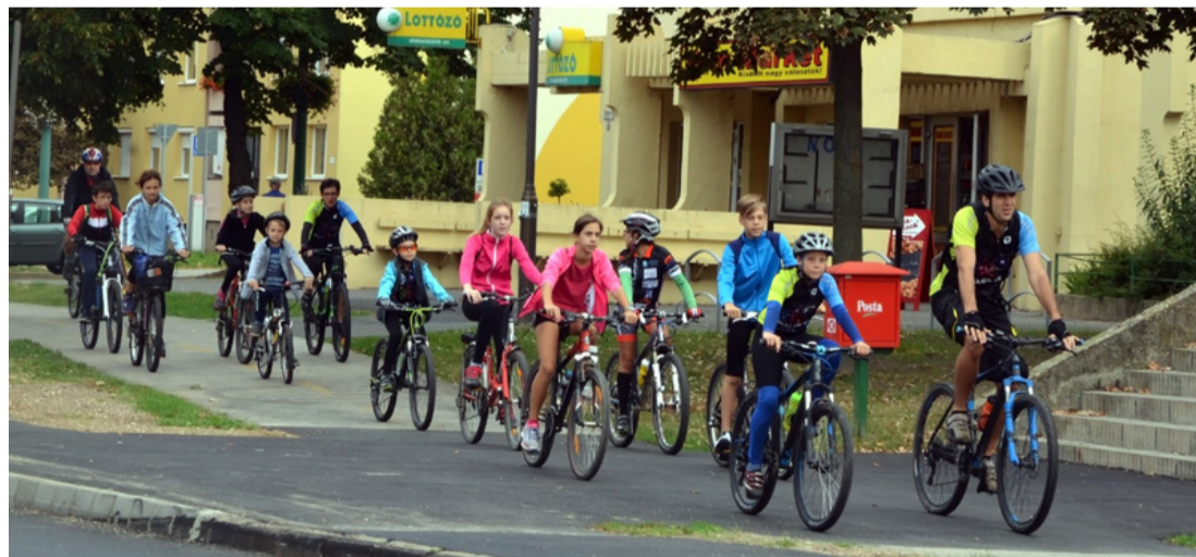
Családostól kerekettek a sportolni vágyók