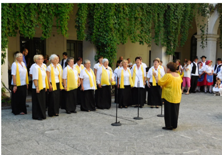
A Szent Cecília kórus egyik fellépése Bécsben

A kórusvezető elmondta, hogy lelket megérintő élményben volt részük. Színes, díszes, magyaros ruhákban, kenyérrrel, gyümölcsökkel megrakott kosarakkal, zászlókkal, tájegységet jelző táblákkal, csengő magyar ének szóval vonult be több ezer büszke magyar mosolyogva, a meghatottságtól könnyekkel küszködve a templomba. Volt szerencsésük látni