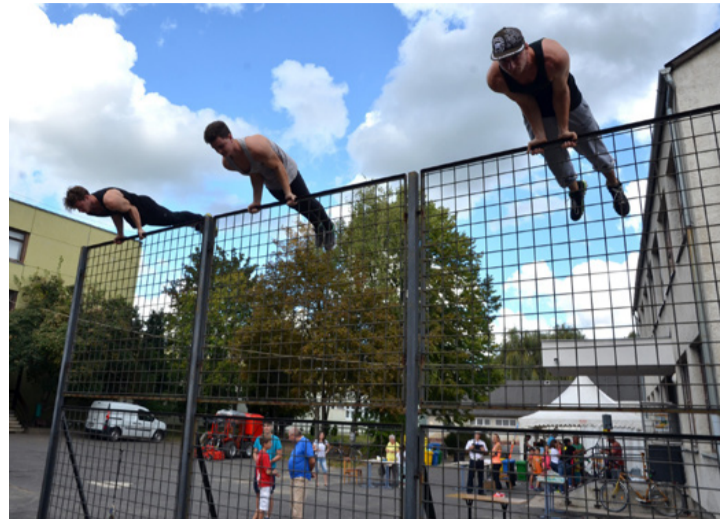
Sok mindentől lehet spoerteszköz, ha ötletesen használják

Színes programkínálattal várta az érdeklődőket a Fitt Ajka elnevezésű rendezvény szombaton a Nagy László Városi Könyvtár és Szabadidő Központ József Attila utcai épületében. Kipróbálható sportokból nem volt hiány, mégis viszonylag kevesen látogattak el az Európai Mobilitási Hét keretében szervezett napra. Talán a reggeli eső ijesztette el a családokat.