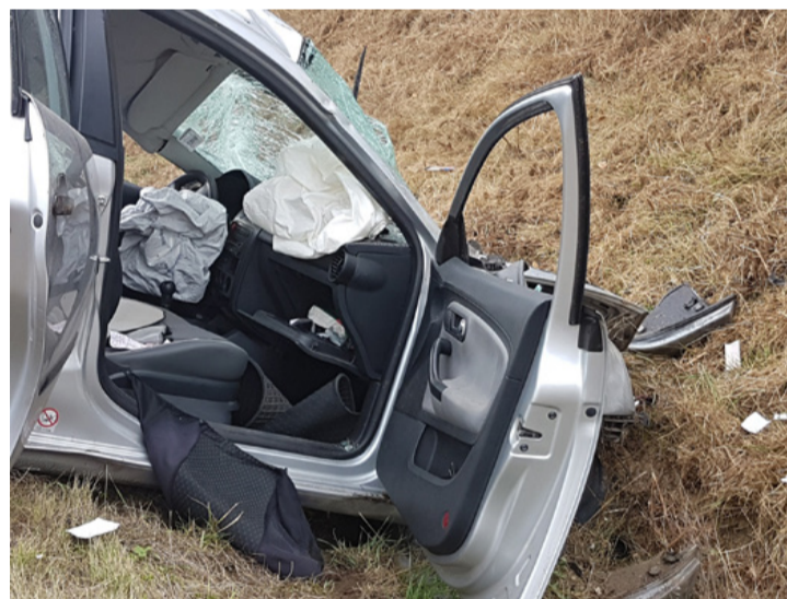
Ajkáról indult, a nyolcason Kislőd mellett az árokban ért véget egy autós ámokfutás. További információk és képek az ajkaiszo.hu honlapon!