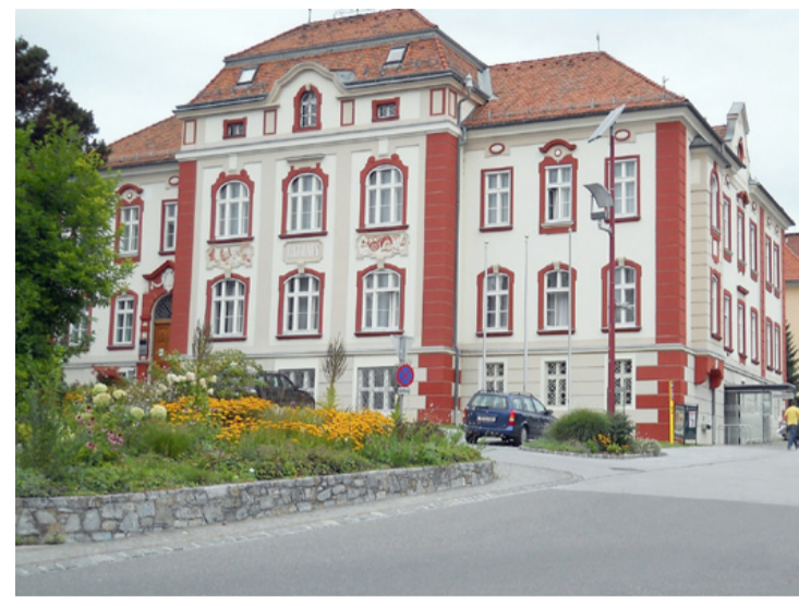
A weizi városháza épülete szép, de a város „kinötte”

A magyar delegáció mindent megtapasztalta a többszöri városnézés során. Meglátogatták még a Művészetek házát (Kunsthhaus), a környéki templomokat és a várost keresztüljelző folyót is, ami sosem