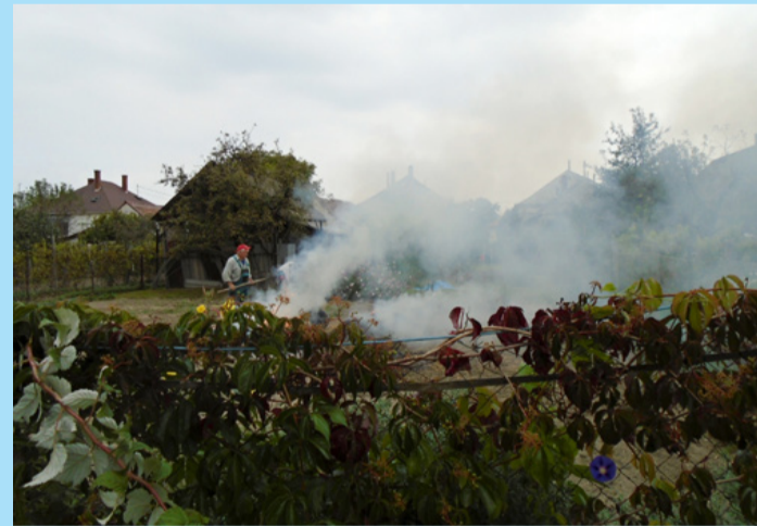
A füst beterítette a környéket, mivel szélcsend volt és pára

Sokszor úgy érzem, hoznak rendeleteket, törvényeket, amit az emberek jó része teljesen figyelmen kívül hagy. Ilyen az avarégetés és az állatvédelmi törvény is. Meglátásom szerint csak egy-két alkalommal kellene a közterület-felügyelet embereinek bejárni a kiskertes városrészeket és talán változna a helyzet. Legjobb megoldás az égetés teljes betiltása volna, amit nagyon sok városban alkalmaznak.