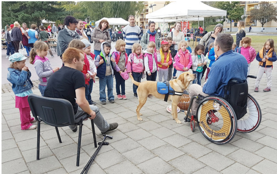
Minden feladatot úgy találtak ki, hogy az épek beleélhessék magukat a sérült emberek világába

Menne a kerekés székes közlekedés és fel mernéd vállalni, hogy bizonyos tényezők korlátot jelentenek? Mit tennél, ha egy rosszul sikerült fejes után lebénulnál? Na és ha roma lennél, ezért nem kapnál munkát, vagy a saját nemedhez vonzódnál, esetleg utcára kerülnél? Adnának neked mások esélyt? – többek között ilyen tabu kérdésekre kaphattak választ az Agórára látogatók, ahol a város önkormányzata és a Molnár Gábor Műhely Alapítvány Esélyegyenlőségi Napot szervezett, hogy közelebb hozza egymáshoz a sérülteket és az épeket.