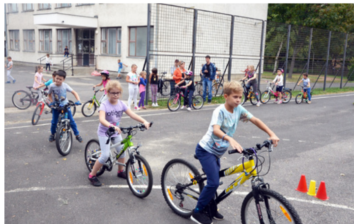
Mielőtt két kerékre pattantak a gyerekek, kerékpáros közlekedési oktatásban részesültek

Ajka Város Önkormányzata, a helyi rendőrkapitánysággal és az iskolákkal együttműködve a szabályos kerékpáros közlekedésre és a megfelelően felkészített drótszamarak fontosságára,