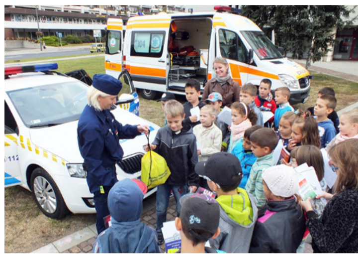
A legjobbak ajándékcsoomagot is kaptak a Kresz Fesztven

Azok az önkormányzatok, amelyek sikeresen pályáztak az Európai Mobilitási Hét helyi programjaiban való részvételre támogatásban részesültek. Így 182 hazai település csatlakozott az eseménysorozathoz. A tizenötödik alkalommal meghirdetett rendezvény célja az volt, hogy felhívja a városlakók figyelmét a megnövekedett autóforgalom okozta környezeti, baleseti és városképi problémákra, a környezet- és emberbarát városi közlekedés előnyeire, a közösségi, a kerékpáros és a gyalogos közlekedés változataira és rávegye a városlakókat a mozgásra.