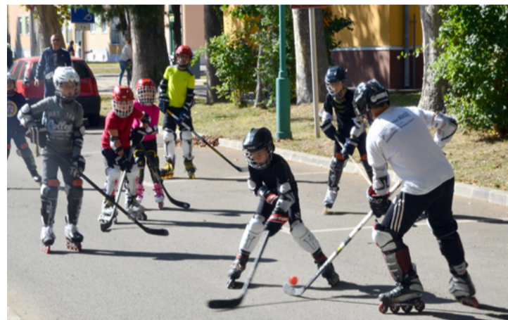
Az Ajkai Óriások görkorcsolyával gurultak az akadályok között, hokis felszerelésben

Az intézmény előtti Kossuth parkban a Kiválók KSE alakított ki ügyességi gurulós pályákat, amelyeket több mint hetvenen teljesítettek. Jutalmuk tortaszekertől, amit a cukrászdában