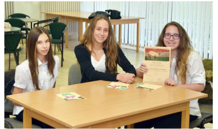
A vetélkedő nyertese a Borsos csapata lett