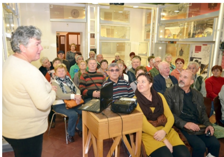
A Városi Múzeumban kezdődött a szakmai nap

Ebéd után rövid sétát tettek Csinger központjában. Meghallgatták a minden nap két órákor a IV. Boldog Károly Király kápolna tornyában megszólaló Bányászhimnusz harangjátékot, megtekintették a templomot. Gerencsér Hilda elmondta, hogy a bányászok már az 1950-es években pénzt gyűjtöttek egy kápolnára téglajegy formájában, de a pénz, ki tudja hova, eltűnt. A misét az iskola egyik termében tartották. Tomor