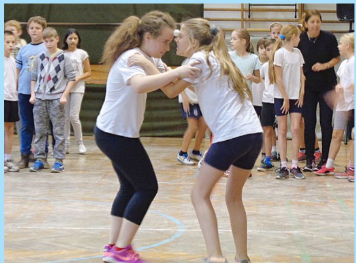
A gyerekek lelkesen vetették bele magukat az izgalmas és játékos feladatokba