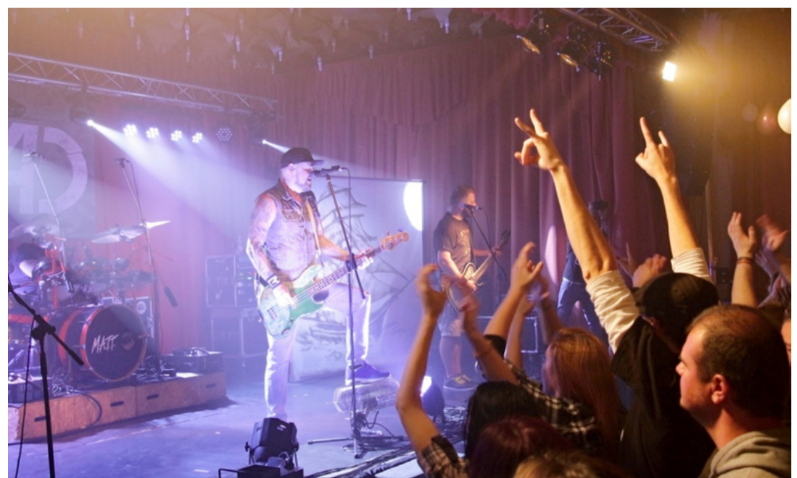
Jó kis buli volt