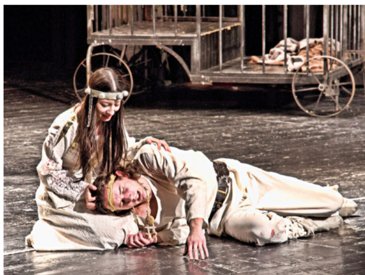
Egy lírai jelenet az előadásból

Molnár Ervin a darabbal kapcsolatban elmondta nekünk, hogy régen is szerették a gyerekek, és most is, már az első két előadás is zajos sikert aratott. Ez kifejezetten egy olyan mese, amivel az óvodás, vagy az általános iskolás alsós korosztályt szeretnék megfogni.