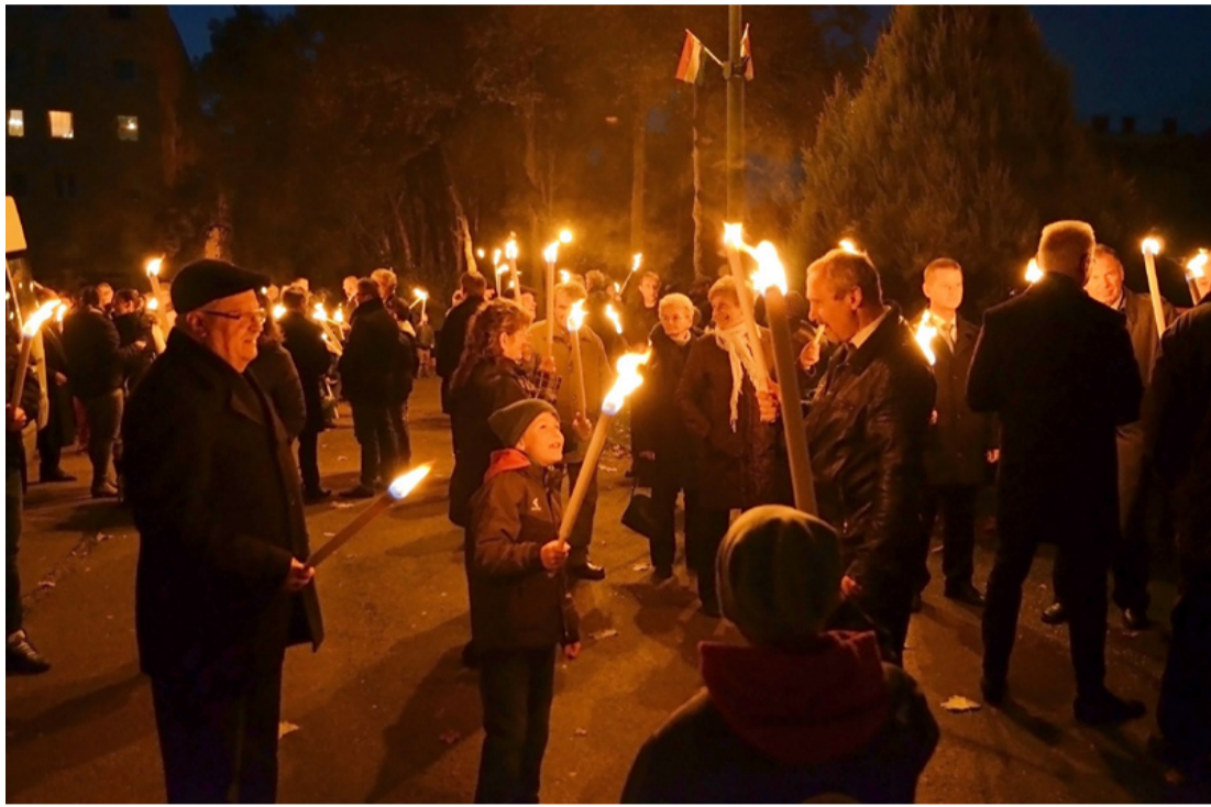
A hagyományoknak megfelelően a Kaszinónál gyülekeztek a fáklyásmenet résztvevői