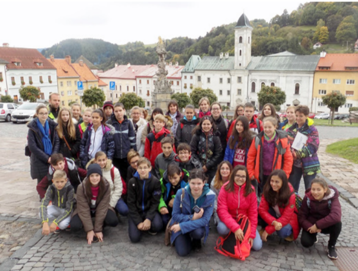
Csoportkép az utazókról

pedagógus fedezte fel idén Szlovákia sokszínűségét, de az iskola már kétszer is pályázott sikeresen a programban való részvételre. Az egyik csoport Erdélyben, a másik pedig szintén a Felvidéken barangolt korábban. Az osztályfőnök azt is elárulta lapunknak, hogy minden úti célhoz kapcsolódóan feladatokat találtak a kollégáival a gyerekeknek. Első este például drámajátékot adott elő a diákcsoport egymásnak Mátyás mondáit felelevenítve.