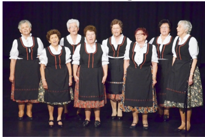
A Regös Klub kórusa