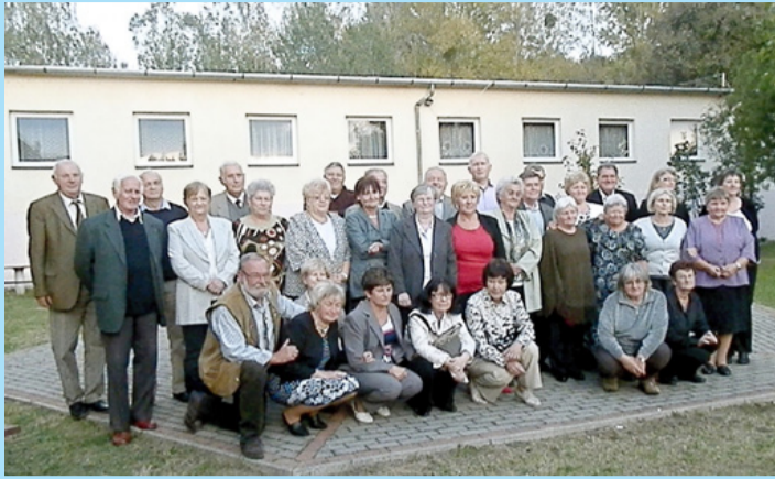
Csoportkép a résztvevőkről

A szépen megterített fehér asztal mellett, ahol finom sütemények, frissítő italok sorakoztak, osztályfőnökeink röviden elmondták, hogyan alakult életük az eltelt 50 év alatt. Ezek után a volt diákok is beszámoltak munkájukról,