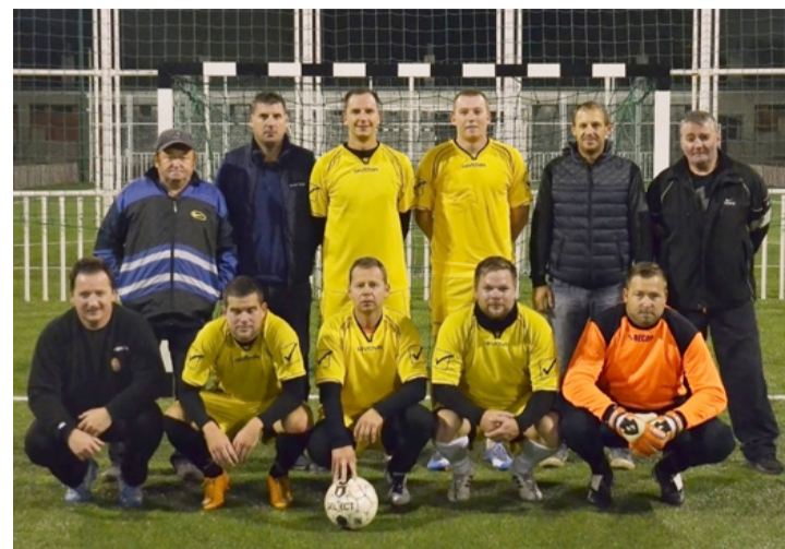
Szoros küzdelem végén a Viva Tours csapata ünnepelhetett bajnoki címet