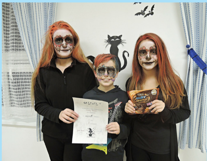
A győztes csapat