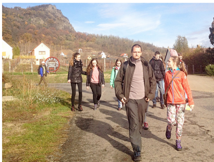
Menetelés a Szent György-hegyen

A diákok reggel nyolc órakor gyülekeztek a buszpályaudvaron, ahonnan különjáratral a Szent György-hegyig mentek. A geotúra kék jelzését követve a Jégbarlanghoz, vagy, ahogy a helyiek mondják, a Sárkány-likhoz meneteltek. A barlang bazalt kockái között több fokkal is alacsonyabb a hőmérséklet, mint a környező terepen. Ennek oka az, hogy a nedves környezet párolgása hőt von el környezetétől, ezért a legmelegebb napokon is hűtőszekrényként viselkedik ez a rész. Ezért kapta a Jégbarlang elnevezést. Nem is fagyoskodtak a bazalt hűtőben sokat, hamar tovább folytatták a 17km-es túrát amely a Kaán Károly turistaház mellett elmenve a bazaltorgonákhoz vezetett. A Szent György-hegy egyik leglátványosabb részei a helyenként 30-40 méter magasba emelkedő bazaltoszlopok, amelyek orgonásipokhoz hasonlóan sorakoznak egymás