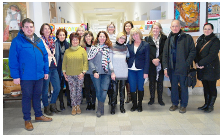
A tanári találkozó résztvevői az iskola folyosóján

Az Ajkai Borsos Miklós Általános Iskola újabb méréldkőhöz érkezett. Az Erasmus+ projekt iskolánk első nemzetközi projektje, és ezért is jelentett valódi kihívást számunkra a novemberi nemzetközi tanári találkozó szervezése. A célunk az volt, hogy tartalmas, színvonalas programot szervezzünk a három partneriskola tanári delegációja számára. Külföldi kollégáink visszajelzései szerint ez meg is valósult. Elmondásuk alapján sok tapasztalattal, élményekkel gazdagon tértek vissza hazájukba: Németországba, Angliába és Olaszországba.