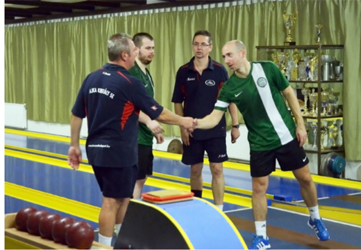
Meccs előtti kézfogás az Ajka Kristály SE – Ferencvárosi TC (1-3) találkozón