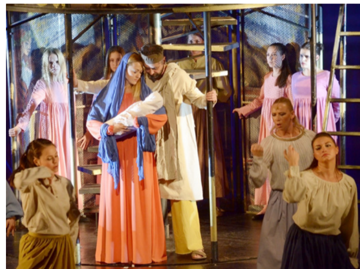
A Megváltó megszületett

A monumentális előadásban a népes táncbetétek, az idő múlását jelképező kör-