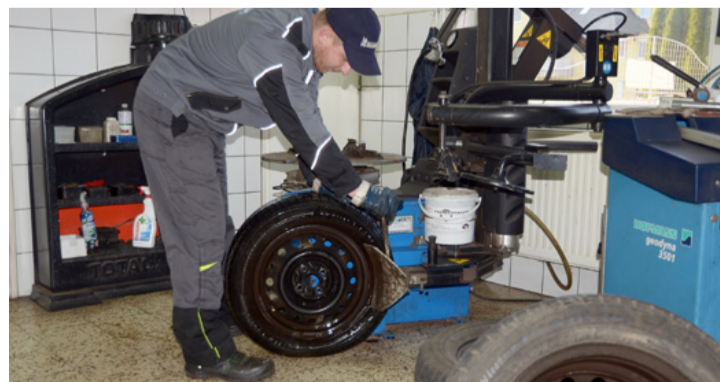
A szervizben október eleje óta pillanatnyi megállás sincs

A szerelők javasolják, hogy hat évesnél idősebb gumit még