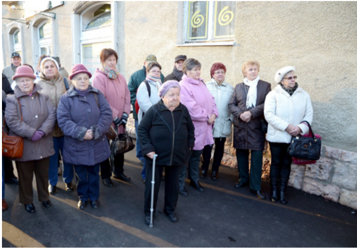
A környék lakóitól azt kérte a polgármester, hogy a házakat is újítsák fel

Átadási ünnepséget rendezett az önkormányzat az Eötvös utcai parkoló, út és járda felújítása alkalmából november 15-én.