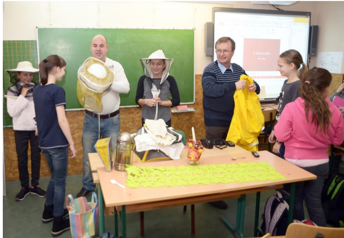
A diákok nagyon élvezték az interaktív ismeretterjesztő bemutatót