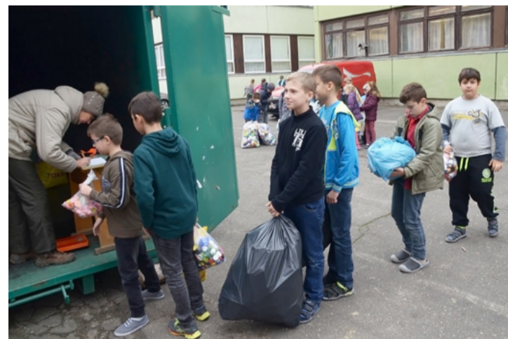
A gyűjtőakció jól sikerült, sokakat megmozgatott