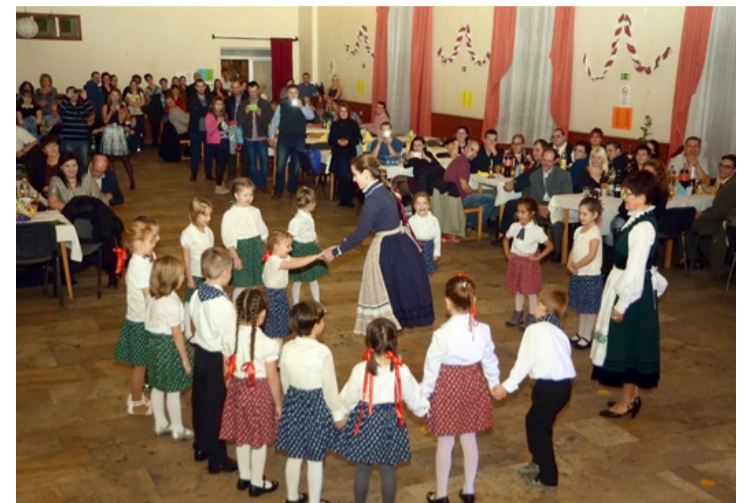
A kicsik is báloztak