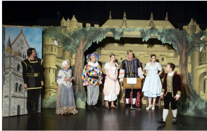
Látványos díszletekkel és jelmezekkel dolgoznak a gyermekelőadások

igazgató vezetésével működő Fogi Színház 15 éve játszik különböző korosztályok számára darabokat. Nagyon jól tudják, hogy mi köti le a gyerekeket. Idén mutatták be a Csengő-bongó királyság