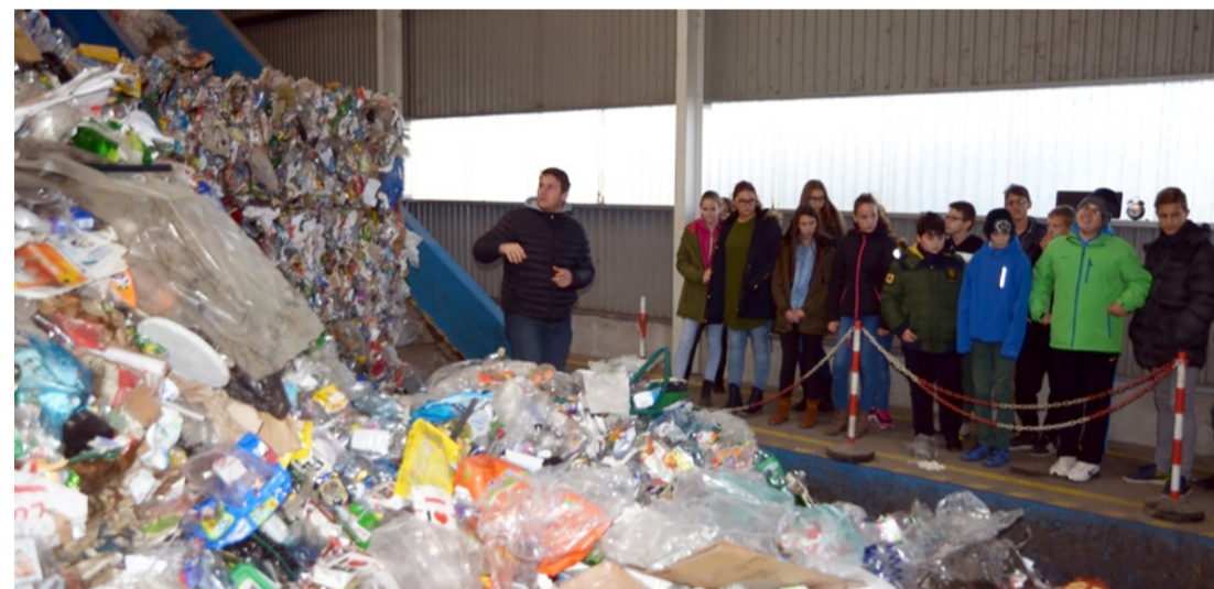
A diákok ámulva nézték a hulladékhegyeket