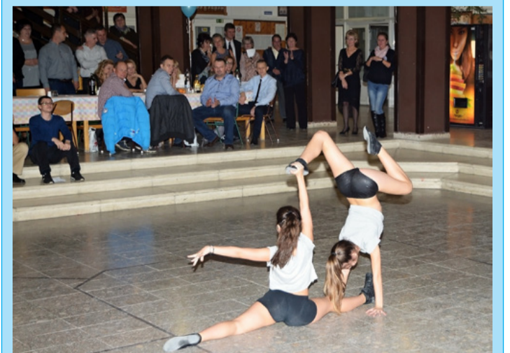
Dinamikus bálindító volt