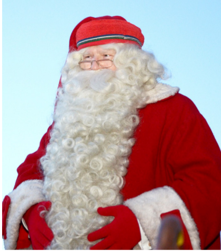
Az igazi finn Mikulás