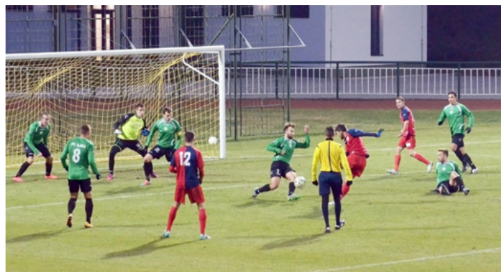
Akcióközben a bírót az FC Ajka – Csepel meccsen