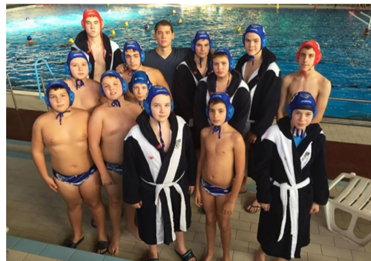
Cápák a parton

Kis pihenő után az Alfa ellen folytatta menetelését a klub, ahol már felszabadultan, igazi örömjátékot mutathattak be a Cápák. A sportághoz képest sok gól esett, az ajkaiak 32:2 arányban játszották le az ellenfelet. Beszédessé számok ezek. A tréner büszke tanítványaira, hiszen mindenki beletette a szívét-lelkét a továbbjutásba.