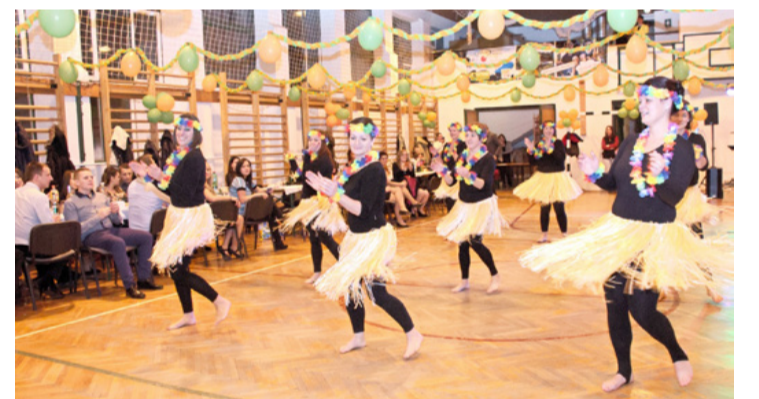
A szülői munkaközösség tagjai és külsős segítők waka-waka táncos produkcióval örvendeztették meg a közönséget

A batyus bálra a szokásokhoz híven most is a vendégek hozták a finomságokat, így sütemény és ital is bőven került az asztalokra, megalapozva ezzel a biztos jókedvet. A svábok bálján nagy sikere szokott lenni a meglepetés előadásnak, idén a szülői munkaközösség tagjai és külsős segítők waka-waka