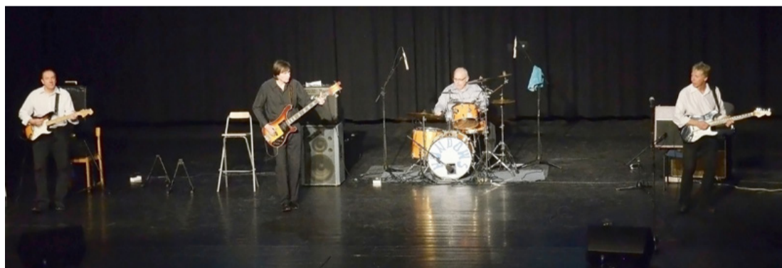
Felidézte a zenekar a hatvanas évek zenei világát