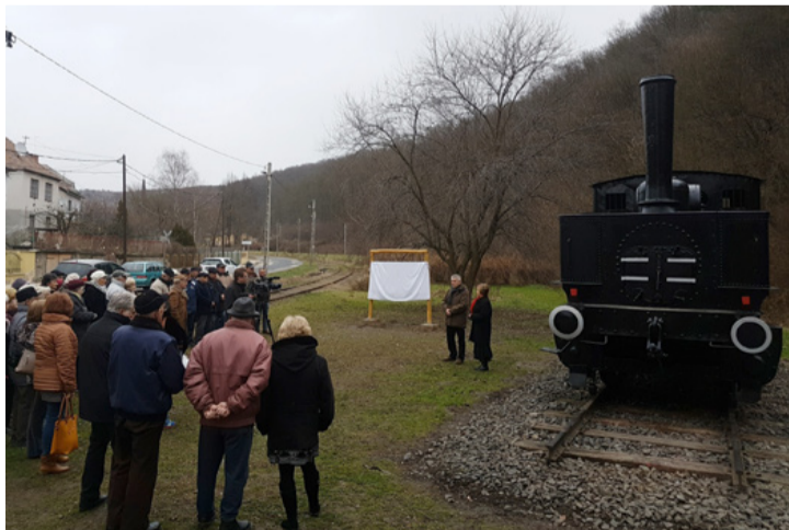
A felújított mozdony mellett készülnek a táblaavatásra az ünnepség résztvevői

Az arra járók eddig csak megcsodálhatták a jó állapotban megmaradt mozdonyt, el-sejétől már annak történetével is megismerkedhetnek. A tábla ünnepélyes átadásán a polgármester köszönetet mondott mindenkinek, aki a hazahozatalért tett, majd a felújításon