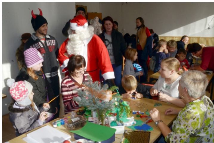
A Civil Házban is Mikulás várta a belépőket

A Civil Ház munkatársai december 3-án, szombaton délelőtt ünnepváró játszótérre várták a gyerekeket. A belépőket a ház udvarán Mikulás várta, aki egy dalt vagy verset kért tőlük, majd nyújtotta az ajándékot. A szaloncukor mellett almát is kaptak. Bent kézműves alkotó foglalkozás és vendéglátás várt mindenkit. A segítő hölgyektől megtudtuk, hogy a fiatalok családjukkal együtt öt asztalnál készíthettek különböző karácsonnyal, téllel és mikulással kapcsolatos díszeket, használati tárgyakat. Láthatóan mindegyik feladatot és próbát élvezte az ifjúság, ám nagy sikert arattak a Lufibohóc alkotásai is. A tombolat vásárlók között két óriási lufi kreációt sorsoltak