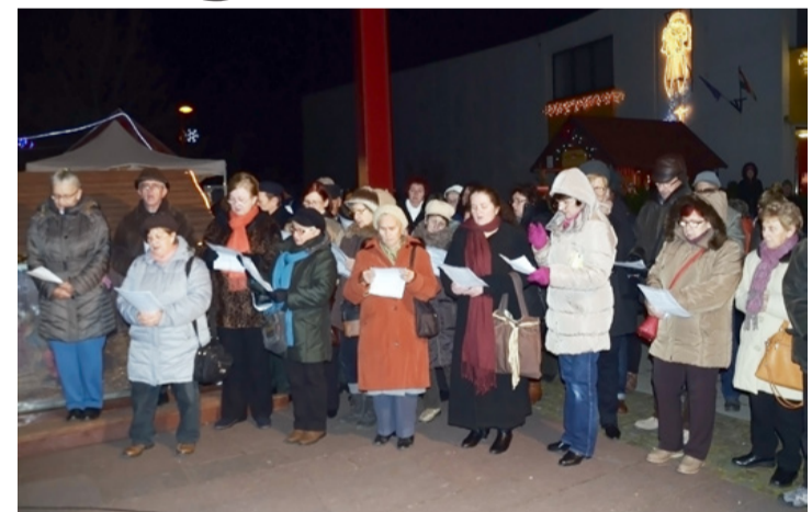
Zsoltárokat is énekeltek az ünnepi gyertyagyújtás résztvevői