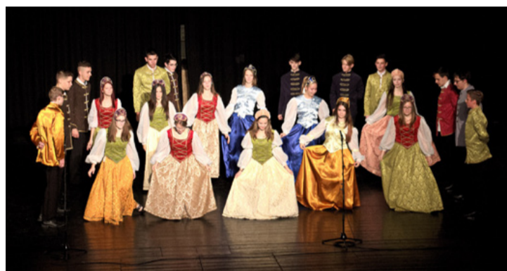
A 10/G-sek palotásával indult a program

Tizenöt műsorszámot láthatott a közönség, amelyek között szavaltat, fuvolajáték, néptánc, valamint aerobik és trombita- és gitárprodukció is szerepelt. A 10/G-sek palotásával indult a program. Kökényesy Dominik 6/E. osztályos tanuló hegedűvarázsa és a 8/G-s Harmos Viktor zongorajátéka is nagy tapsot kapott. A cse-