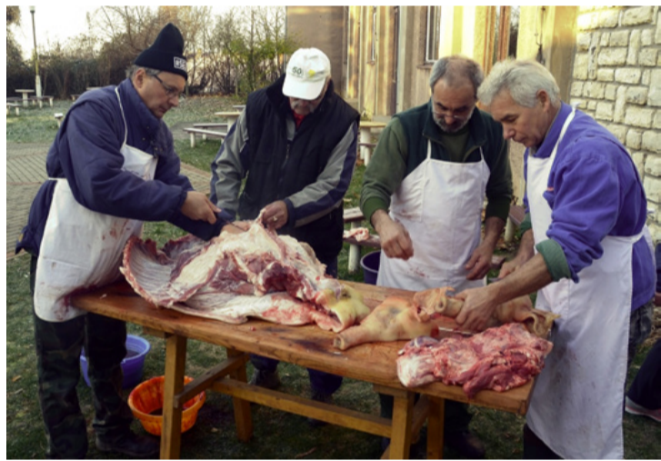
A csapat összeszokott, így gyorsan megy a munka