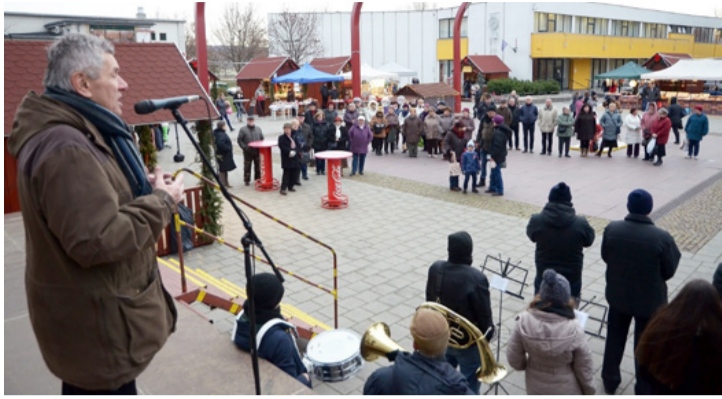
A megnyitón Schwartz Béla polgármester mondott beszédet

Ünnepi fénybe öltözött a város, esténként ezüst és arany pompában tündökölnék a fák, illetve az épületek. Az Agóra karácsonyi díszai napok óta csalogatják sétálni és fényképezni a családokat. Népszerű a rénszarvas húzta Mikulás és a hőemberes kompozíció is, mindkettő elnyerte már a kicsik és nagyok tetszését egyaránt. December 1-jétől pedig már a vásár kínálatából is szemezgethetnek a térre érkezők.