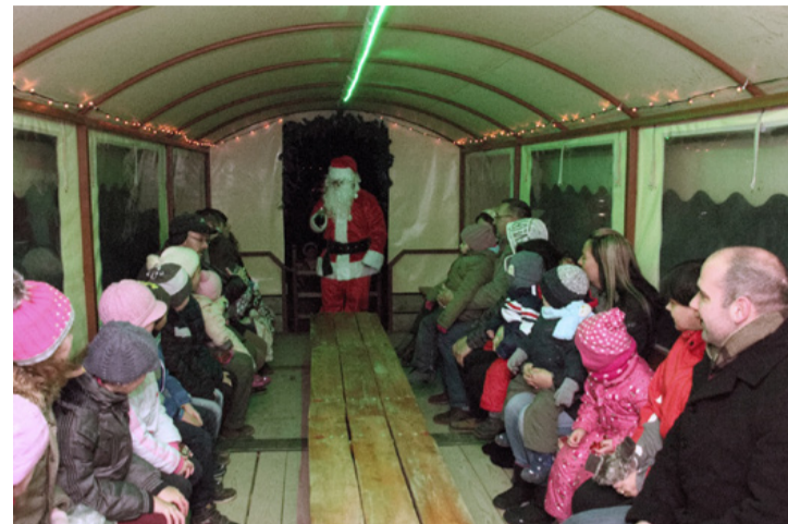
Idén is traktorral érkezett a Mikulás Bakonygyepesre

gadtott a szüleinek és ezzel kiérdemelte az elismerést, de én meggyőztem hosszúszakállú barátomat, hogy tegyünk meg egy kísérletet és adjunk