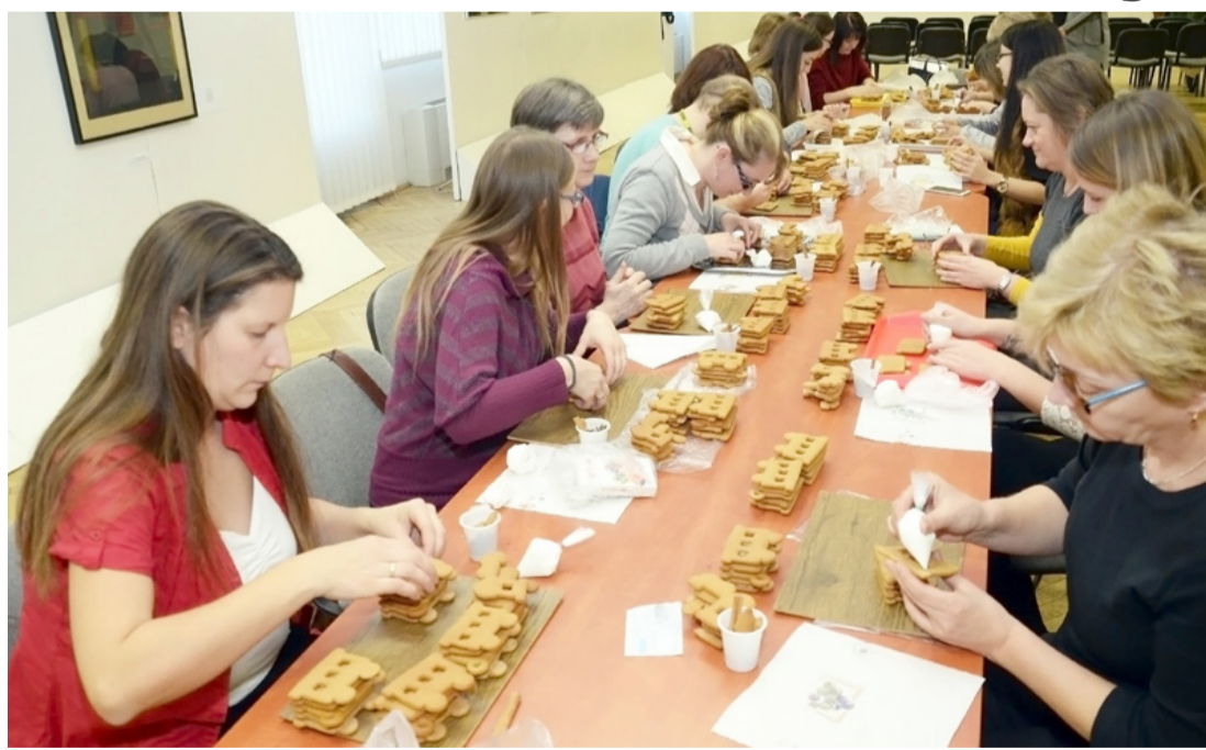
Kész mézeskalács alapokat tudtak díszíteni az alkotni vágyók

A mester 2010 óta fejleszteti műhelyét, amelyet családi vállalkozásban működtet. A természetes anyagokból készült mézeskalács figuráival számos sikert ért el. A szükséges adalékanyagokon kívül titkos összetevőket használ. Nagy adag szeretet, sok türelem, kis huncutság és rengeteg ötlet felhasználásával készülnek a mézeskalácsok. Igény van a munkáira és a