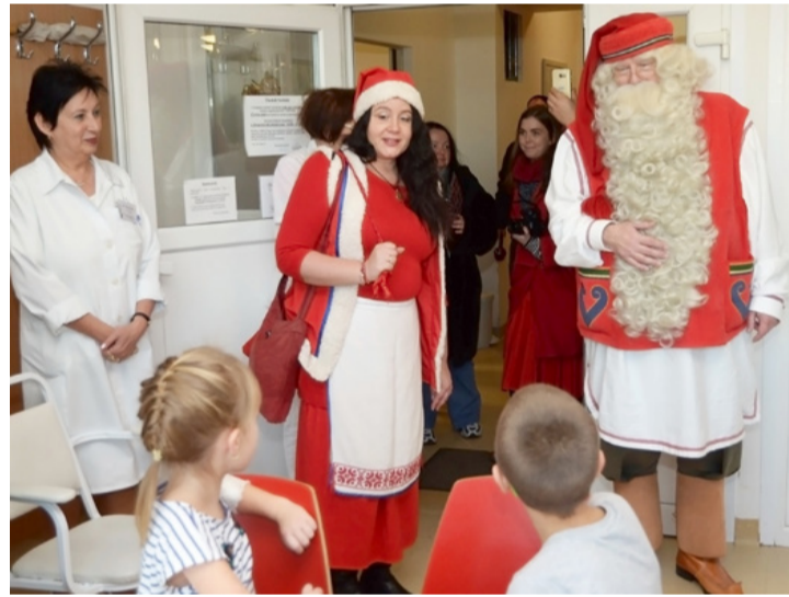
Városunkban a kórház gyermekosztályára vezetett Joulupukki első útja