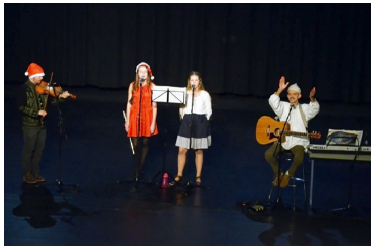
Ingyenes koncerttel hangoltak kicsik és nagyok az ünnepekre a szabadidő központ aulájában

A program az Áldás Együttes koncertjével ért véget a színházteremben. A banda népzenei alapokon nyugvó