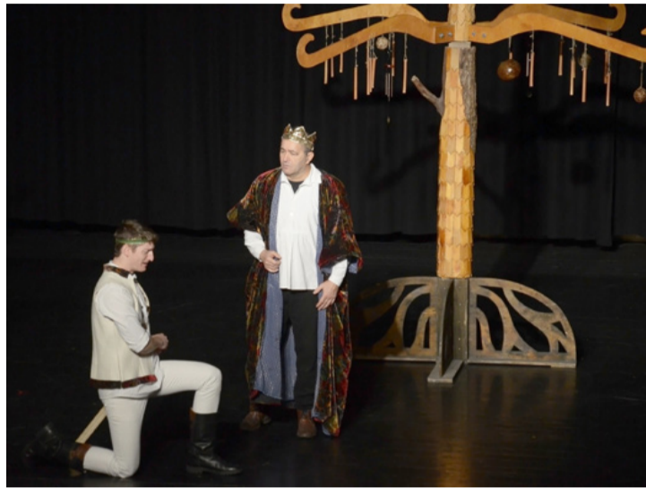
Felséges királyom, életem, halálom, kezembe ajánlom

Benedek Elek, a nagy mesemondó ezt a cselekményt is teletűzdelte népmesei elemekkel. Kurta mondókaival indult az előadás. „Az én lovam kese, induljon a mese!” És elindult. A királyi pár gazdagságban élt, de hiába az arany, az ezüst, a számos ország, amely felett uralkodott Solomon király, a gyermekáldás csak nem akart megérkezni, mígnem a csodaszép lilium virág meglepte a királyi párt egy kisgyermek-