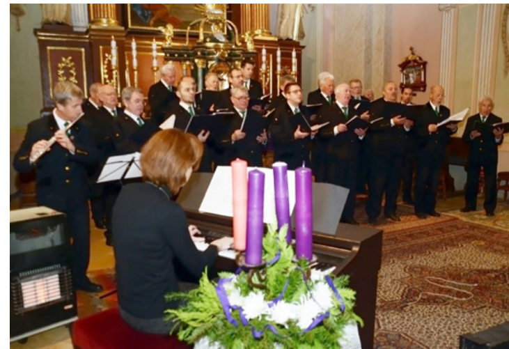
Adventi díszek között énekelt a Padragi Bányász Férfikórus a tóskberéndi templomban

Még tartott a koncert, amikor már zengett a dal Tóskberénden a Szent István Király Plébániatemplomban, a hagyományos adventi hangversenyen, a Padragi Bányász Férfikórus énekével. A 43 éves múlttal rendelkező Padragi Bányász Férfikórus – talán mert közöttük Tóskberéndhez kötődő kórus tagok is vannak – felismerte a templom különleges hangulatát, így a hangversenyre érkezőknek minden alkalommal