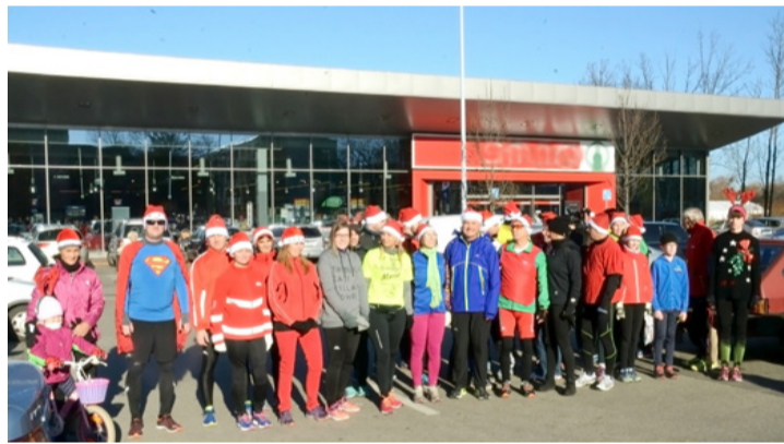
Mikulás és rénszarvas jelmezbe öltözött futók a Mikulás futás rajtjánál