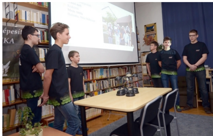
A látványos előadásban a méhek hasznosságával foglalkoztak

Fiatalok, lelkesek és nem utolsósorban tehetségesek. Hisznek a csapatmunkában és imádnak LEGO robotokat építeni, programozni. A Bródy Imre Gimnázium diákjainál jártunk, akik a házi méhet választották állati szövetségüknek kutatási témaként az FLL 2016, vagyis a First LEGO League december 3-ai, győri versenyére.