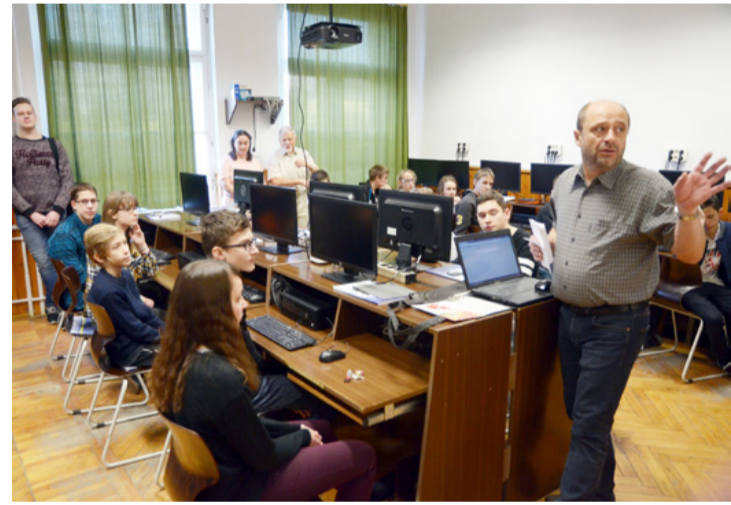
Huszonhét diák, azaz kilenc csapat jelentkezett a nagy múltú megmérettetésre