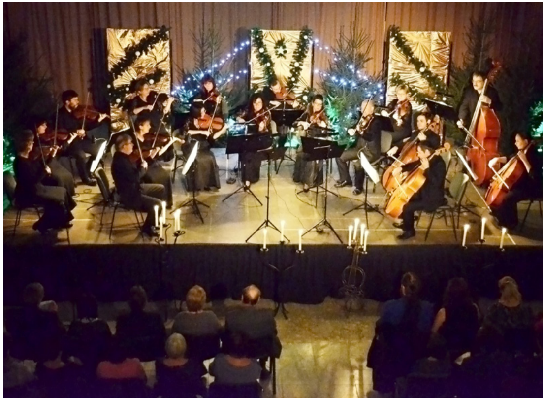
A Bánki iskola feldíszített aulájának embermeleg, ölelős hangulata teszi különlegessé ezeket a koncerteket

Mendelssohnék idei, immár tizenhetedik Gyertyafényes várakozásán a zsúfolt ház pontosan azt kapta, amit ettől a koncerttől elvár: bensőséges hangulatot, klasszikus zenei slágereket és vérpezsdítő újdonságokat, illetve a ma Magyarországon elérhető legmagasabb művészi színvonalat.