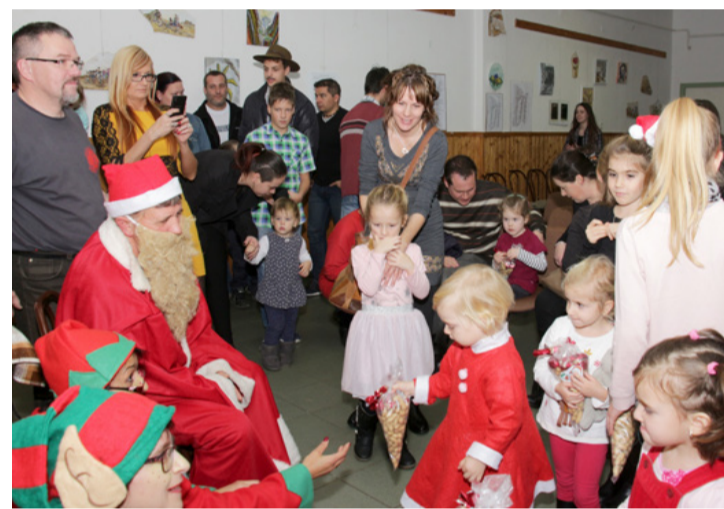
A gyerekek meghatódva hallgatták a Mikulás történetét

A színdarabjuk után a varázsló újra színre lépett és gyerekekkel, hogy a közösen elmondott varázsigének köszönhetően elrepítették a kö-