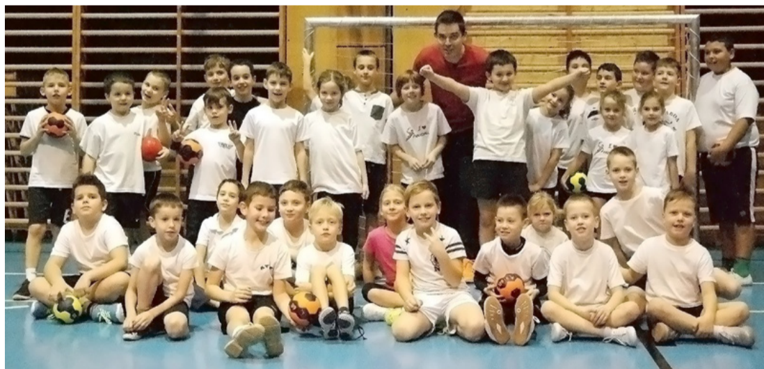
A lelkes kézis csapat

Az oktató kérdésünkre elmondta, hogy most találkozott először a gyerekekkel, ám ennek ellenére mindenkivel szinte az első pillanattól megtalálta az összhangot.