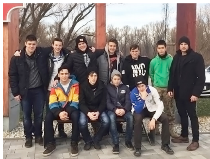
A Cápák minden fronton jól teljesítettek