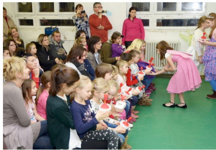
A gyerekek szaloncukrot és kifestőt kaptak ajándékba

Sportosan várták a Mikulást a padragkúti városrész