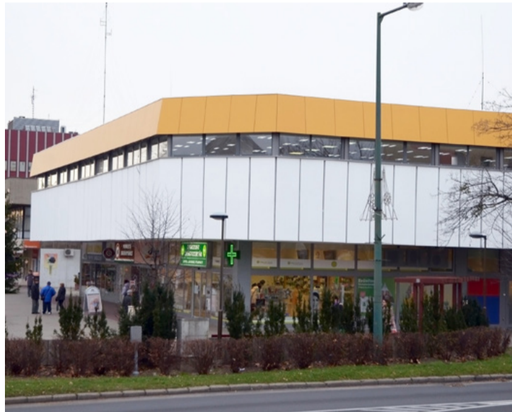
A felújítás eredményeként egy korszerű üzletközpont várja a vásárlókat a belvárosban

Bizonyára olvasóinknak is feltűnt, hogy komoly felújítási munkálatok zajlottak a közelmúltban a sétálóutca egyik jellegzetes épületénél, a Horizont Üzletháznál. A lé-