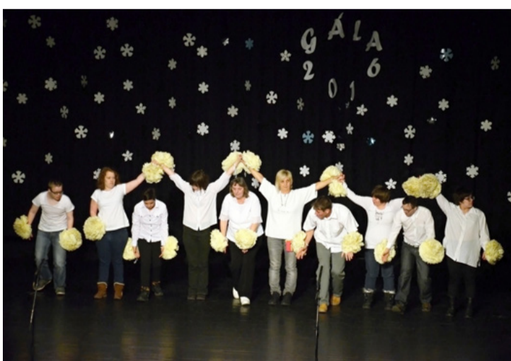
Több hangulatos, táncos produkciót is láthatott a közönség

A 25 műsorszám között volt modern tánc, néptánc, hastánc, vers, ének, szinda- rab. Bemutakoztak a legki- sebbektől a legnagyobbakig, az előkészítőstől a szak- iskola diákjaiig. A jól felké- szült gyerekek, a gondosan összeállított műsor bebizo- nyította, hogy hozzáértő pe- dagógusok sokat ki tudnak hozni a valamely területen lemaradókból. A Molnár is- kolában is működik táncso- port, szakkör, a pedagógusok