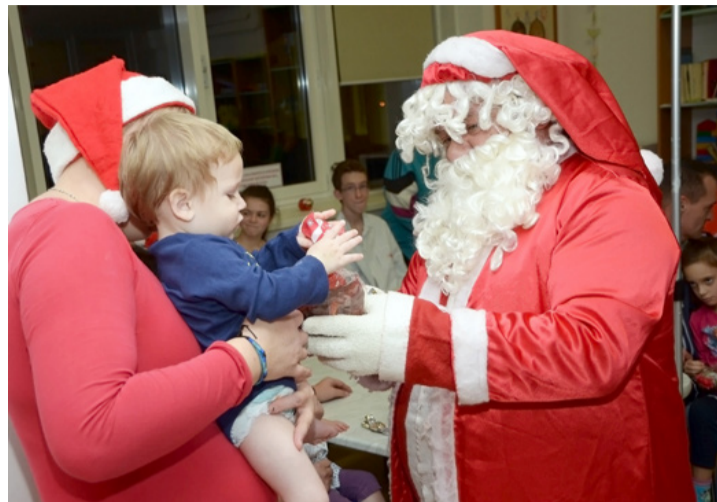
A helyi és környékbeli Fradi szurkolók ajándékosomagot vittek a kórházban fekvő kis betegeknek

adományozás ötletgazdájától megtudtuk, hogy a szurkolók fontosnak tartják a gyermekekkel való törődést ilyenkor, mert tudják, hogy az ünnepek közeledtével a kicsiknek különösen nehéz megbirkóznia azzal, ha kórházban kell lenniük, ahelyett, hogy otthon a családjuk körében tudnának játszani és ünnepelni, ezért látogatnak el minden decemberben hozzájuk.