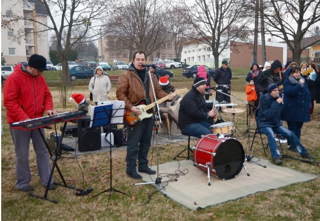
A Hangadók zenekar karácsonyi műsora is színesítette a rendezvényt