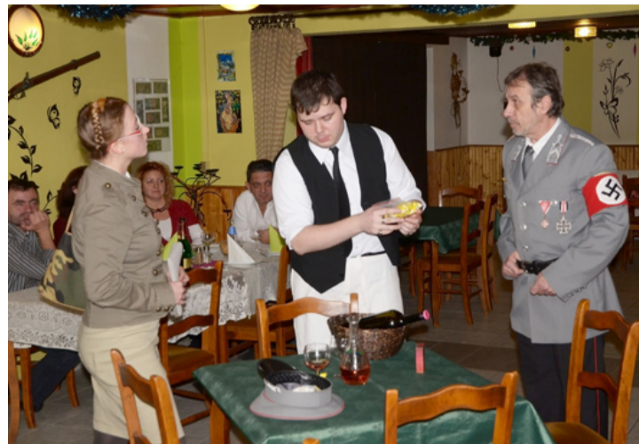
Megérkezett a vendéglőbe a Gestapo is

A színház és a vendéglátás közös kísérletezésének voltak tanúi, akik december kilencedikén ellátogattak a Park Vendéglőbe. Egy interaktív előadás keretében mutatta be ott a Táltosok Társulata amatőr színház a Halló, halló! című darabot.