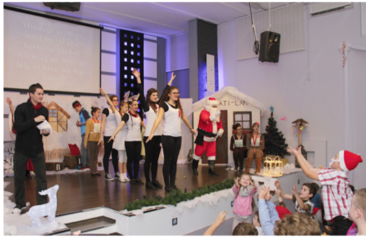
Komoly, zenés darabot adott elő a Hit Gyülekezete

Civil szervezetek, egyesületek is tartottak az idén is karácsonyi ünnepséget, programot. A mikulások inváziója folytatódott, így mikulásleltárunk is.