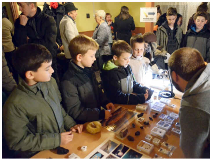
Csak úgy záporoztak a kérdések az előadókhoz