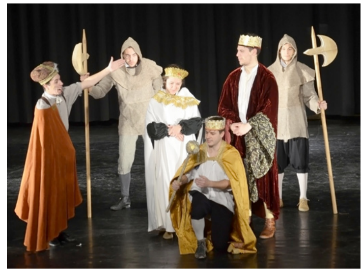
Az előadást a fiatalok kedves, lendületes játéka tette mozgalmassá