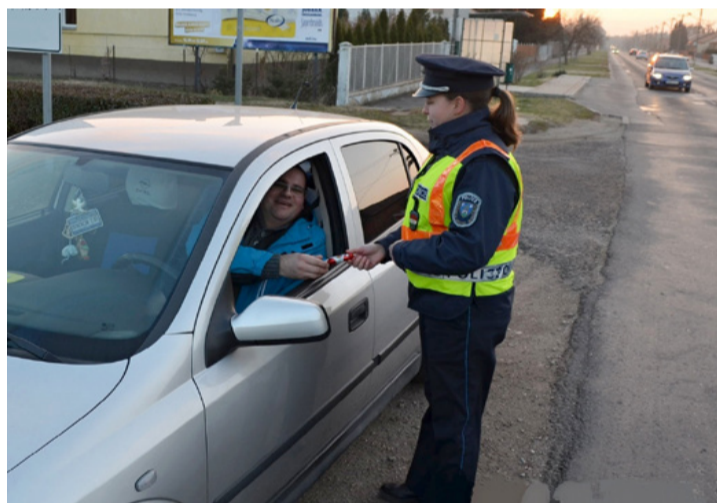
A hasznos tanácsok mellett csokimikulást is osztogattak a rendőrkapitányság munkatársai

Rendhagyó Mikulás napi közlekedési akciót tartott az Ajakai Rendőrkapitányság Közlekedésrendészeti Alosztálya december 6-án. Az akció célja az volt, hogy az ittas gépjárművezetőket kiszűrjék, illetve hogy felhívják a gépjárművezetői figyelmét rá, hogy az ünnepi időszakban is kellő figyelemmel vegyenek részt a közúti közle-