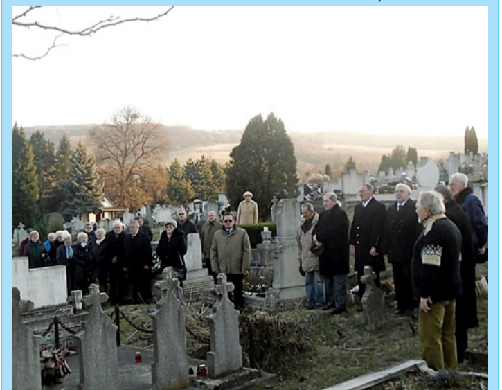
A bódéi temetőben a bányásztársakra emlékezve énekeltek el a bányászok himnuszát