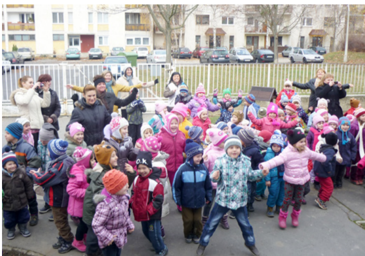
Jó a ritmusérzékük és lételemük a mozgás

A napokban ünnepélyes keretek között helyezték ki az Vizikék óvoda épületének falára az „Ép testben ép lélek” táblát, ami azt jelzi, hogy a gyermekintézmény regisztrált tehetségpont lett.