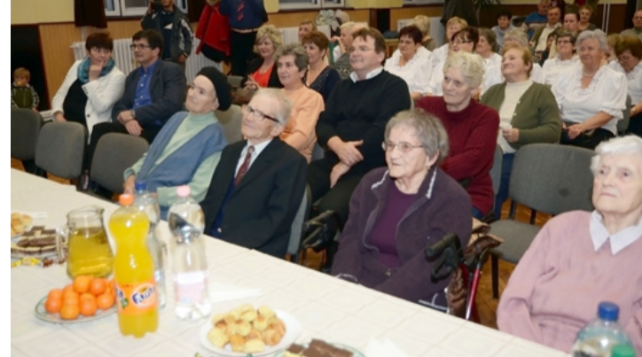
Az időseket családtagjaik is elkísérték