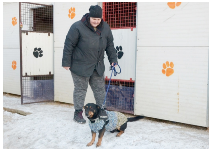
Extrém hidegben a kutyákat is felöltöztetik a sétához