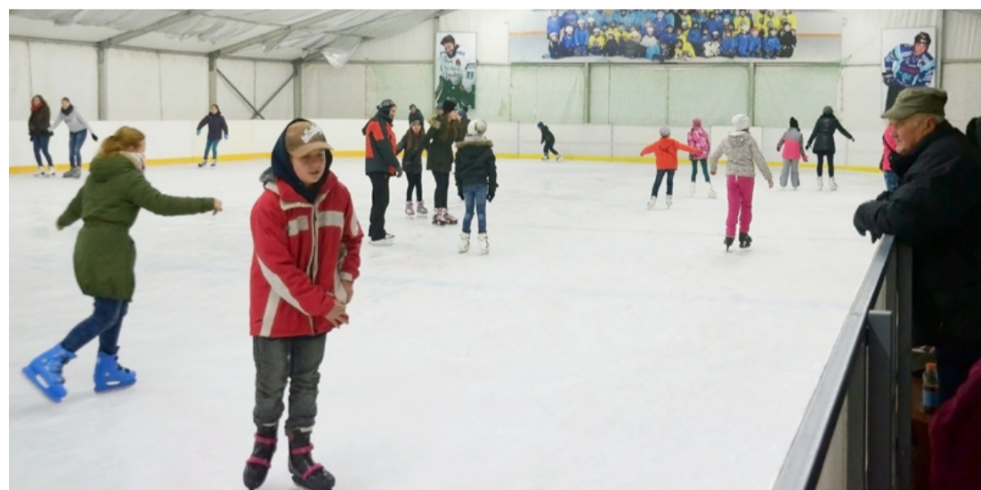
A kezdő korizók inkább a pályára jönnek gyakorolni