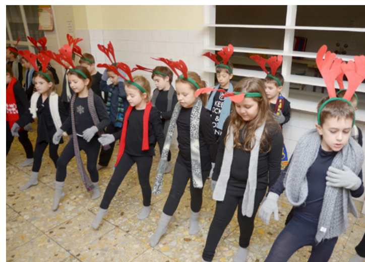
A kisiskolások rénszarvasnak öltözve énekes táncos produkcióval készültek a vendégeknek