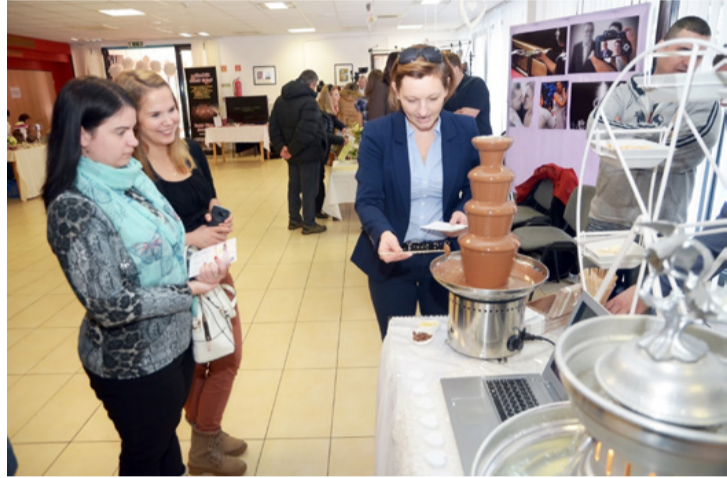
A csokiszökőkút egyre népszerűbb a modern esküvőkön