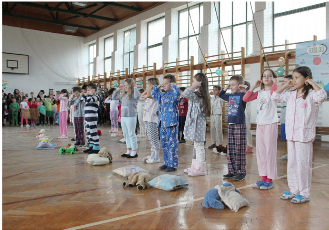
A győztes alsós produkció az ébredés az iskolához méltón németül előadva