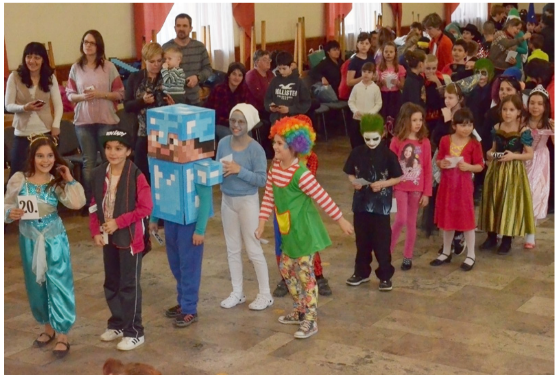
A gyerekek egyénileg öltöztek be, kevés kölcsönzői jelmez volt