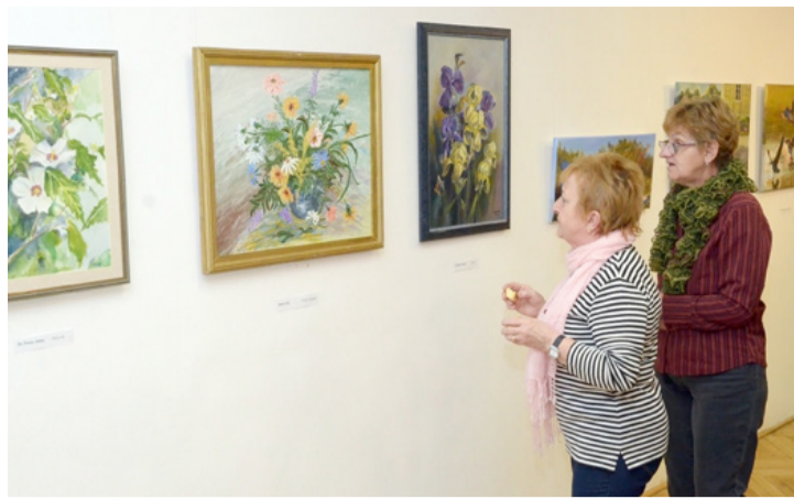
Az alkotást mindenki a saját nézőpontjából értékeli, értelmezi

A megnyitón Gaál Antal költő elmondta, hogy a közhasznú egyesület formában működő közösség 2006-ban, 11 évvel ezelőtt alakult. Jelenleg 30 tagjuk és 20 pártoló tagjuk van. Kü-