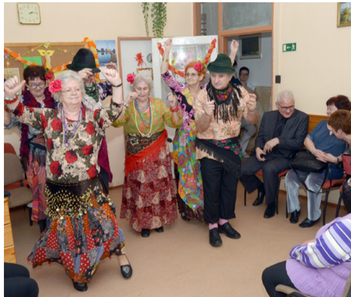
Emelkedett hangulatban zajlott a farsangolás