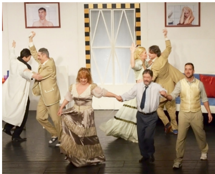
A végén persze mindenki boldog volt