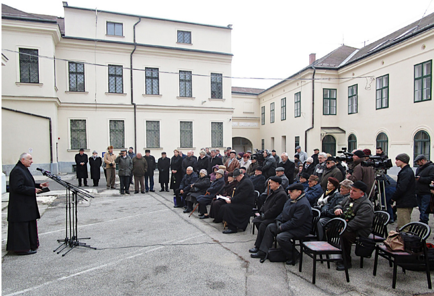
A kivégzés színhelyén, az egykori várbörtön udvarán zajlott a megemlékezés