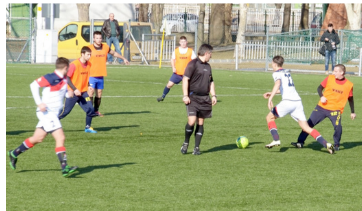
Az Ajka Kristály a Mészöly Akadémiával játszott felkészülési mérkőzést a bajnoki rajt előtt

Rangadóval kezdődött a tavasz férfi kézilabda csapatunk számára, hiszen az élvonal ajkaiak a második helyezett tarjániak otthonába látogattak. A játékosok öröme sok lelkes szurkoló