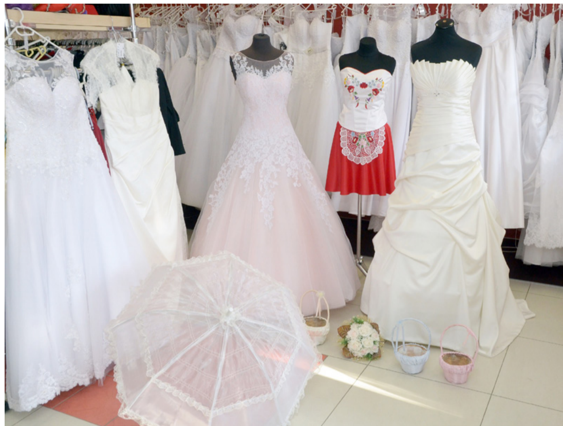
Arra a napra mindenki a legszebbet, a legjobbat akarja