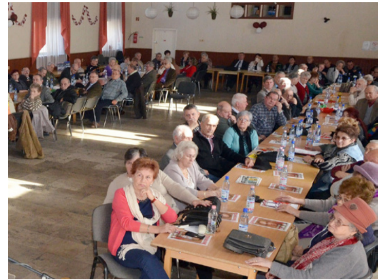
A résztvevők egy csoportja a nyugdíjasparlamenten