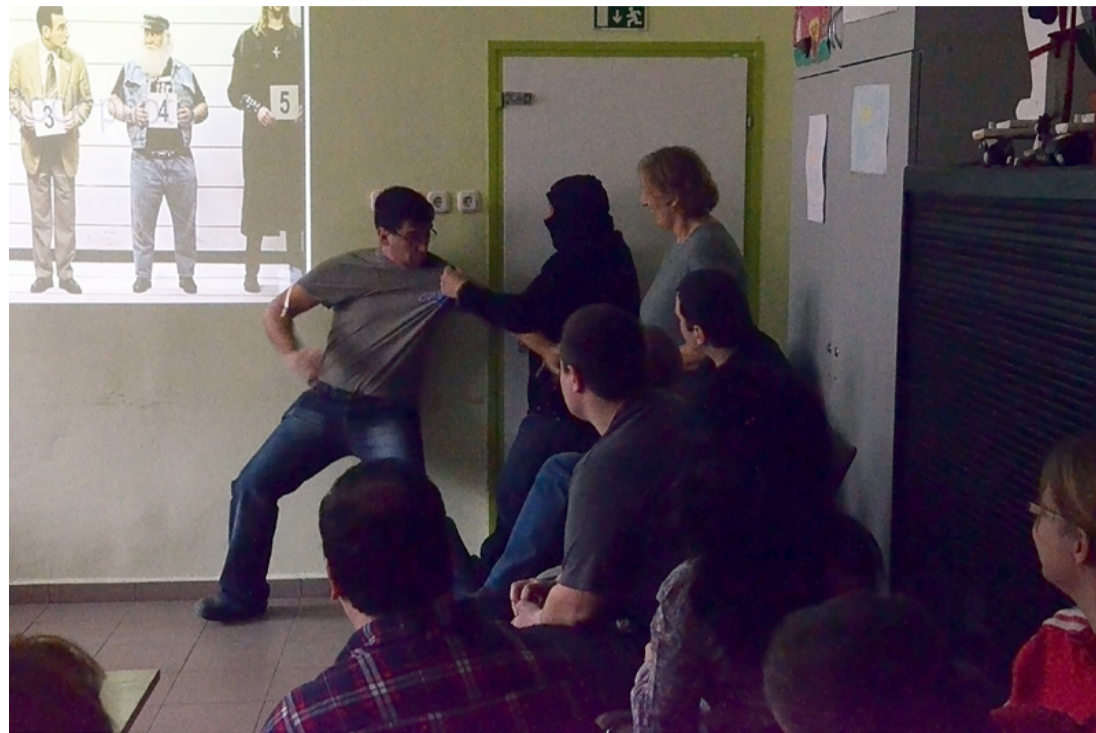
Símaszkos támadó ugrott elő a sötétből