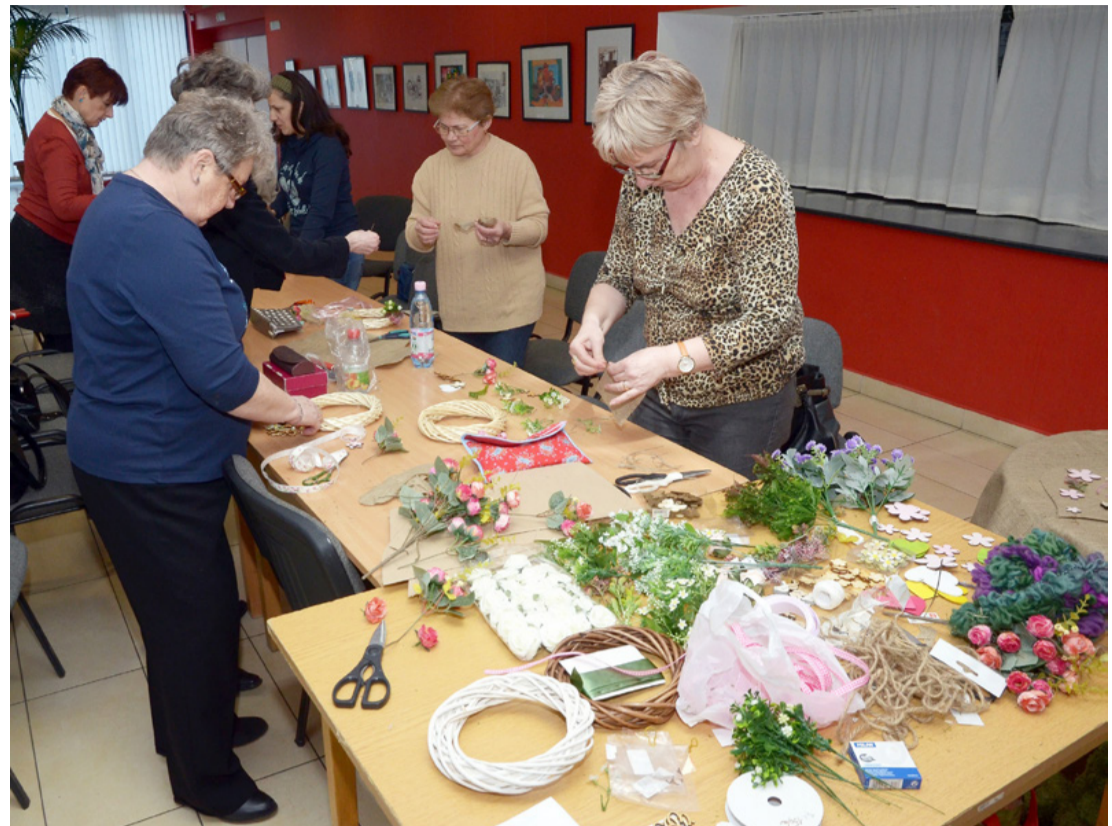
Készülnek az ajtódíszek

Az elmúlt években egyre gyakrabban látunk a bejárati ajtókon az ünnepeket évszakokat jellemző díszeket, amelyek kedvesen invitálják a vendégségbe érkezőt. Ha lapozgatjuk a képes újságokat, akár papíralapon, akár elektronikusan számos formáját találjuk ezeknek a díszeknek. Anyagát tekintve természetes alapanyagoktól a műanyagig mindenki választhat, hogy miből készítsen néhány darabot, akár ajándékként is. Általában kört formáznak a díszek, ami a legelterjedtebb, de az ünnepek jelképeit is meg-