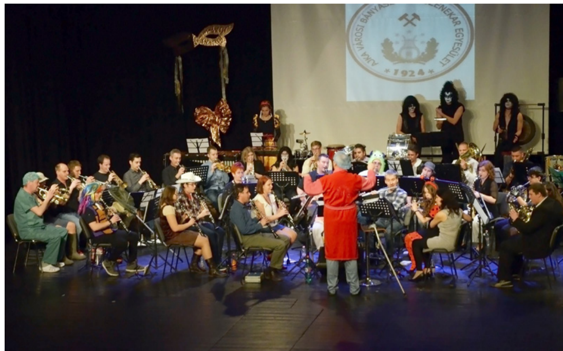
Vidám jelmezben, vidám zenével búcsúztatták a telet a fúvósok