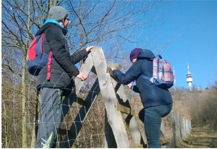
Egymást segítve sikerült leküzdeni a létrát és vele együtt a tériszonyt is

A forgalmas főút szélén haladva pár méter után ráfordultak egy széles földútra, amely rétek, ligetes erdőfoltok között emelkedik, enyhén kanyarogva. Így érték el a Kab-hegy lábánál húzódnó széles mezőket. Előttük a távolban a hegy tetején egyre nagyobbak látszott a két adótorony. A magasabb a TV-, az alacsonyabb a rádió adótorony. Eddig a túra összességében nem volt túl nehéz, ami mégis oko-