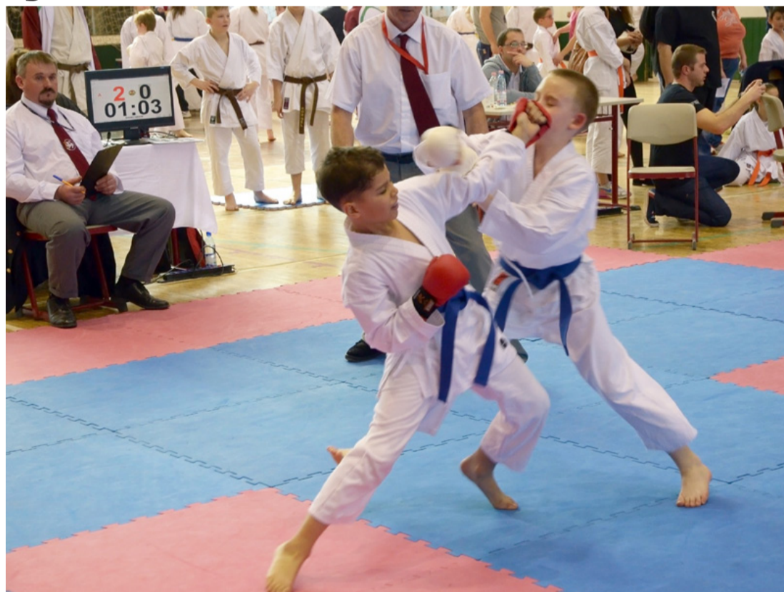
A versenyen teljes erőbedobással küzdöttek egymás ellen, utána bejelölték egymást a közösségi oldalon

A program délelőtt 10 órakor kezdődött és az eredményhirdetés fél ötkor volt. A sportcsarnokban egész nap remek volt a hangulat. Azok a gyerekek és fiatalok, akik a versenyen teljes erőbedobással küzdöttek egymás ellen, miután lejötték a pályáról, érdeklődtek egymás sporttevékeny-