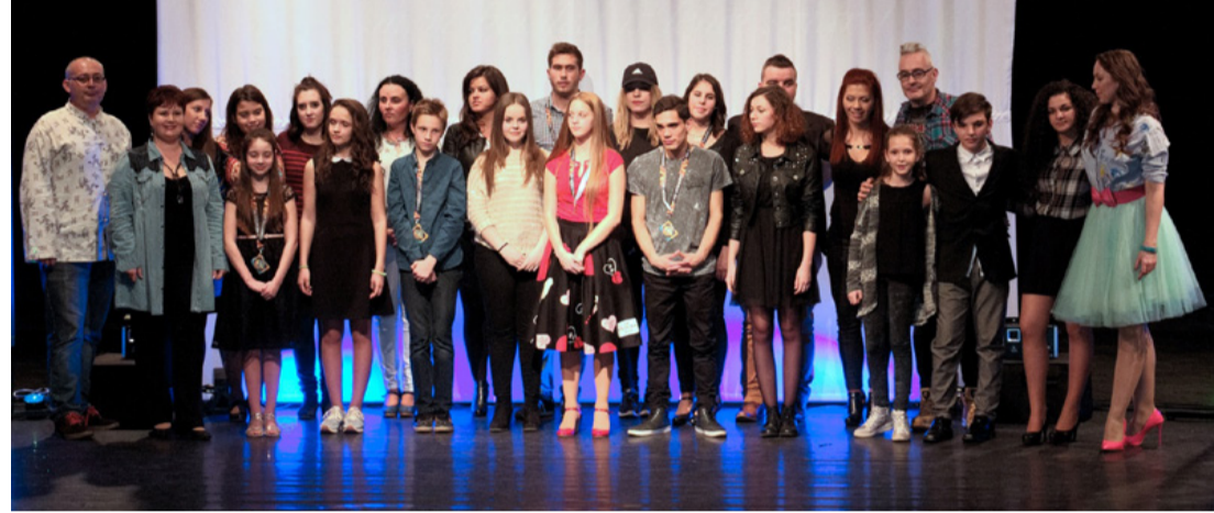
A továbbjutók boldog csapata és a zsűritagok