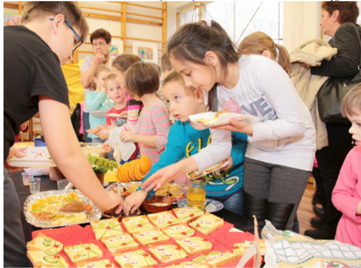
A program végén megkóstolhatták azokat a reform ételeket, amelyeket közösen készítettek

Újszerű játékiállítással is kedveskedtek a vendégeknek az óvoda dolgozói. A bemutatott játékok elsősorban az egészséghez kapcsolódtak, és többnyire saját készítésű eszközök voltak. Ezeket érdeklődve vették birtokukba és játszottak vele a családok tagjai.