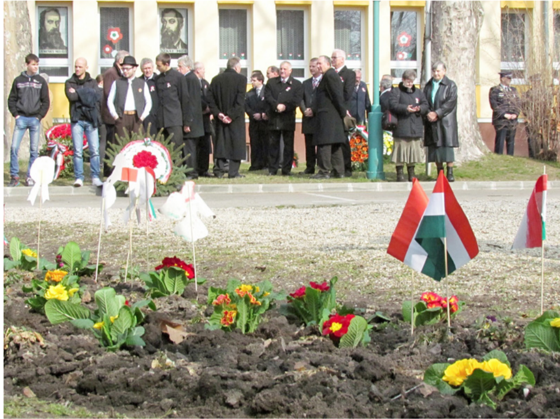
Gyülekeznek az ünneplők, az iskola ablakából Tánocsics Mihály és Jókai Mór nézi őket