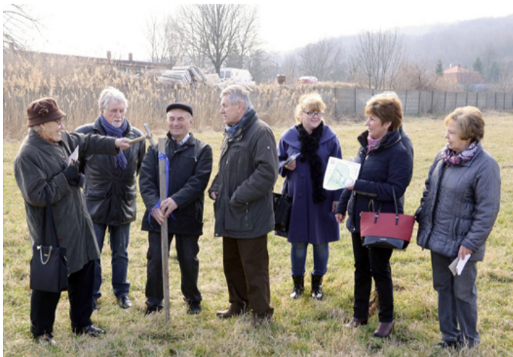
Karókkal jelölték ki a terület határát