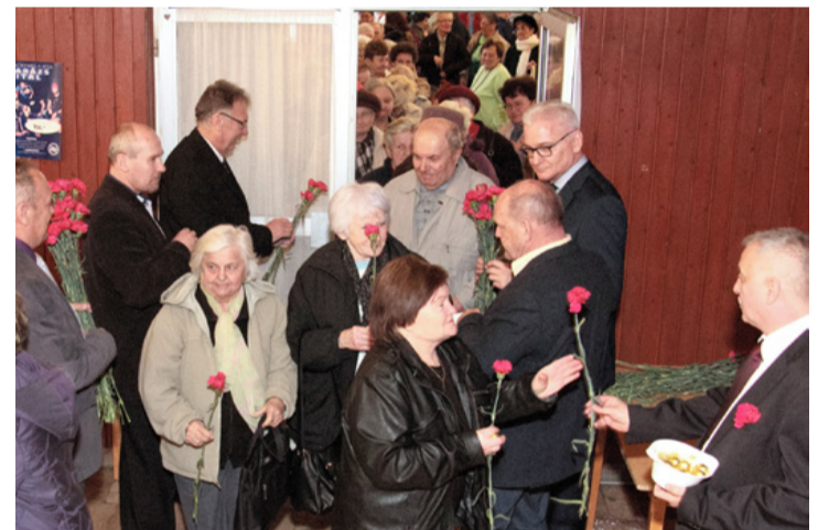
Az ünnepség végén egy-egy szál virággal köszöntötték a résztvevő nőket a Kaszinóban