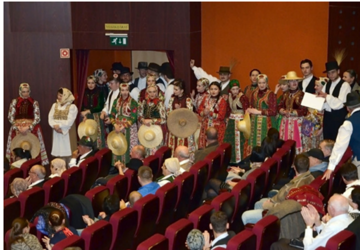
Időnként a nézőtér színesebb volt, mint a színpad

Közel kétszáz néptáncos részvételével tartották meg március 18-án, szombaton a XXII. Bakony Néptáncfesztivált az Ajka-Padragkút Táncgyűttes, a Nagy László VKSZK és Ajka Város Önkormányzata közös szervezésében.