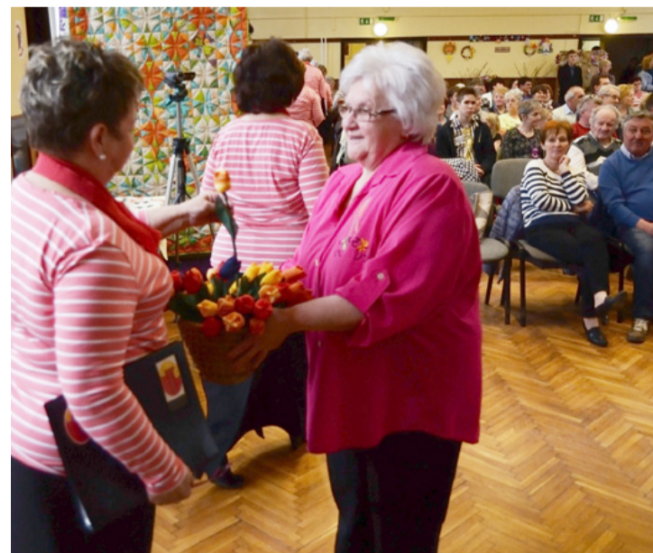
Virággal köszönték meg a házigazdák a Jubilate Női hangversenyt