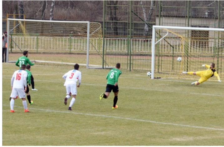
Két kapu közül az egyiket sikerült eltalálni... FC Ajka – Honvéd II. 2-1.

Ha a keret nem is, de a hozzáállás minden bizonnyal kicserélődött a megyei bajnokságban szereplő csapatnál, amely talpra állt a borzalmas kezdés után.