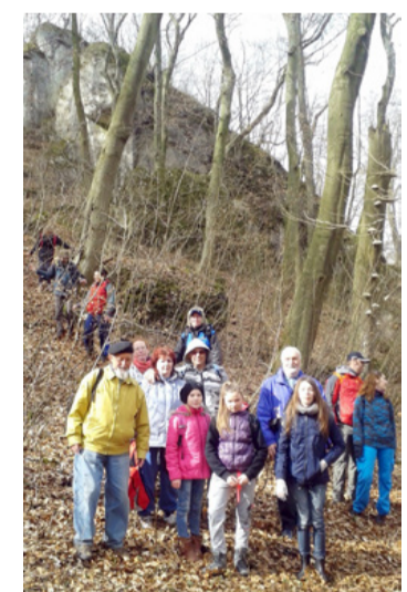
A csoport a Padragi-sziklák tövében