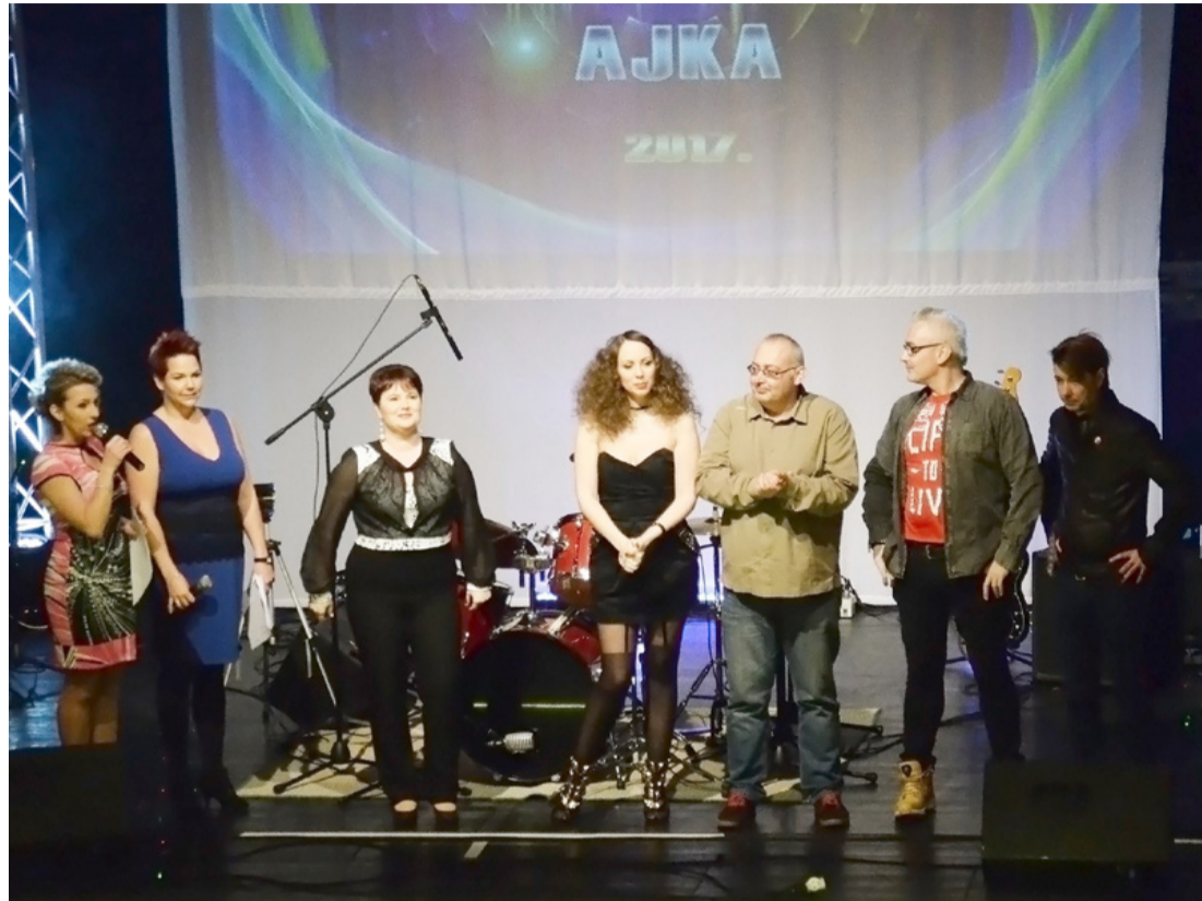
Eredményhirdetés előtt: a zsűri és a műsorvezetők is a színpadon