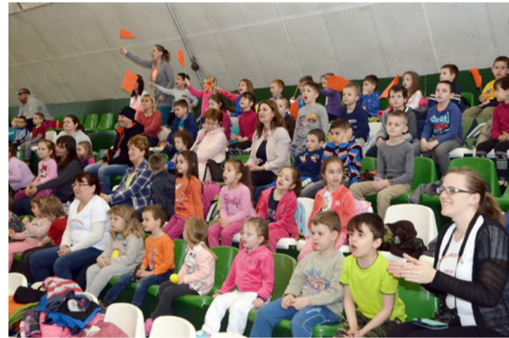
A lelátókon óvodai dolgozók, szülők és a versenyző gyerekek csoporttársai várták a fejleményeket, kezükben színes zászlókkal, kereplőkkel és dobokkal

A korosztálynak örömet szerző feladatokkal készültek a szervezők. Többek között váltófutásban, babzsák terelgetésben, futóbringázásban, valamint szökdeléssel megspékelt ügyességi játékokban mutathatták meg magukat a gyerekek. A háttérben közben folyamatosan ment a zajszerzőkkel a biztatás és a taps. A hét teljesített feladat után a szervezők végeredményt hirdettek, ahol elmondták, hogy nem a teljesítmény, hanem a részvétel volt a fontos, ezért minden csapat egyforma jutalmat kapott, helyezéstől füg-