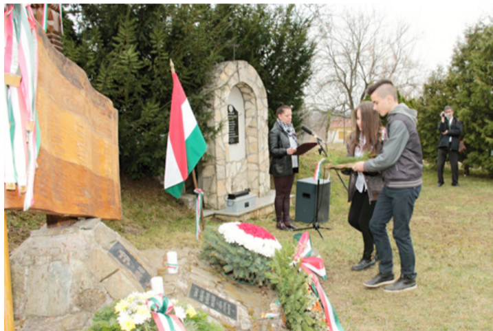
Koszorúzás a padragi kegyeleti parkban