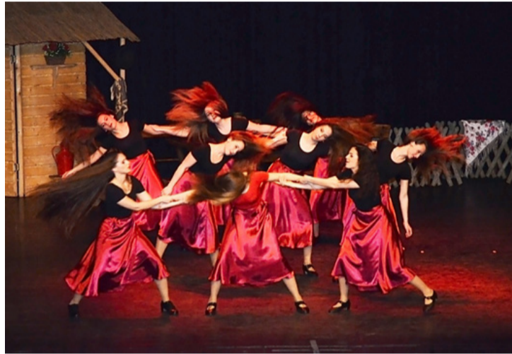
Néptánc alapokra épülő, de modern mozdulatokkal tűzdelt előadásukban boszorkányként varázsolták el a férfiakat

a táncosok kedvence is lett a felkészülés során. A művészileg újragondolt előadást az eredeti film kimerevített jelenete nyitotta meg. A felvételen jelenlévőket az ajkai táncosok váltották fel a lassan emelkedő vászon mögött. Utánuk a Kőkényes Együttes előadásában láthattuk, ahogy ötvöződtek a Kis-Küküllő mente, a Mezőség, és a Maros vidékének, határának táncai a fellépők mozdulataiban. Produkciójukban keménytelki román táncokat adtak elő. Ezután Varga János györfalvi koreográfiját elevenítették fel az ajkiak. A férfitáncok után egy rendhagyó táncszínházi darabban tért vissza a házigazda együttes lánykara a színpadra. Néptánc alapokra épülő, de modern mozdulatokkal tűzdelt előadásukban boszorkányként varázsolták el a férfiakat. A műsor utolsó részében a Kőkényes Táncegyüttes a Mutassuk meg,