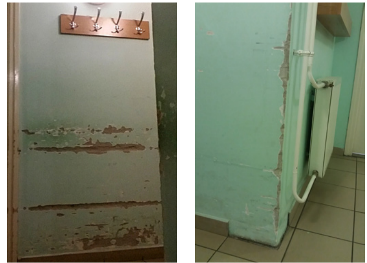
Több mint fél tucat ezekhez hasonló képet mellékel leveléhez olvasónk

Némi adalék lehet a vitához az az olvasói levél, amit a közelmúltban kaptunk, több fotó kíséretében. Olvasónk, aki neve mellőzését kérte, az ajkai kórház fertőző osztályának állapotára hívta fel a figyelmünket. „Borzalom sok ember számára a látvány is. Hát még milyen lehet ott dolgozni?! Fertőzőből fertőző?! (vizesedések, doh, lemálló vakolatok mindenütt, még szegény dolgozók irodájában is.)” – írta levelében, amit több képpel illusztrált.