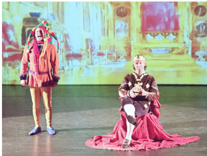
A királyi udvarnak elmaradhatatlan kelléke a bohóc is, aki nem mindig jókedvű

A művelődési központ gyermekszínházi sorozatában a Nektár Színház mutatkozott be március 7-én és 8-án, Rigócsőr király című mesejátékával. Három előadáson közel nyolcszáz kisiskolás és négyszáz óvodás izgulhatott Garullina királykisasszonyért, akinek kezdetben csak a külsőségek számítanak, így kéri hadát utasítja el és gúnyolja ki. Rexon király a Rigócsőr nevet kapja a fennhéjázó királykisasszonytól, ám a kérő ennek ellenére halálosan beleszeret. A Grimm testvérek meséjéből ezúttal sem hiányzott az álruha, hiszen másnap koldusként újra szerencsét próbál a királyfi. Mindeközben az öreg király, megunva lánya viselkedését, úgy rendelkezik, hogy az első férfiemberhez hozzáadja, aki a palotába bebocsájtást kér. Ki más lehet ez a szerencsés, mint az álruhába bújt Rexon király. Innentől kezdődik az