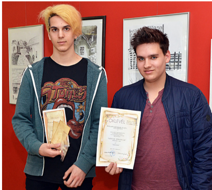
Két garantáltan illetudó fiatal