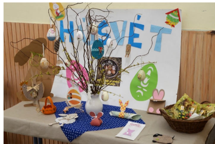
Sok jó ötletet vihettek magukkal a résztvevők

Példa értékű ez az együttműködés a művelődési központ és az oktatási intézmények között. A jelenlévők nem tudnak a megyében hasonló összefogásról. Természetesen ennek a rendszeres közös munkának a tanítványok a nyertesei, hiszen a gyermekkorban beivódott alkotásvágy elkíséri őket újtukon, akár hobbi szinten, akár profi módon. Mindezt nyomon lehet követni az egyre népszerűbb kézműves termékek elterje-