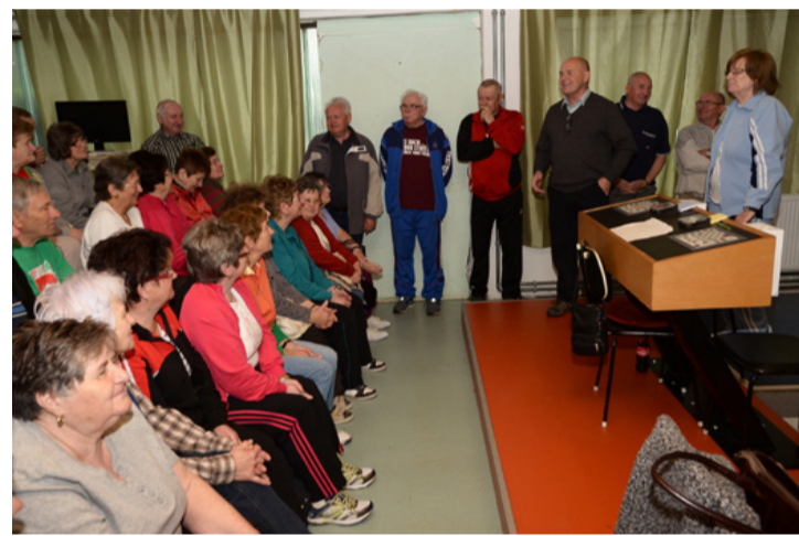
A jókedv is elengedhetetlen összetevője volt a nyugdíjasok tekeversenyének

A tósokberéni tekepályán bonyolították le immáron 15. alkalommal a nyugdíjasklubok városi teke versenyét március 24-én.