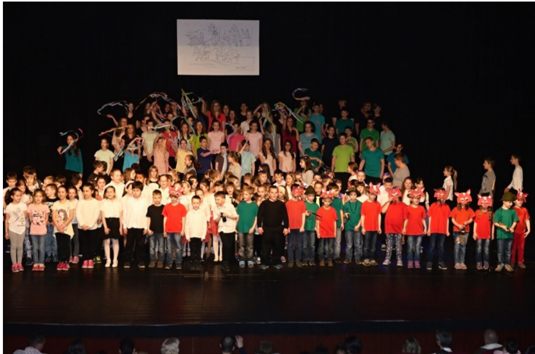
A gála gálája, színpadon az összes szereplő