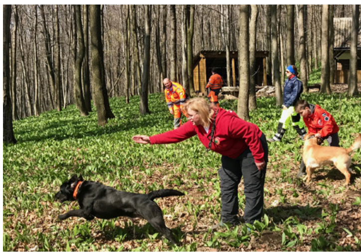
Gyakorlatzó mentőkutyások a Bakonyban

Katasztrófa sújtotta térségekbe, romok közé, erdős részekre vagy éppen lápos vidékekre vezet az útjuk, hogy megtalálják az eltűnteket. Az extrém körülmények megnehezítik a keresést, de nem állíthatják meg a csapatot, hiszen ők jelentik az egyik utolsó reménységűt azoknak a családoknak, akiknek a hozzátartója elszökött, elveszett, vagy más okok miatt nem ment haza.