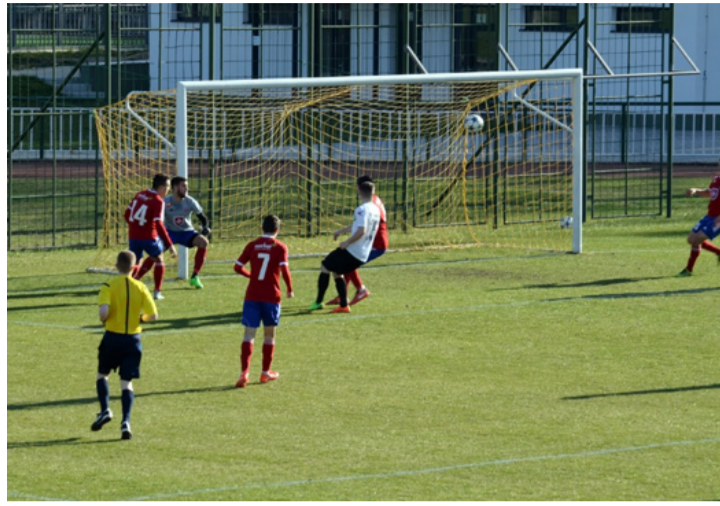
A fehérvári kapus csak néz: hát ez a labda meg honnan került oda?

Az FC Ajka simábban is nyerhetett volna, a Kristály sebbnél sebb gólokat szerzett. A kézilabdázók és a tekezők is diadalt ünnepelhetek.