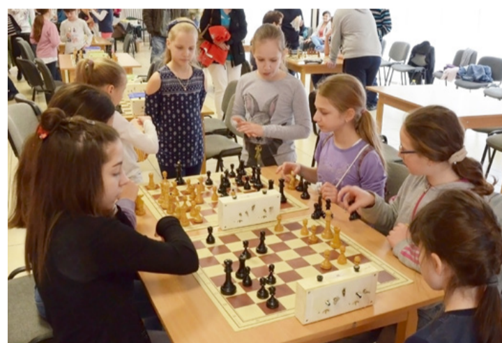
Egymás partijából is igyekeztek tanulni a versenyzők

Az alsós lányoknál és fiúknál egyaránt a tapolcai Bárdos Lajos Általános Iskola csapatai mérettethetik meg magukat legközelebb. A felsős lányok mezőnyében a városlódiek bizonyultak a legjobbnak, míg a felsős fiúk között