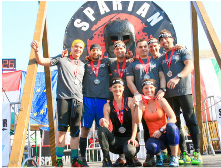
Boldog ajkaiak a Spartan Race végén

Labdarúgóink és kézilabdázóink is magabiztos győzelmekkel zárták a hétvégét. Sok ajkai vett részt az embert próbáló Spartan Race-en Veszprémben.