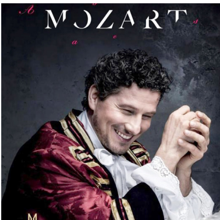
Wolfgang Amadeus Rákász

Rákász Gergely koncertorgonista időről-időre visszatér Ajkára, hogy a Jézus Szíve templomban megidézzé egy-egy