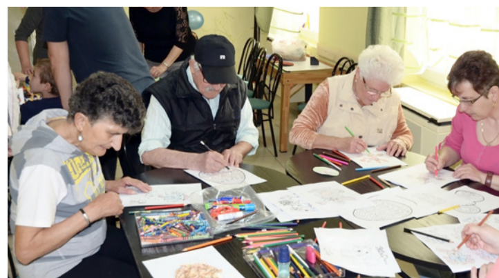
Minden évben más dekorációt készítenek az érdeklődőkkel