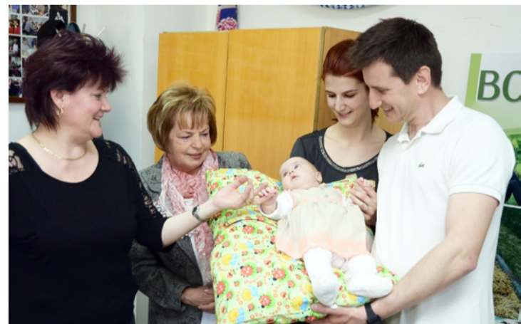
Janka jól érezte magát a puha pihepaplanon

A sudrin a térség önkormányzati képviselője, Gerencsér Hilda, köszöntőjében elmondta, hogy a tollfosztás után régén a tollból ágyneműt készítettek a fiatal lányoknak. Az ágynemű, miután férjhez mentek, egy új élet kezdetét könnyítette meg. A klubtagok által készített paplan is egy új élet kezdetét teszi