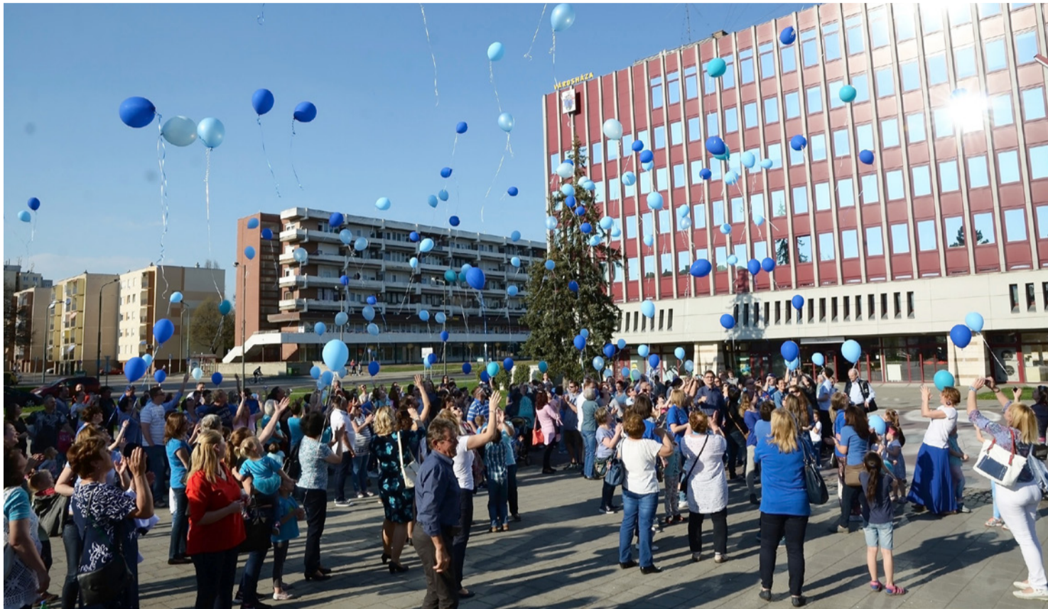
Kék lufik felengedésével is az autizmus problémáira hívták fel a figyelmet