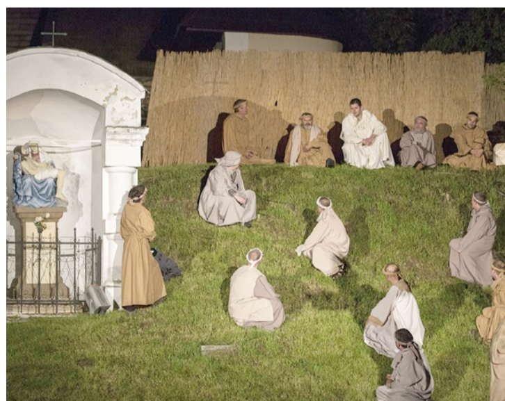
Kihagyhatatlan nyárindító program a Kálváriadomb festői környezetben