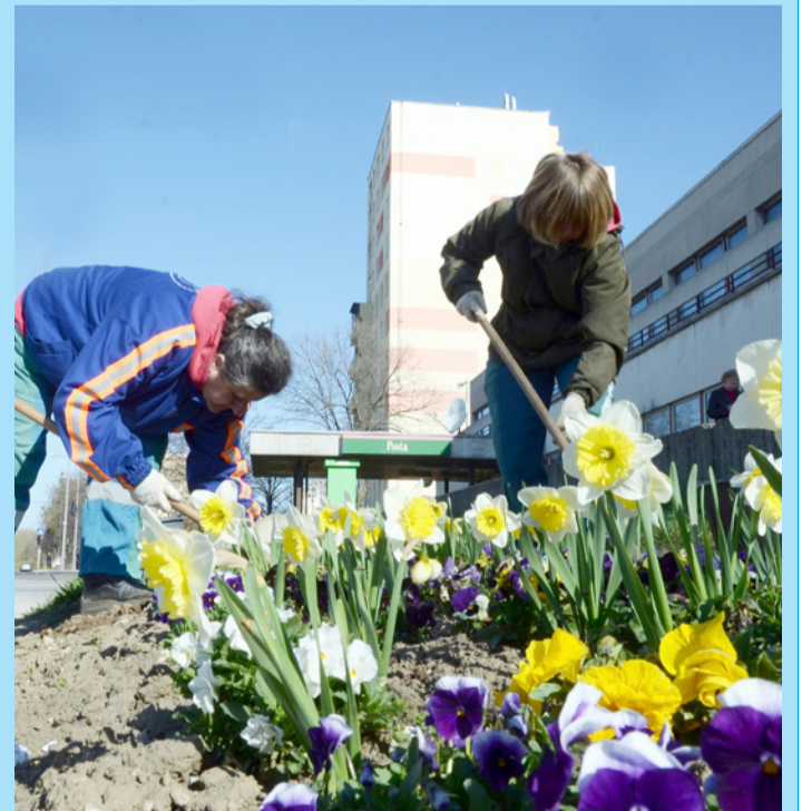
Már nyílnak a nárciszok is

nok, a krókuszok. A tereket, a szabadidőközpont és a Kaszinó előtti részt, a Városligetet, a szoborparkot és környékét ellepték a virágok.