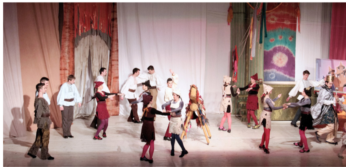
Látványos jelenetekben bővelkedett az előadás