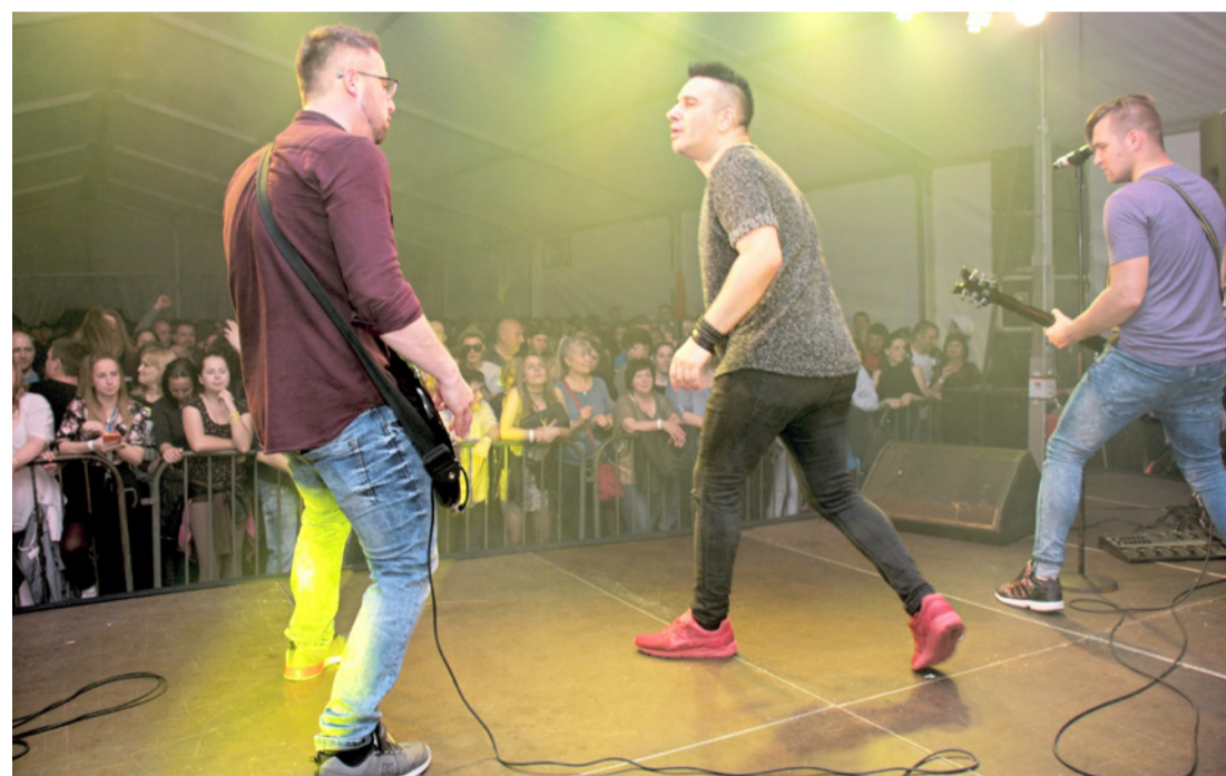
Jó partinak lehettünk részesei

Az éjjel egy órakor még a sorban álló tömeg első hallásra valószínűleg áprilisi tréfának gondolhatta, amikor a biztonsági személyzet közölte velük, hogy sajnos már csak azt van lehetőségük beengedni, akik előre megváltották a jegyüket, a hely befogadóképessége ugyanis vérszesen közeledett a maximumhoz. Aminek a biztonságát nem sokkal előtte ellenőrizte a Katasztrófavédelem is, akik úgy tudjuk, azok megfelelő kialakítása, úgy, hogy a buli helyszínét senkinek ne kelljen ehhez elhagyni, de mégis ki tudjon menni a dolgát elvégezni, dohányozni, vagy csak egy kicsit levegőzni. A biztonsági személyzet is tette a dolgát, az alapos belépte-