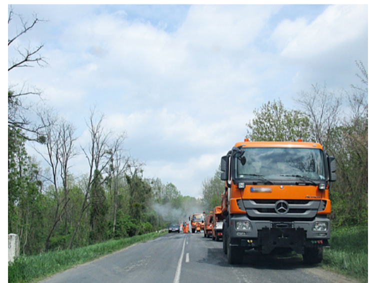
Archív fotónk az Ajka – Úrkút közötti összekötő úton készült