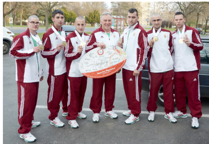
Az ajkai győztesek, középen az edző