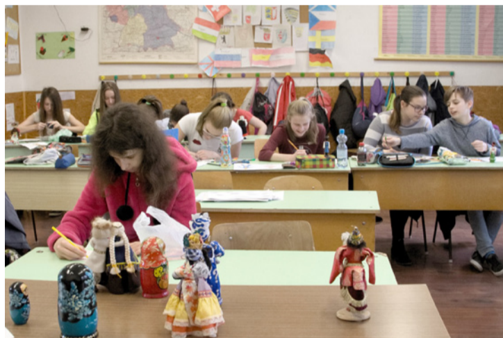
A matrjoska babák lerajzolása a legnehezebb feladatok közé számított