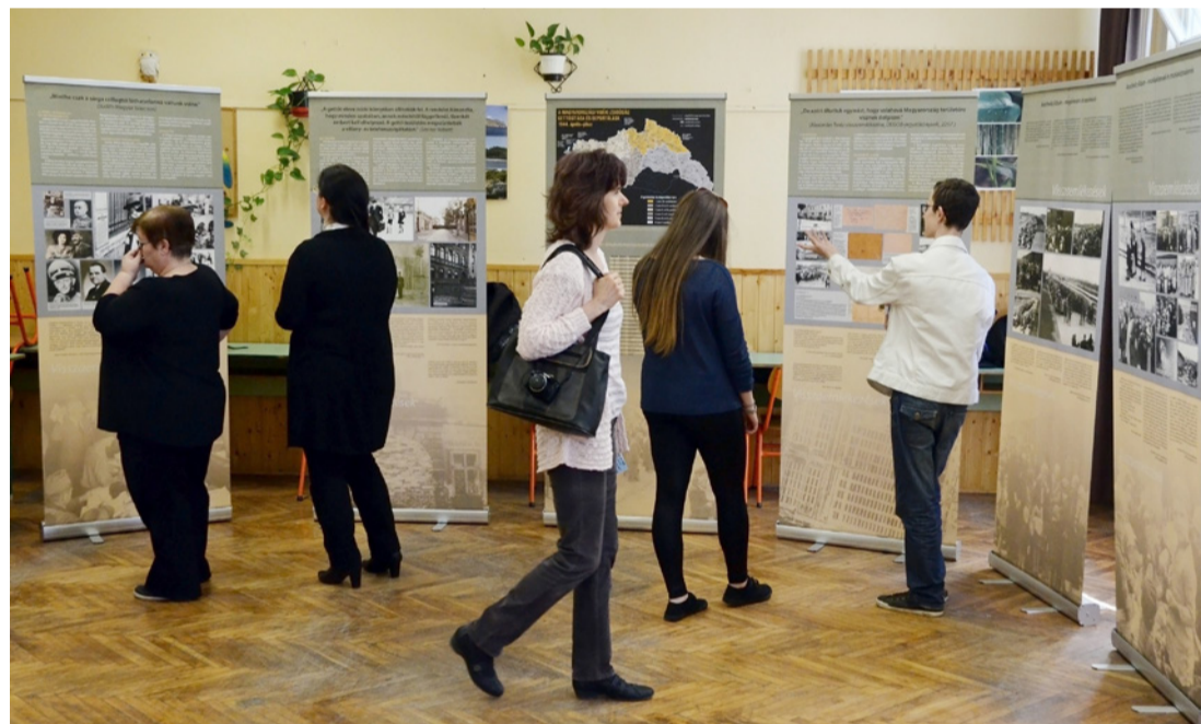
Néha egy-egy korabeli fotó többet mond mindennél

A táblákon tudományos alappal feltárt és történelmileg hiteles tényeket láthattak a gimnazisták, megismerve általa a holokauszt legsötétebb korszakát.