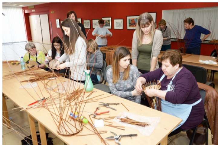
Szorgos kezek első próbálkozása