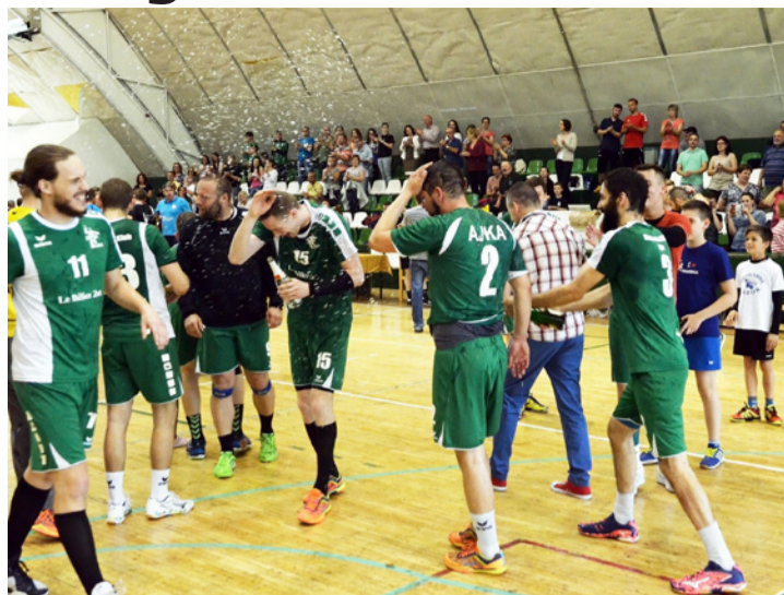
Így ünnepezték a kézilabdás bajnokcsapat